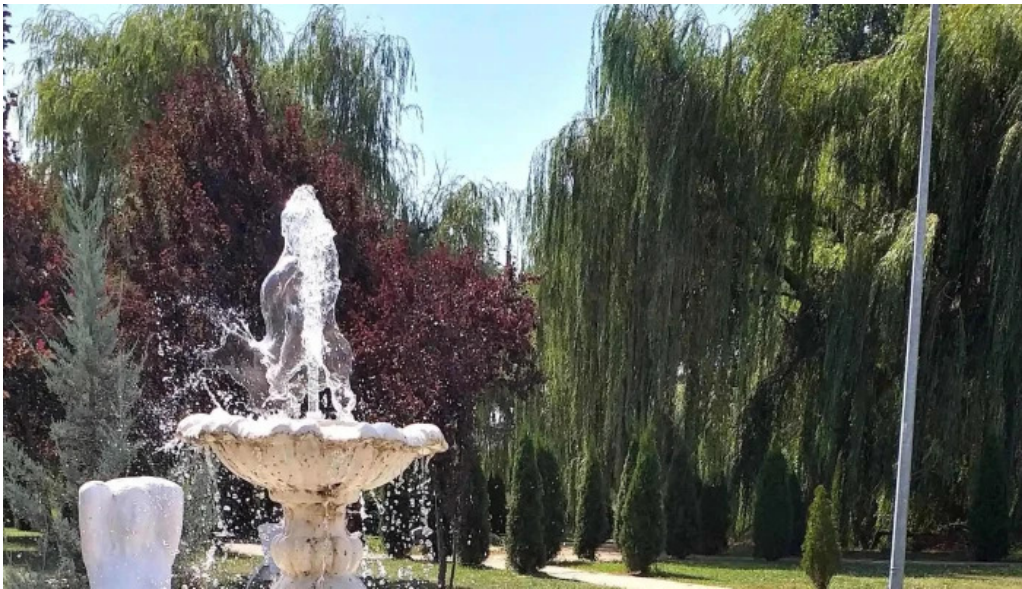
Strand termal municipal marghita scor