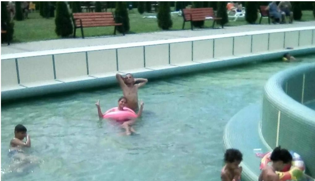
Strand termal municipal marghita cum s? ajungi acolo