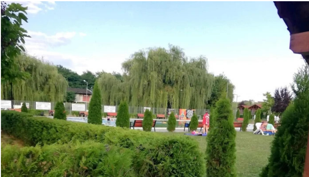
Strand termal municipal marghita pre?uri