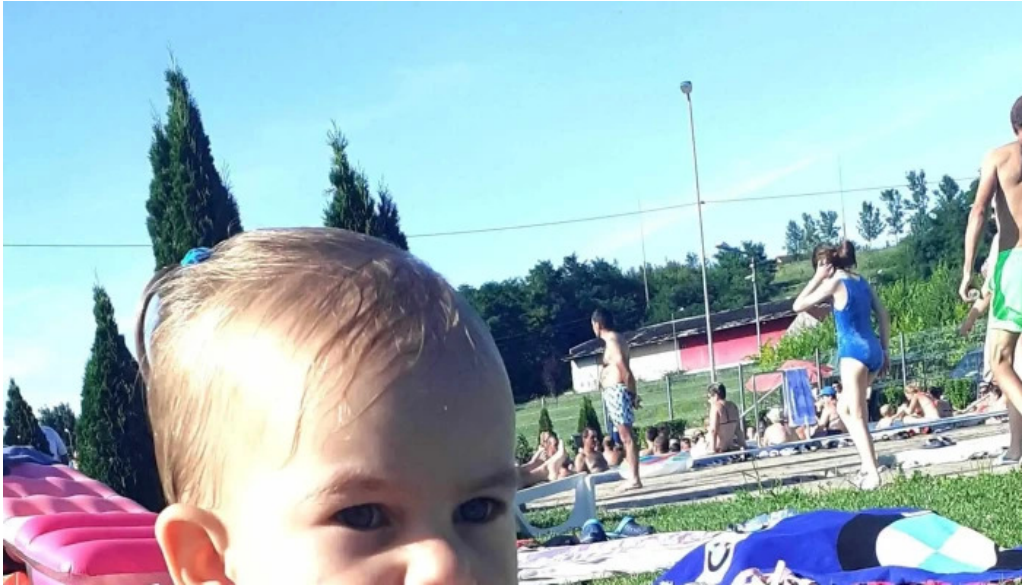
Strand termal municipal marghita site web