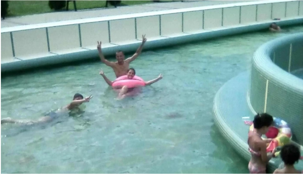
Strand termal municipal marghita marghita