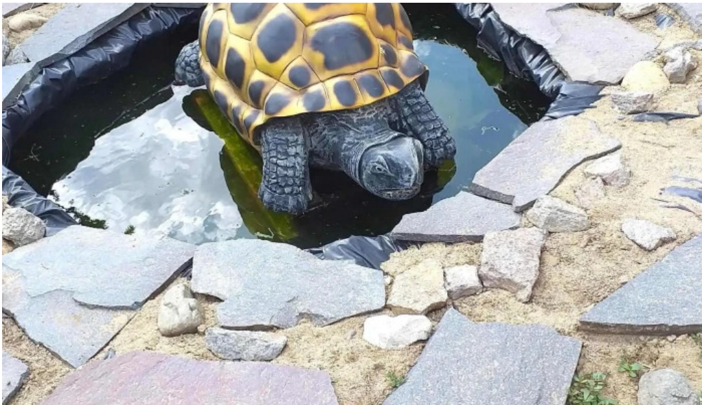
Strand termal municipal marghita loca?ie