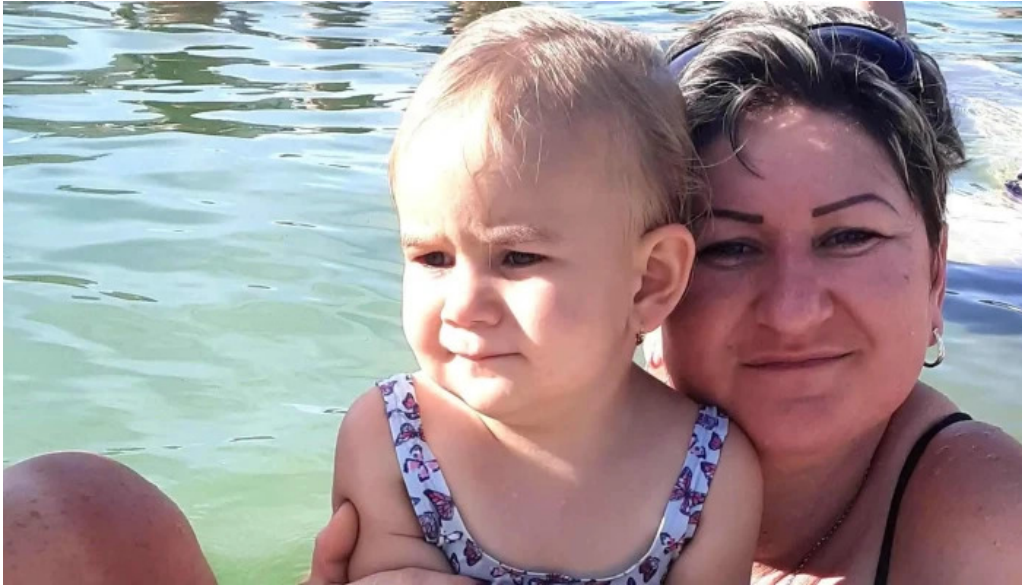
Strand termal municipal marghita program