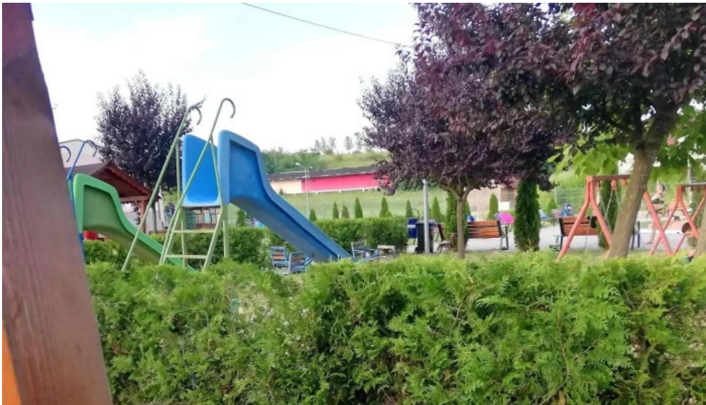
Strand termal municipal marghita num?r