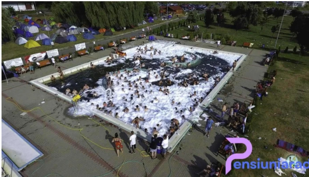
?trand termal municipal marghita marghita