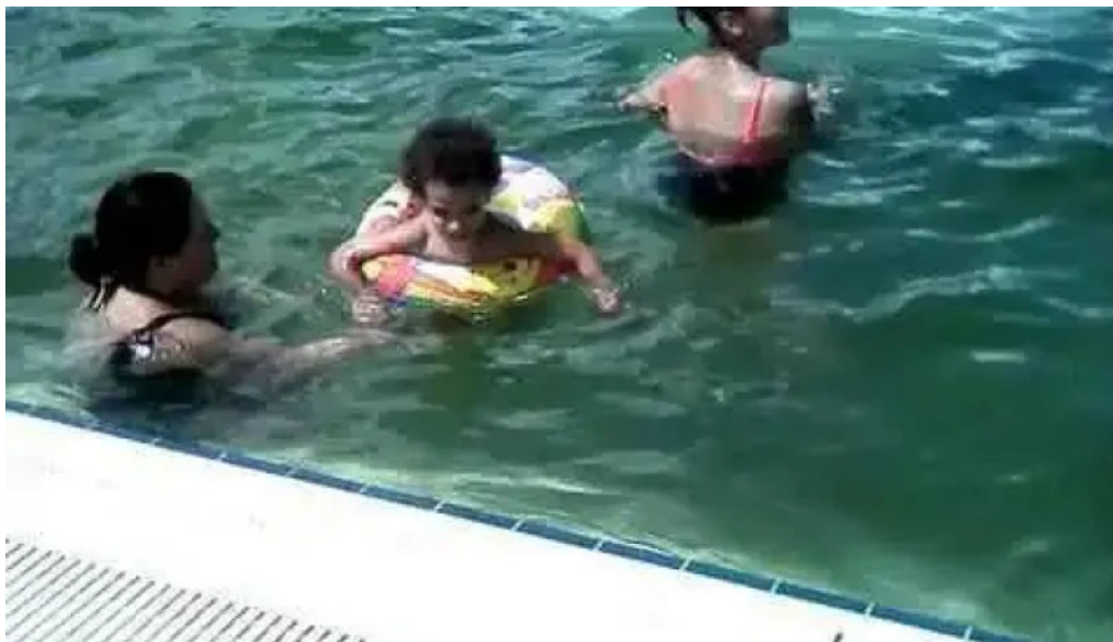
Strand termal municipal marghita videoclipuri