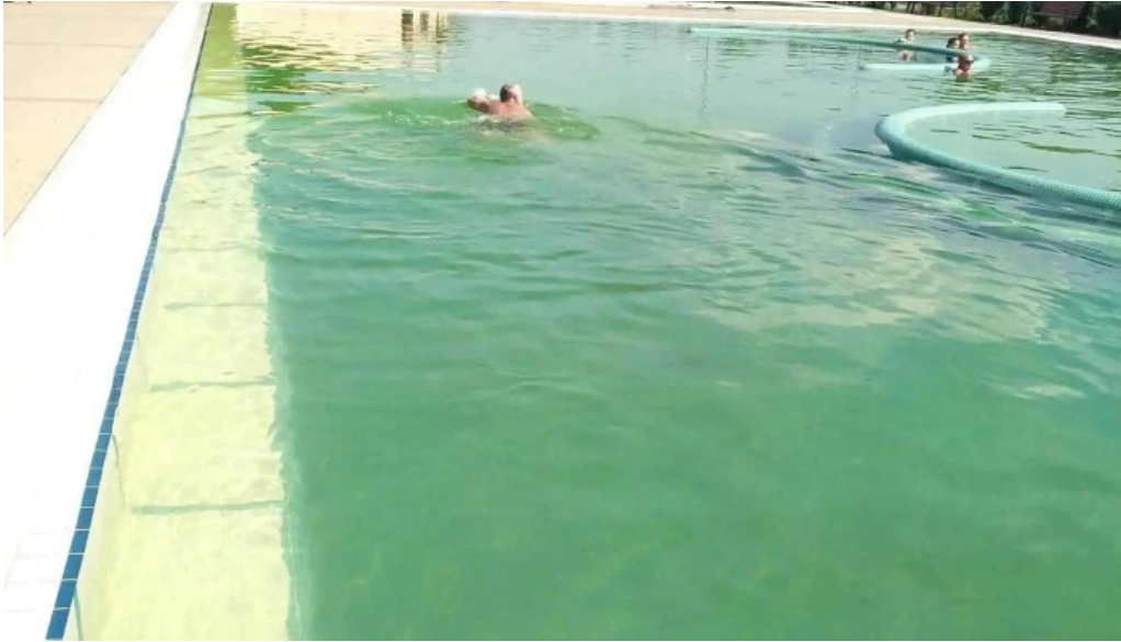
Strand termal municipal marghita piscina