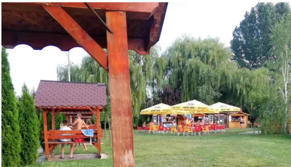
Strand termal municipal marghita catalog