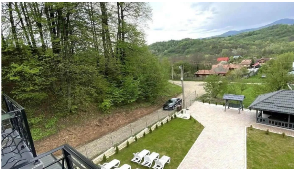
Casa dumitru cerasu catalog