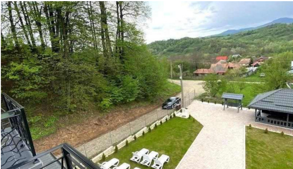
Casa dimitru cerasu cerasu