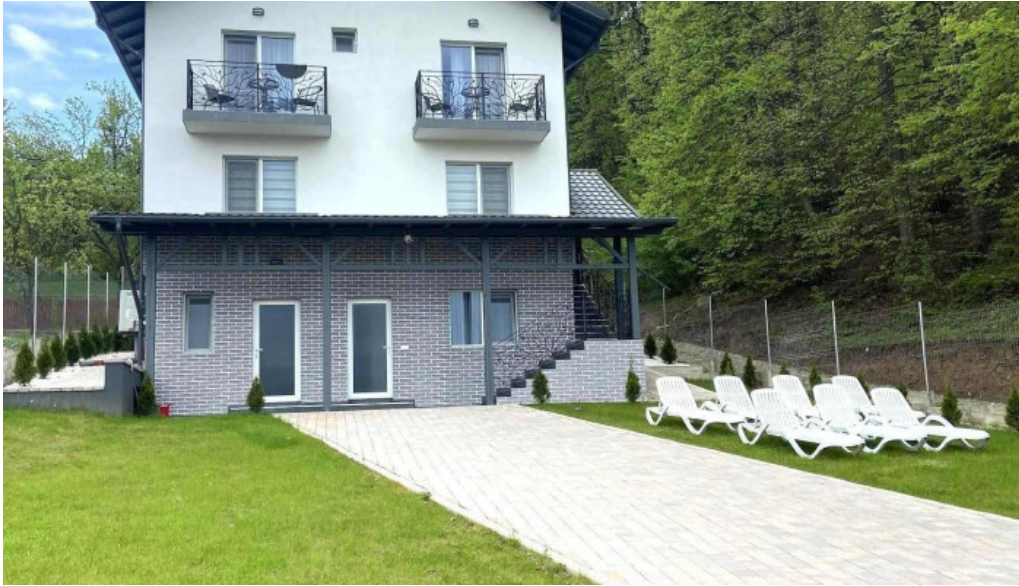
Casa dimitru cerasu de la vizitatori