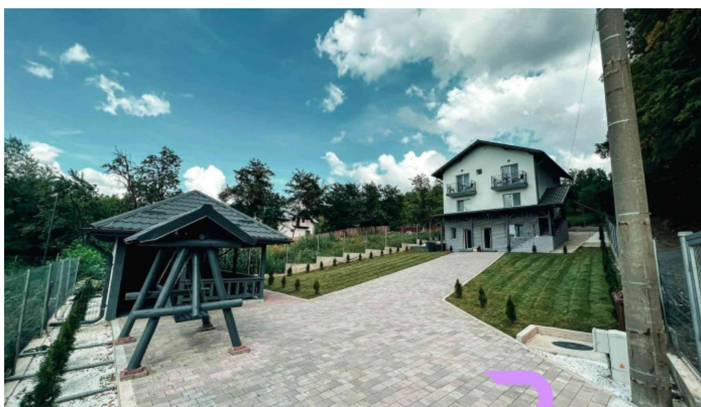
Casa dimitru cerasu exterior