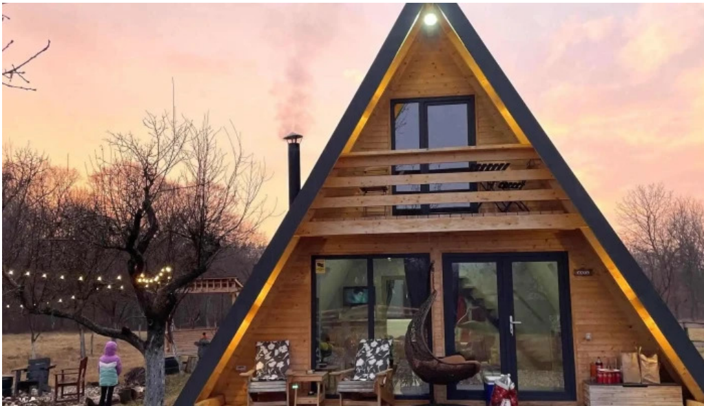
Casa maya scor