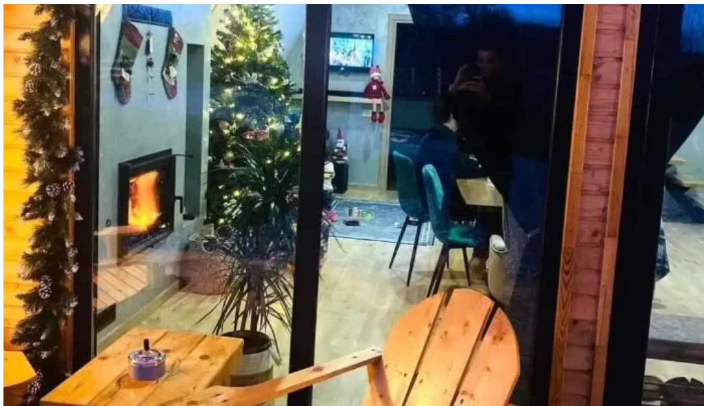
Casa maya de la vizitatori