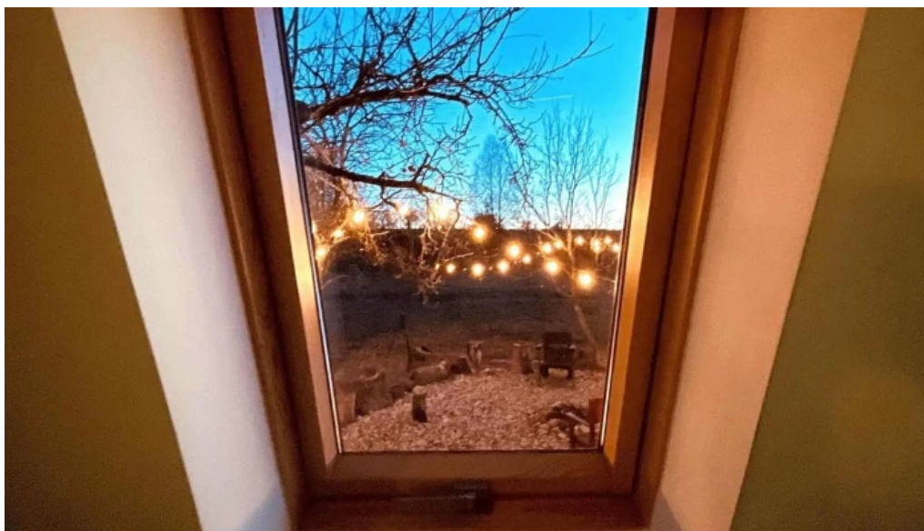
Casa maya campulung