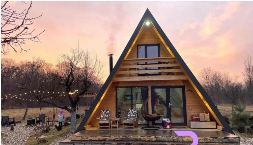
Casa maya exterior