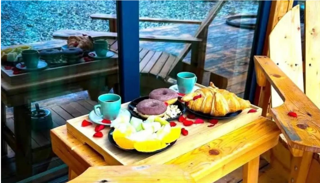
Casa maya mancaruribauturi