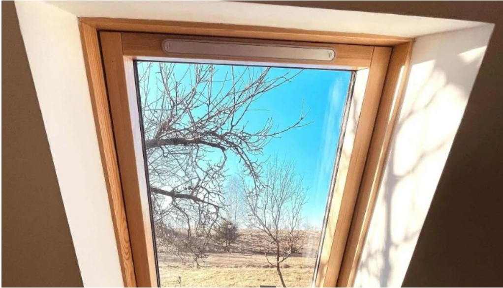
Casa maya zon?