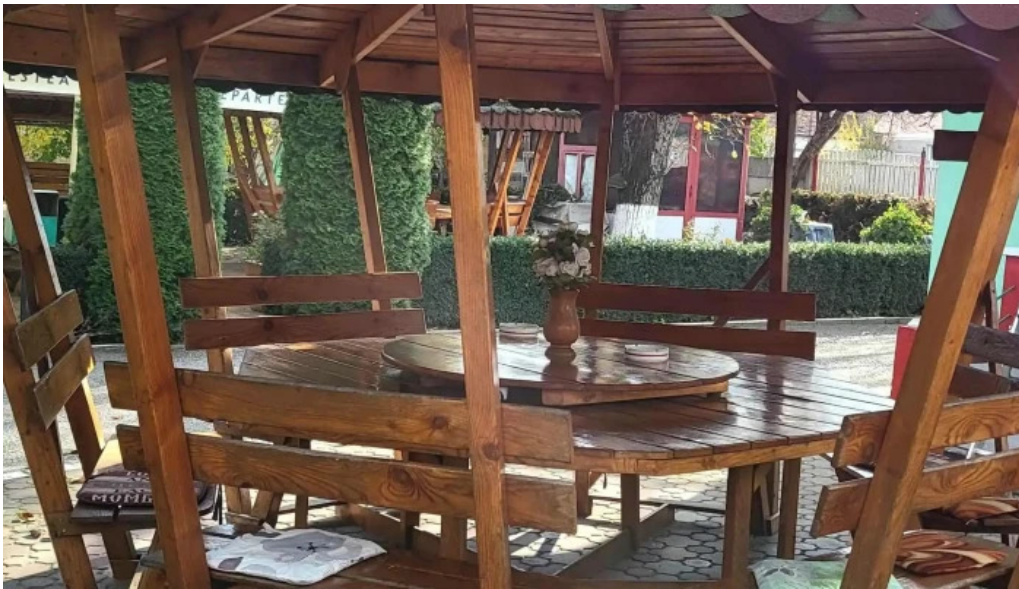
Pensiunea melinda comentarii