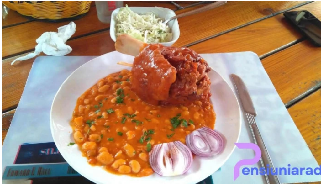
Pensiunea melinda mancaruribauturi