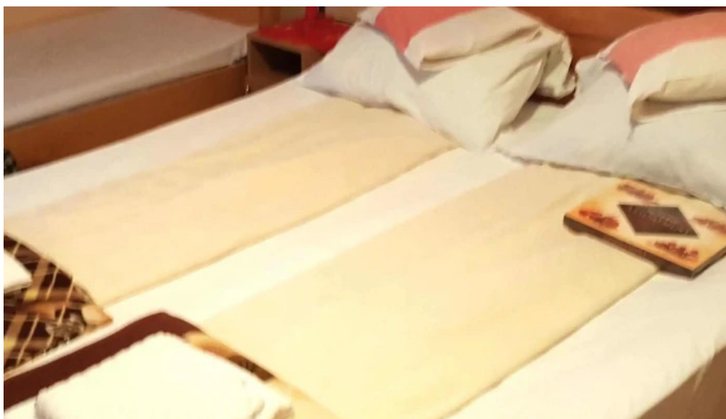
Pensiunea melinda program