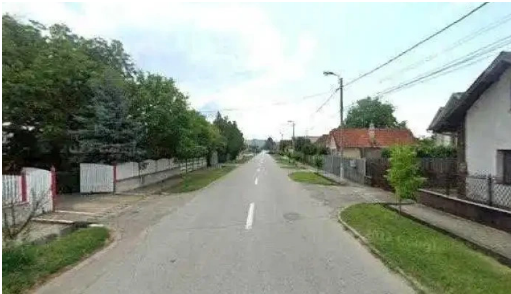
Pensiunea melinda street view si 360deg