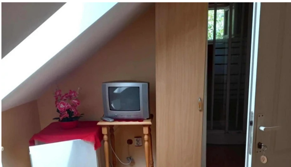
Pensiunea melinda aiud