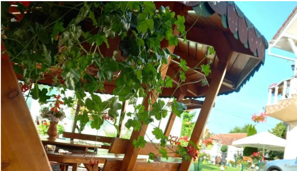
Pensiunea melinda aproape de mine