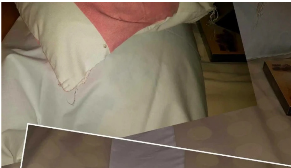
Pensiunea melinda reduceri