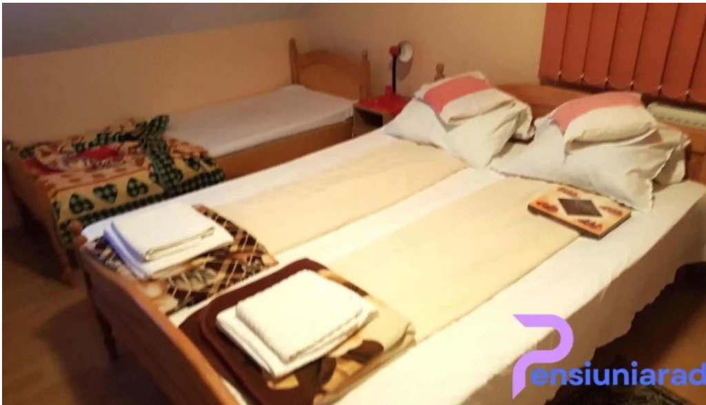
Pensiunea melinda camere