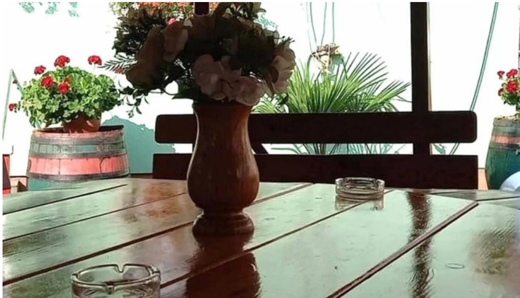
Pensiunea melinda instagram