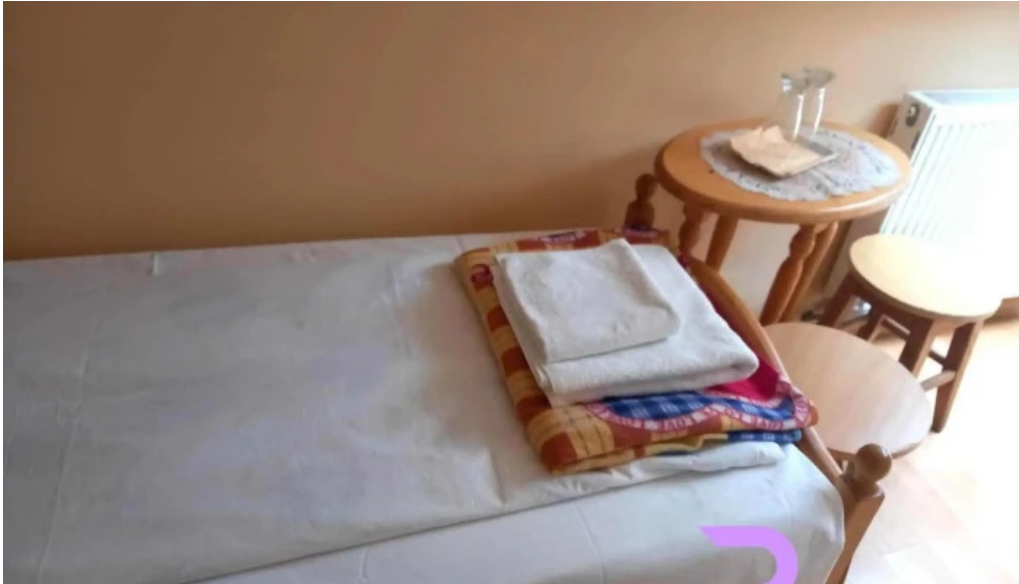
Pensiunea melinda de la vizitatori