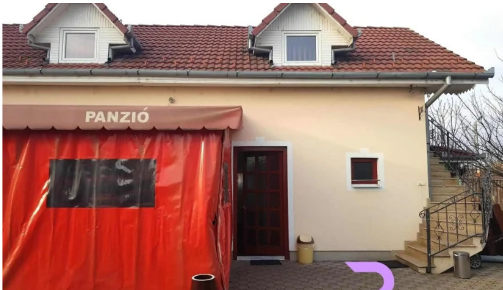
Pensiunea melinda exterior