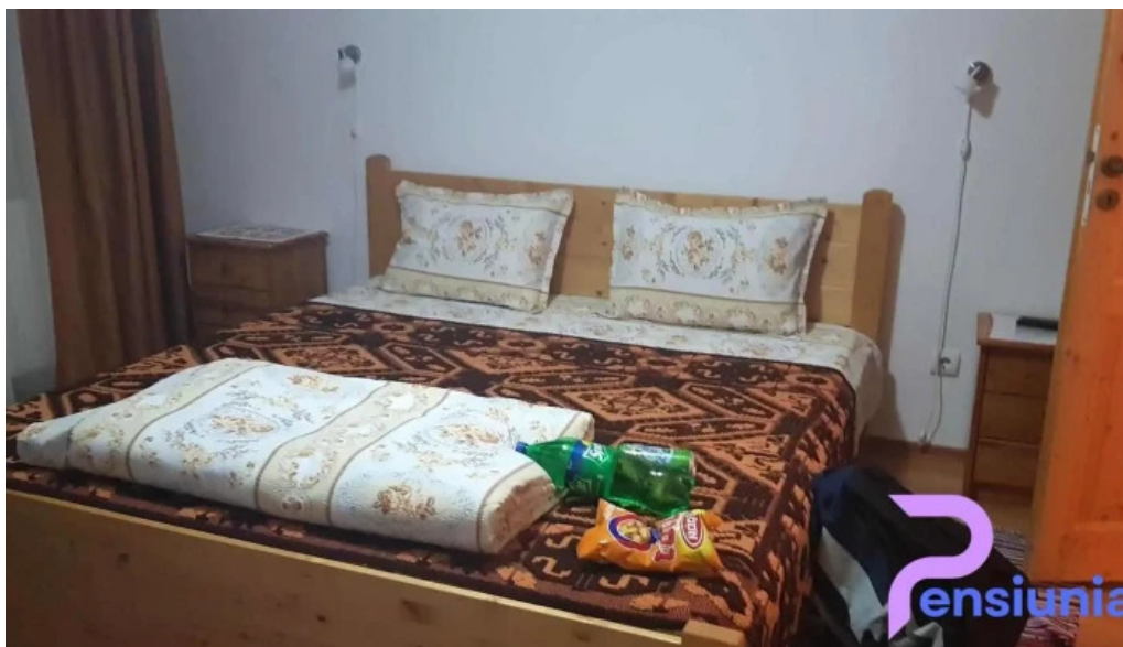
Pensiunea agroturistica ioana camere