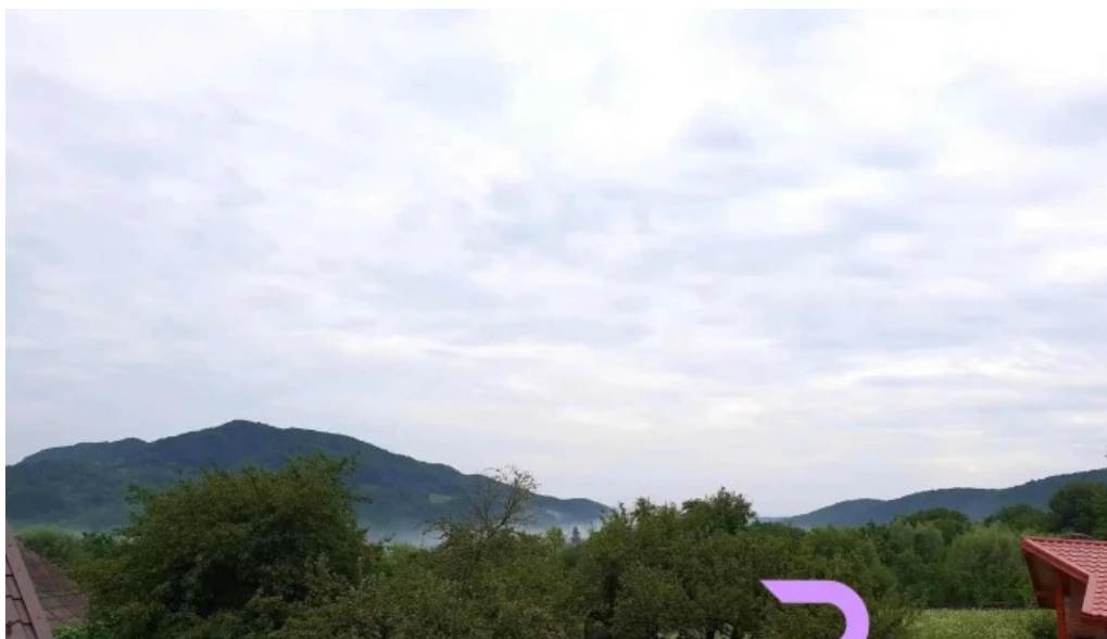
Pensiunea agroturistica ioana cabana