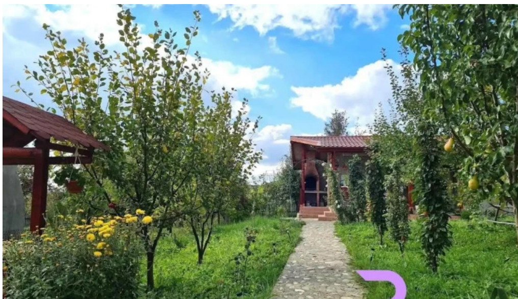
Pensiunea agroturistica ioana br?dule?