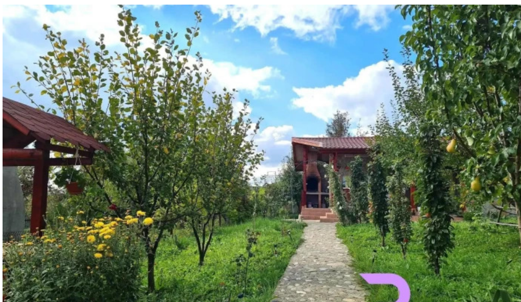
Pensiunea agroturistica ioana fotografii