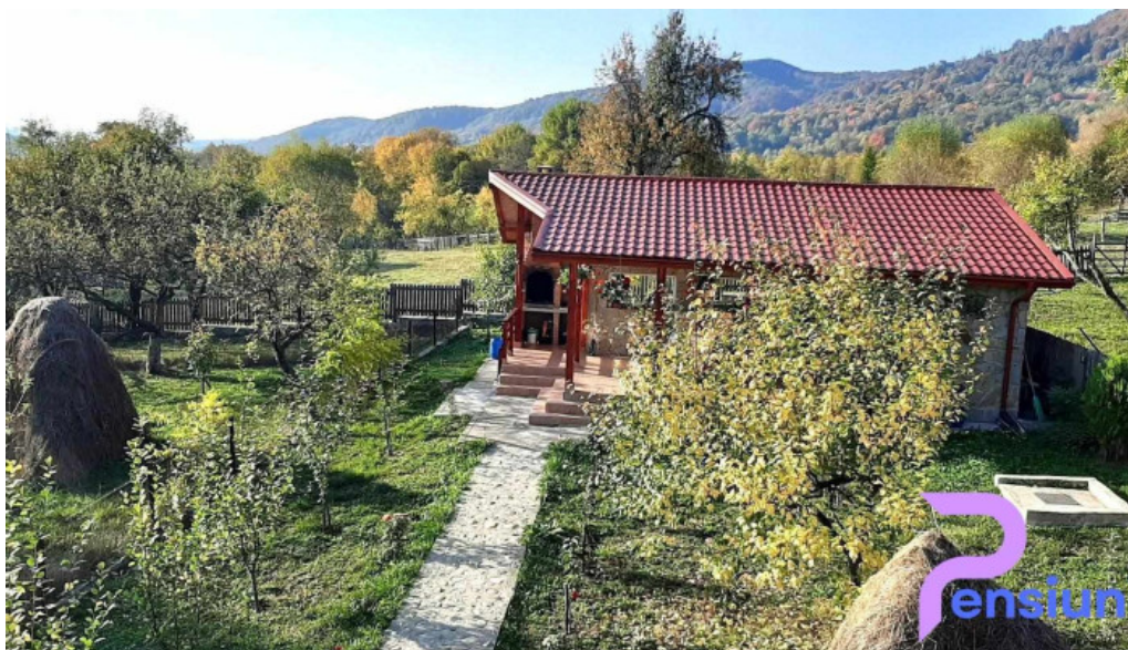
Pensiunea agroturistica ioana exterior