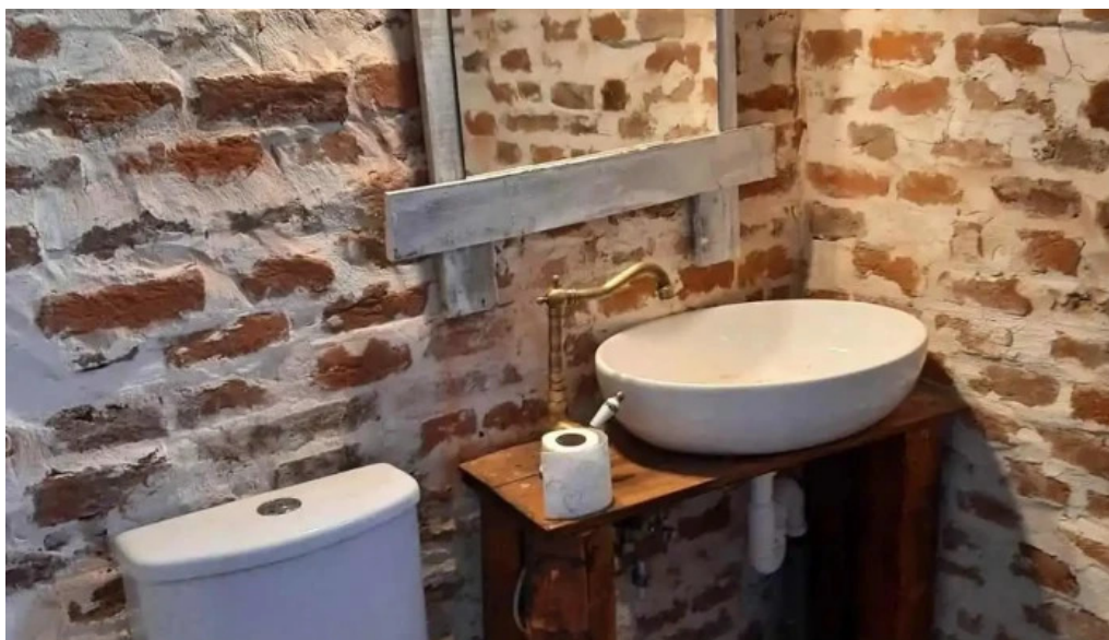
Campingul apusenilor camere