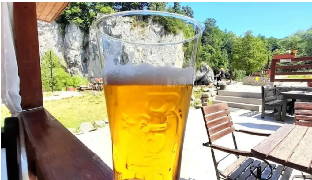
Campingul apusenilor mancaruribauturi