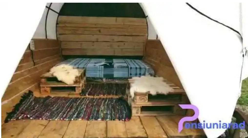
Campingul apusenilor de la proprietar