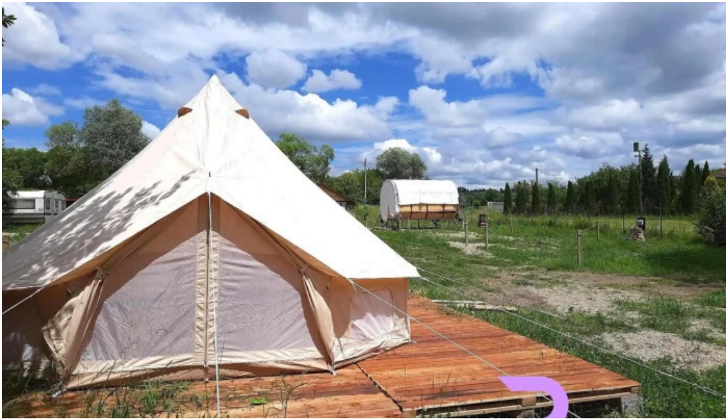
Campingul apusenilor program