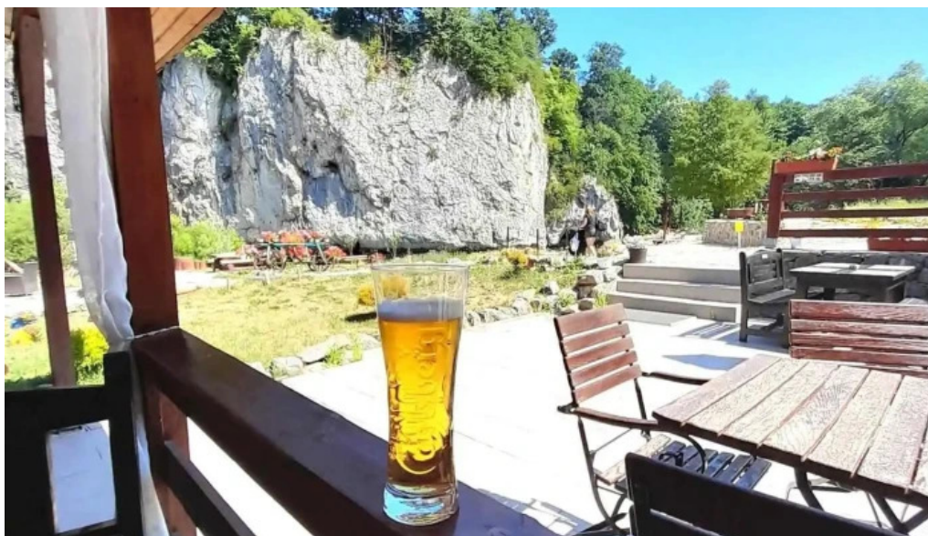
Campingul apusenilor de la vizitatori