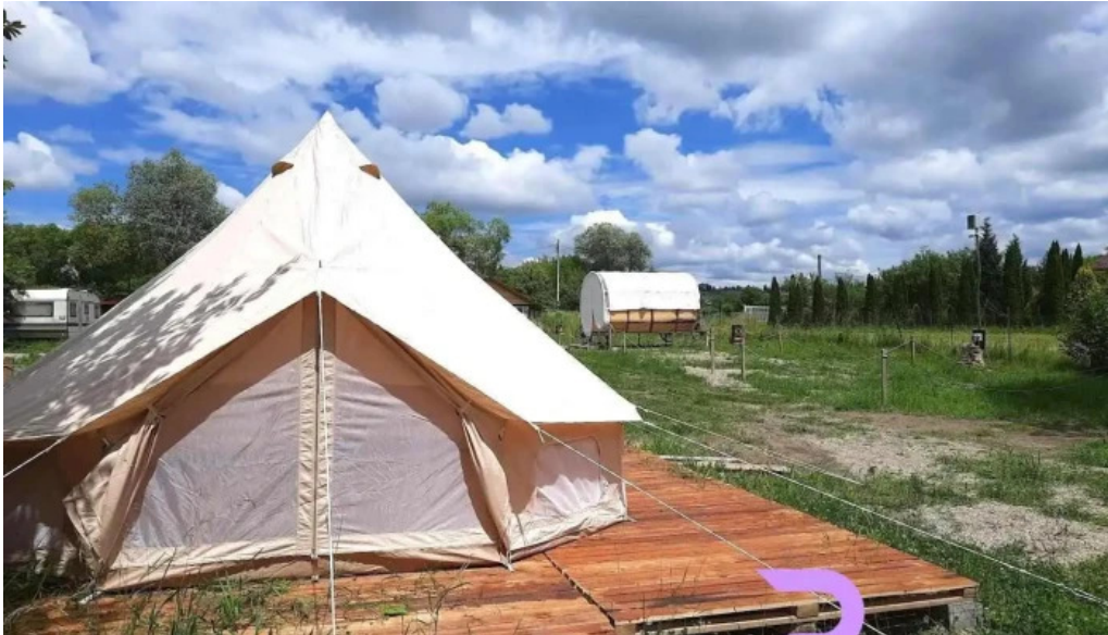
Campingul apusenilor ?uncuiu?