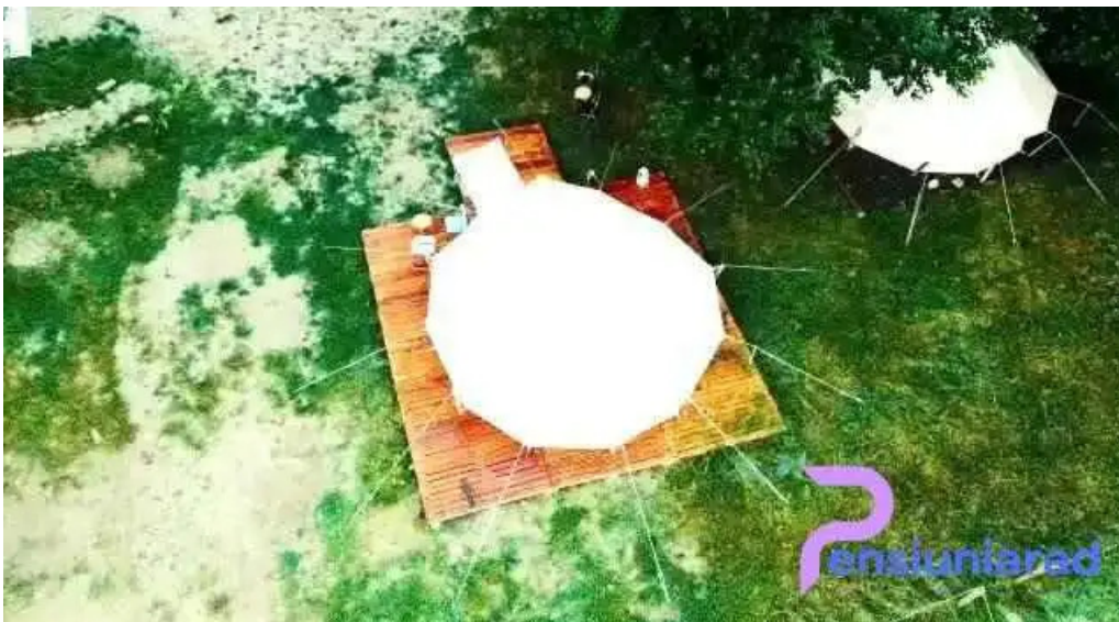
Campingul apusenilor videoclipuri