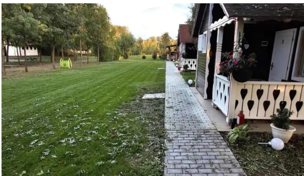
Camping hakunamatata de la vizitatori