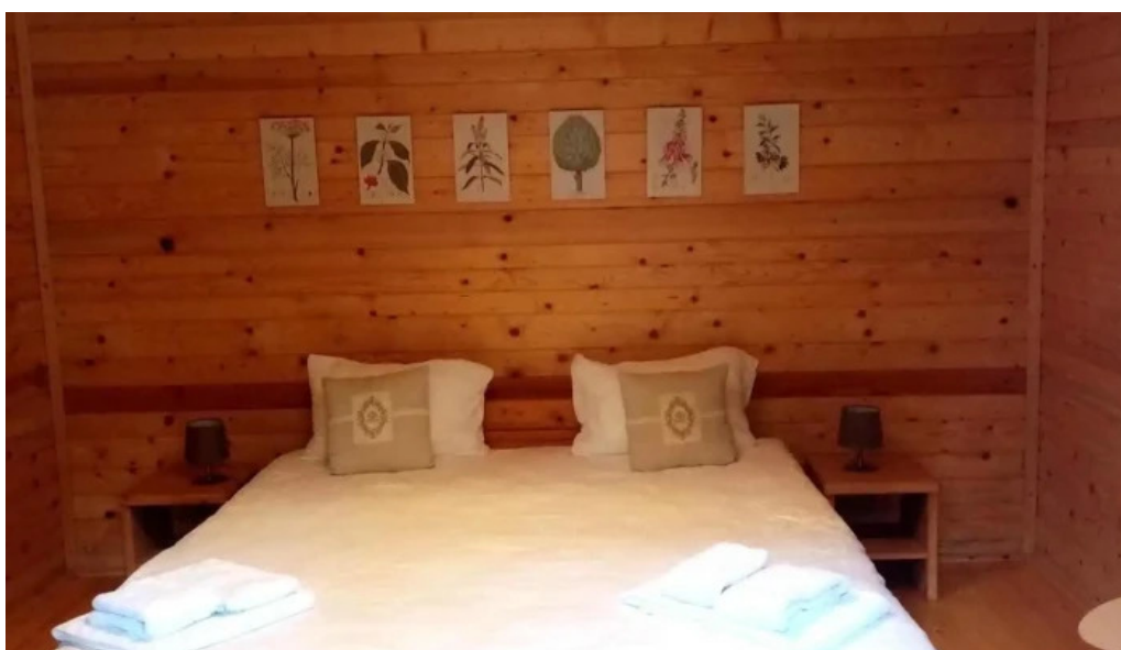
Camping hakunamatata camere