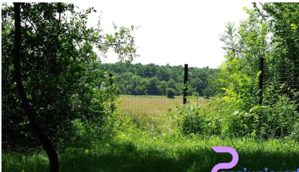
Camping hakunamatata de la proprietar