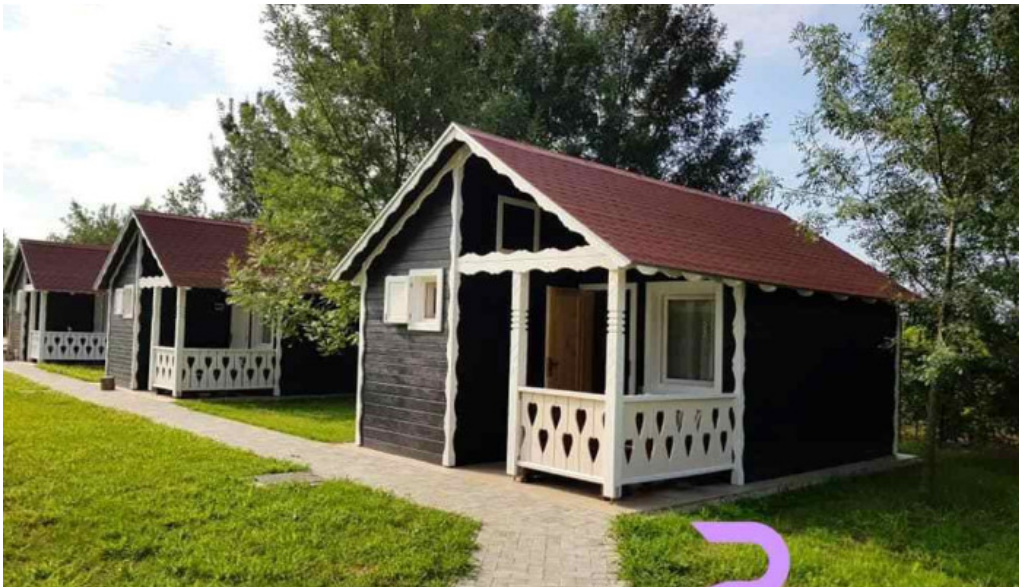
Camping hakunamatata exterior