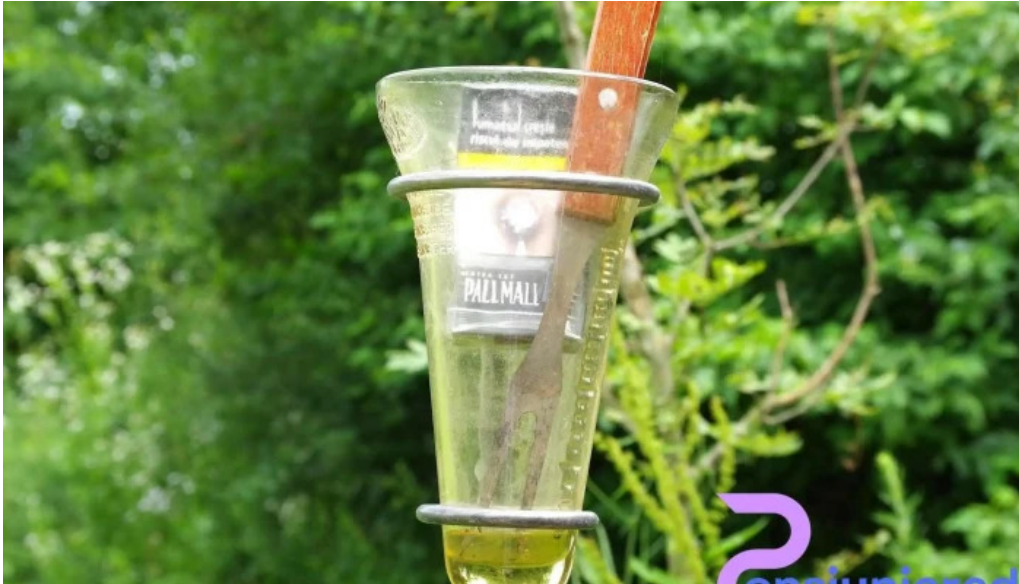
Camping hakunamatata mancaruribauturi