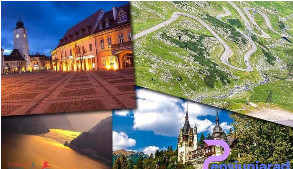
Camping hakunamatata promo?ie