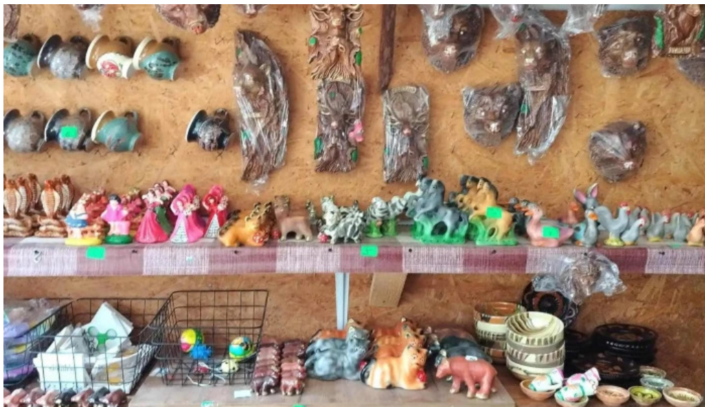
Mesterul olar aproape de mine