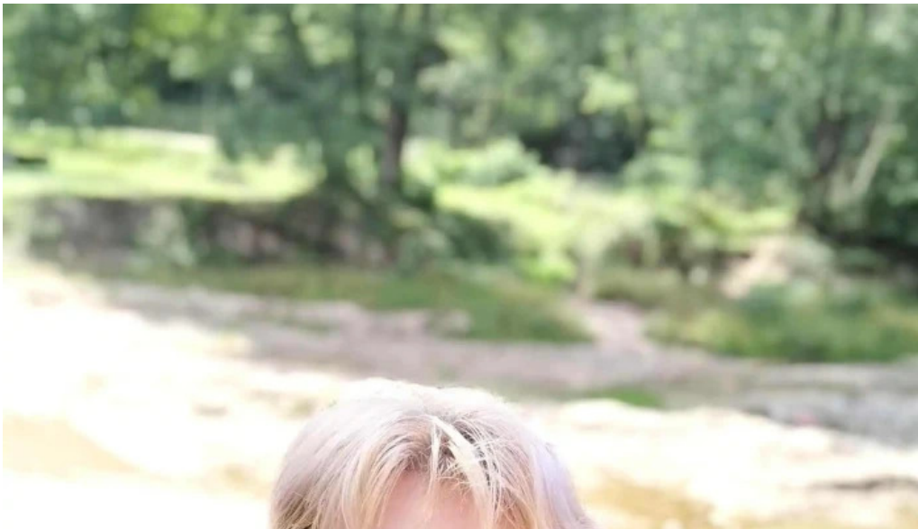
Mesterul olar program