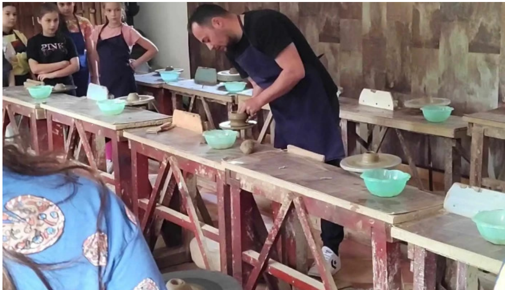
Mesterul olar catalog