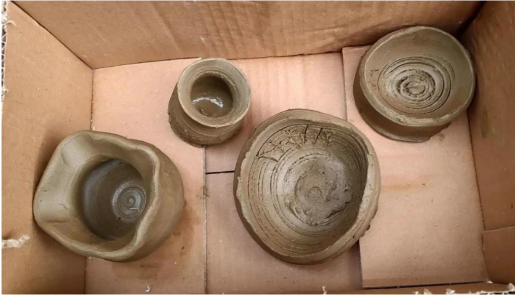
Mesterul olar site web