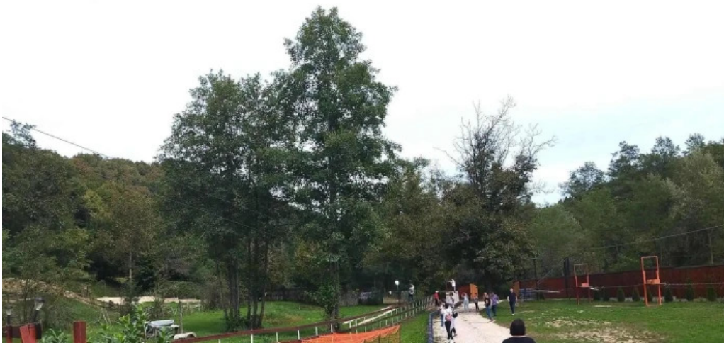
Mesterul olar loca?ie