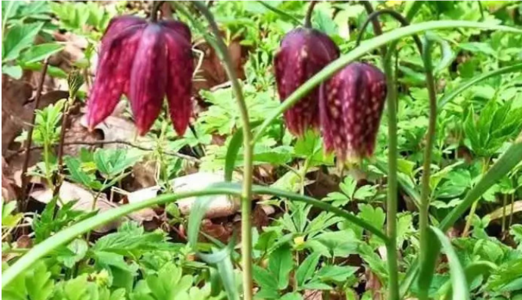
P?durea zamostea lunc? romania