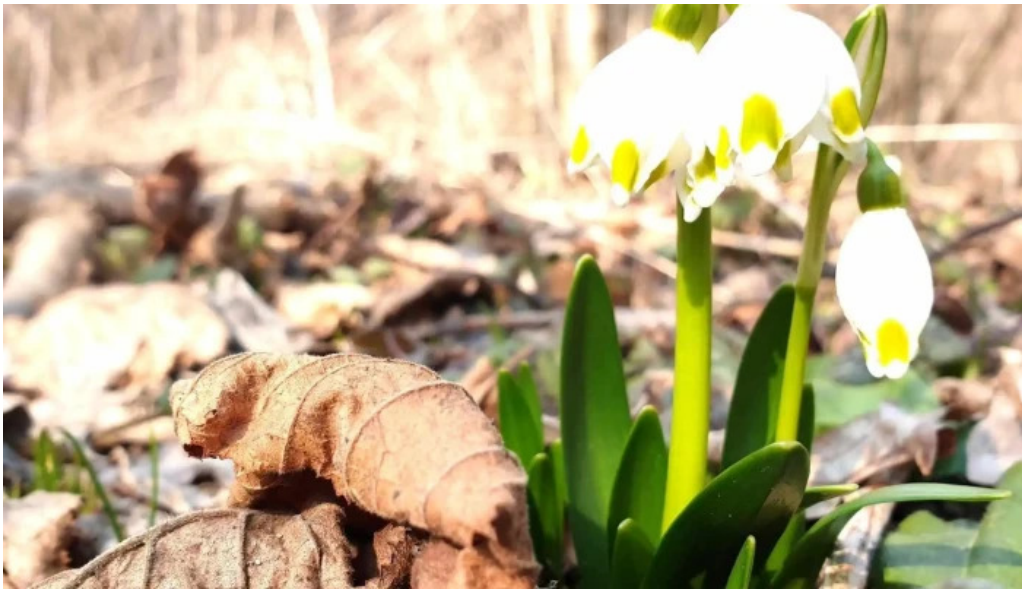
Padurea zamostea lunca reduceri