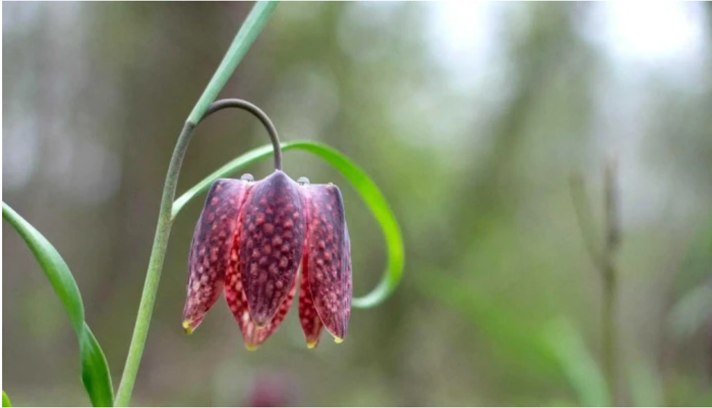
Padurea zamostea lunca fotografii