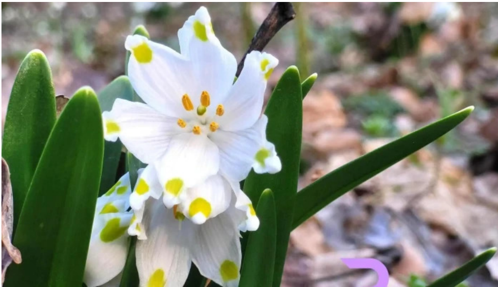
Padurea zamostea lunca cele mai recente