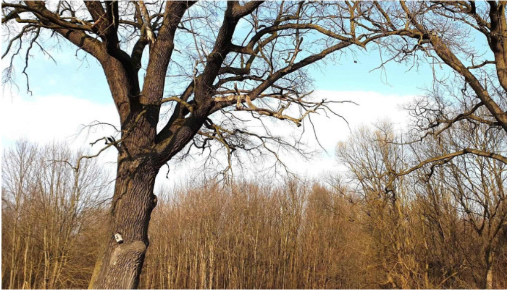
Padurea zamostea lunca romania