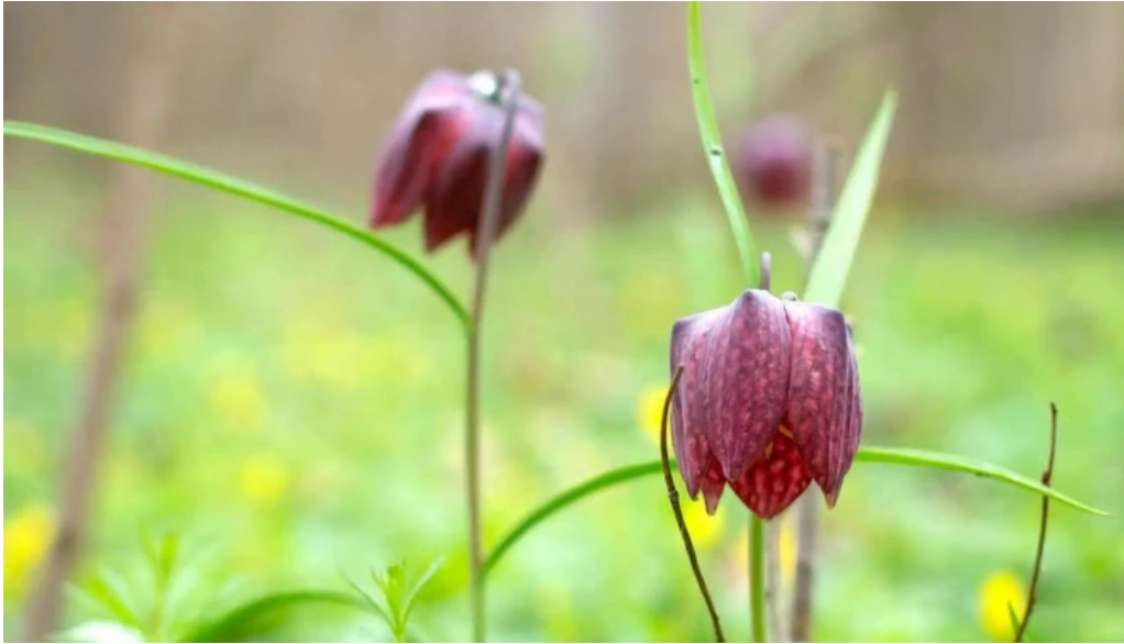
Padurea zamostea lunca site web