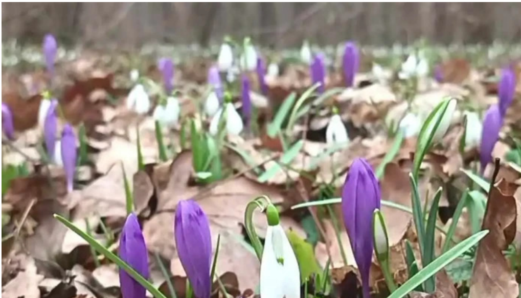
Padurea zamostea lunca videoclipuri