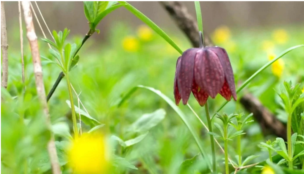
Padurea zamostea lunca scor