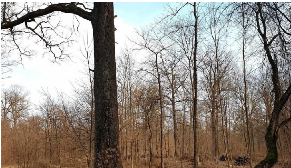
Padurea zamostea lunca aproape de mine