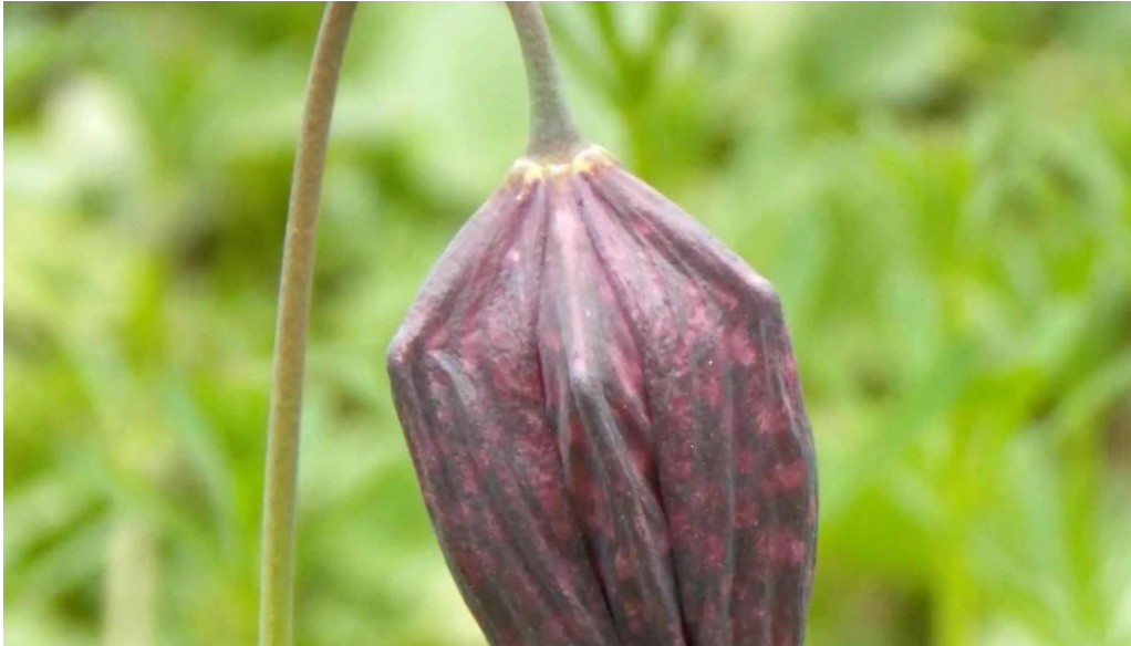
Padurea zamosteana lunca num? r