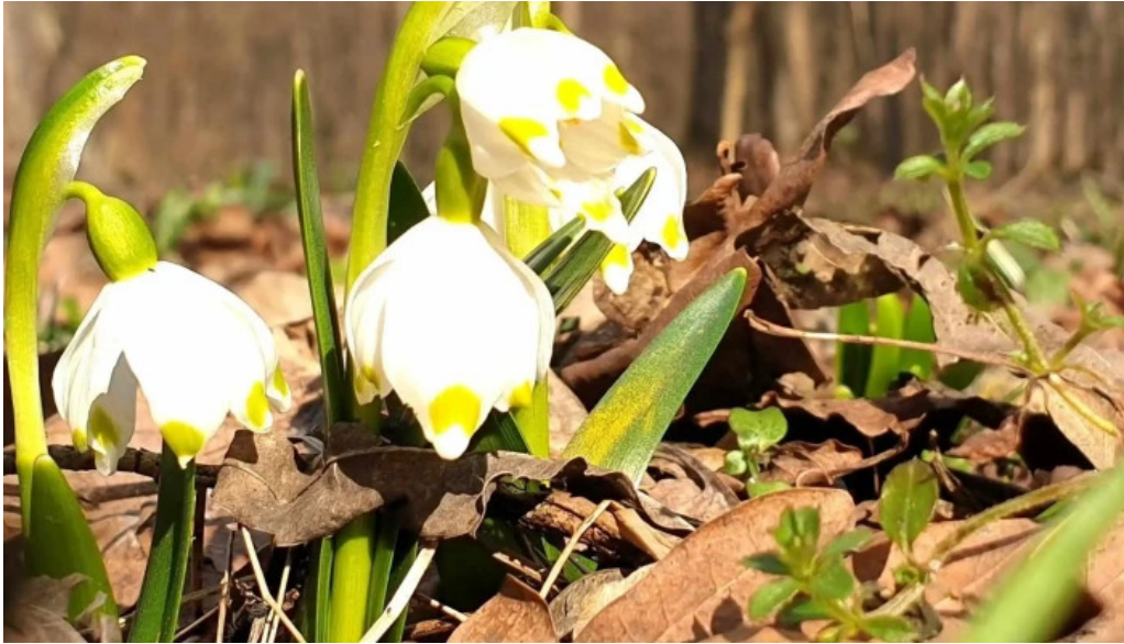
Padurea zamostea lunca program