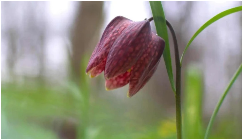
Padurea zamostea lunca pre?uri