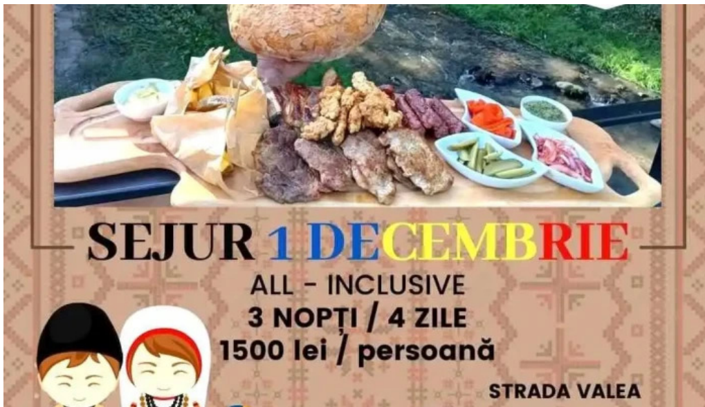
Complex turcana transalpina meniu