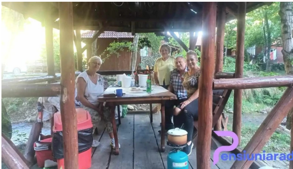
Complex turcana transalpina atmosfera