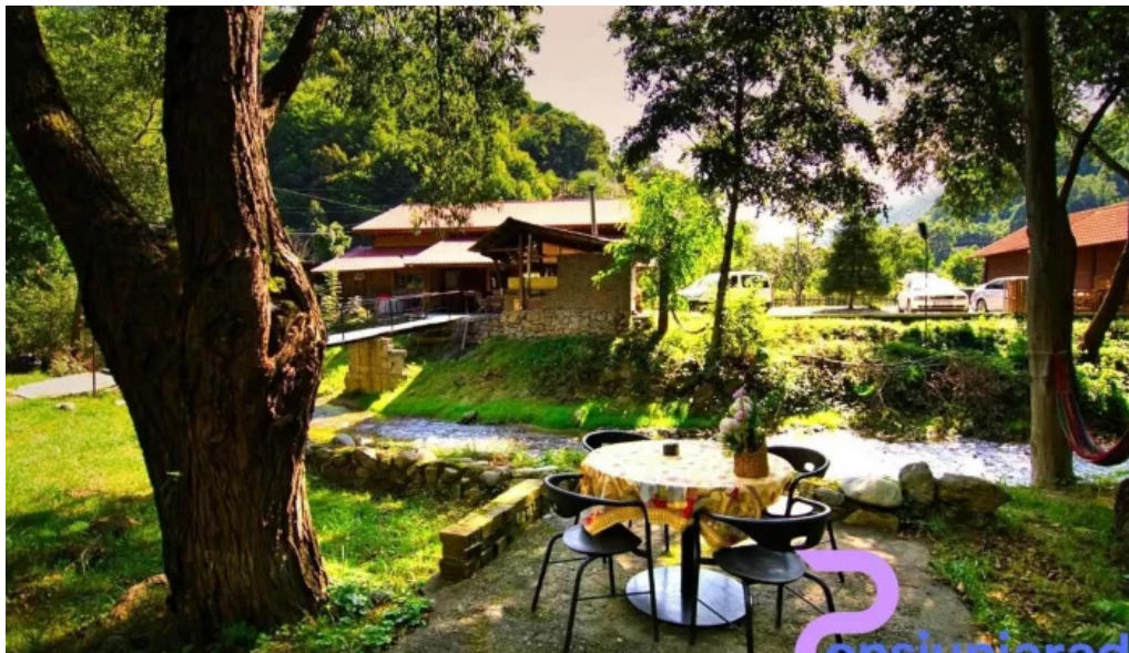
Complex turcana transalpina ?ugag