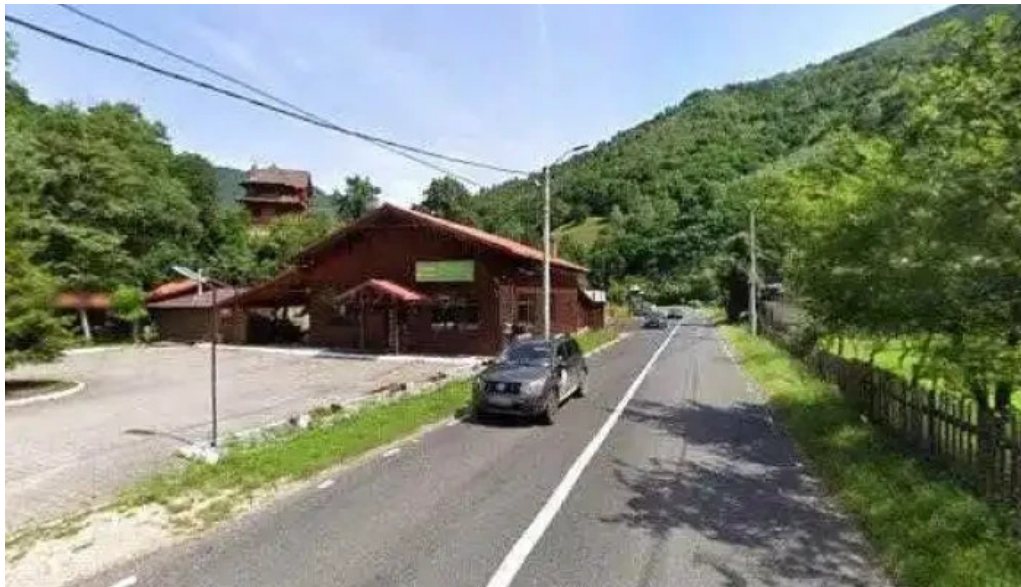
Complex turcana transalpina street view si 360deg