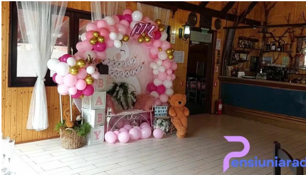
Complex turcana transalpina de la proprietar