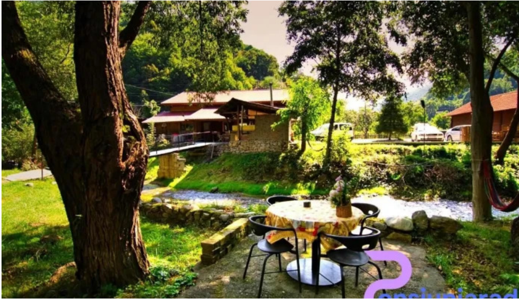
Complex turcana transalpina site web