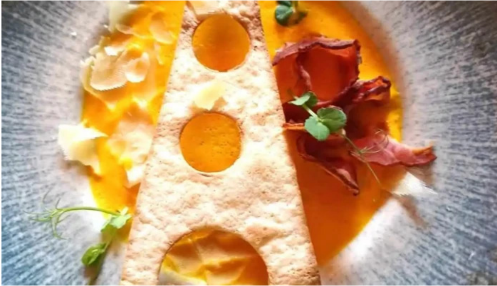
Complex turcana transalpina mancaruribauturi