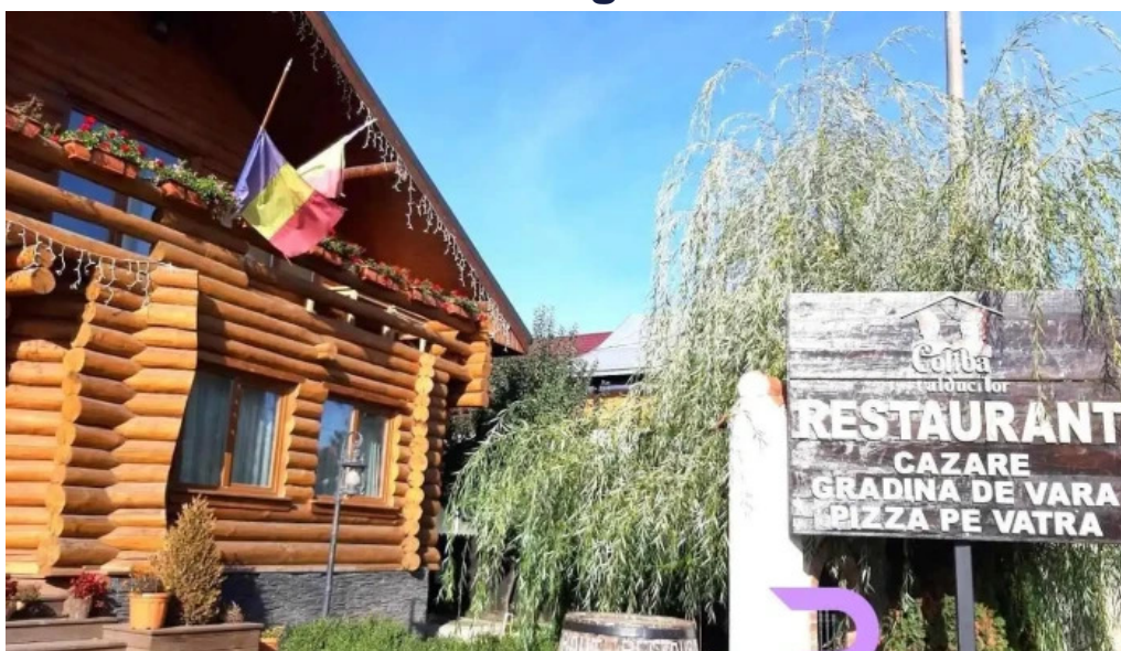
Domeniul haiducilor bucovina cheia