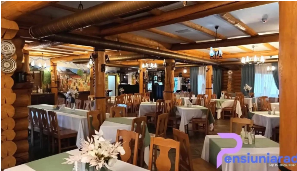
Domeniul haiducilor bucovina atmosfera