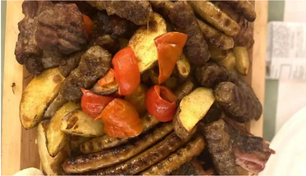
Domeniul haiducilor bucovina cele mai recente