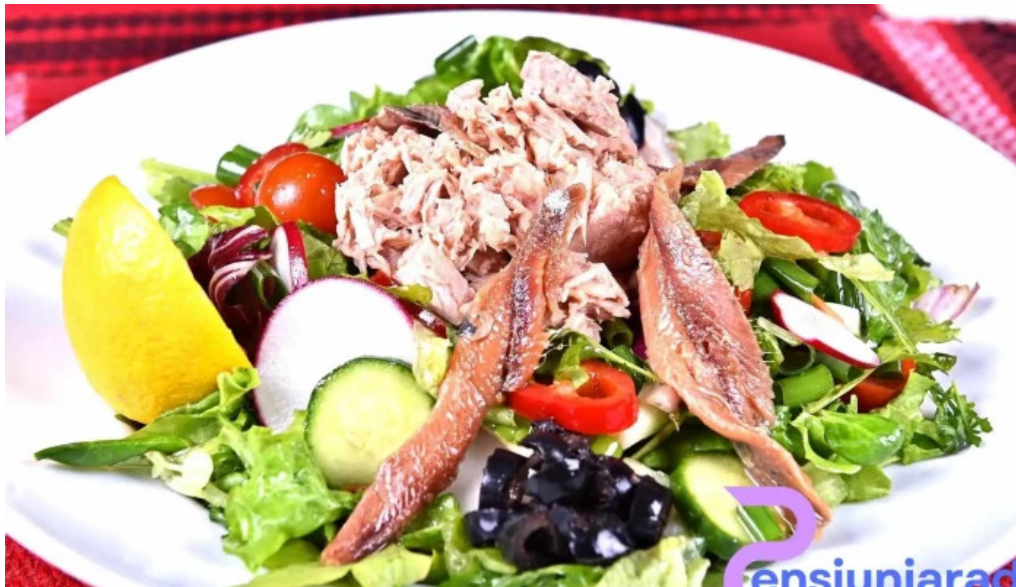
Domeniul haiducilor bucovina mancaruribauturi