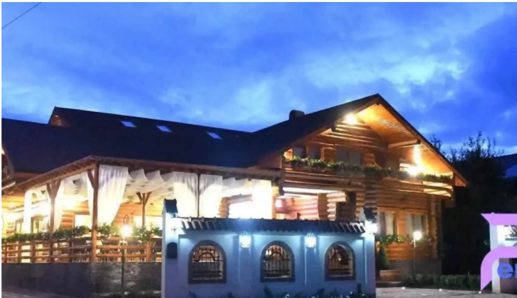
Domeniul haiducilor bucovina de la proprietar