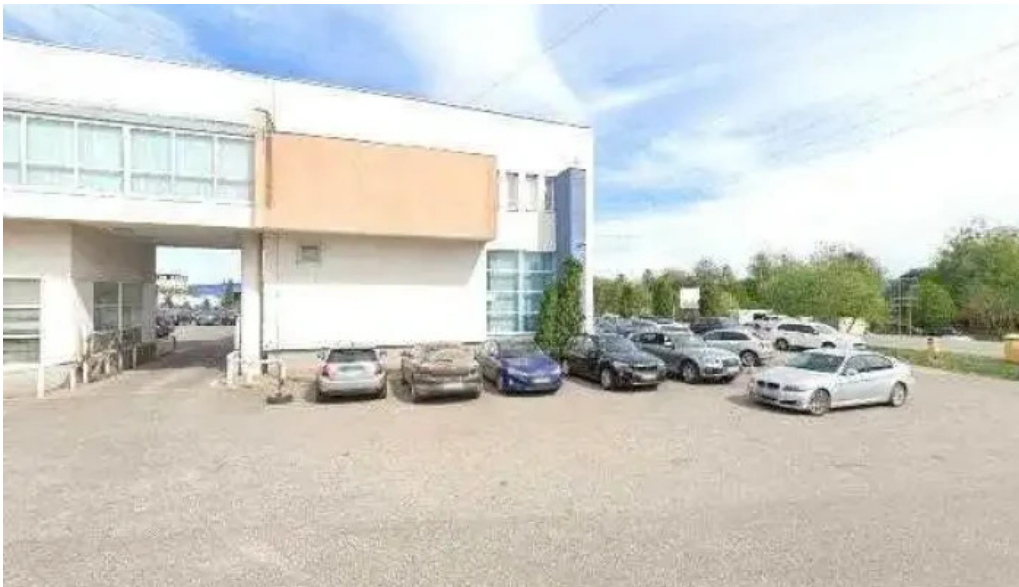
Domeniul haiducilor bucovina street view si 360deg