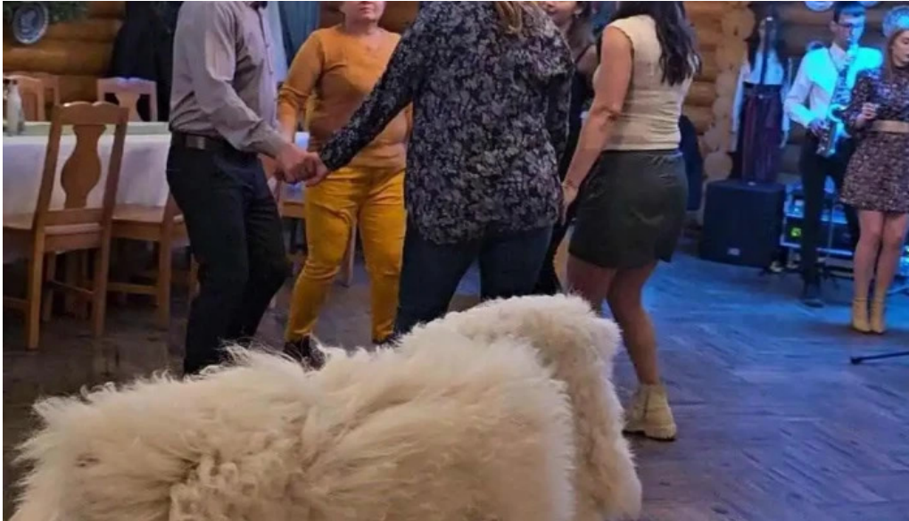
Domeniul haiducilor bucovina videoclipuri