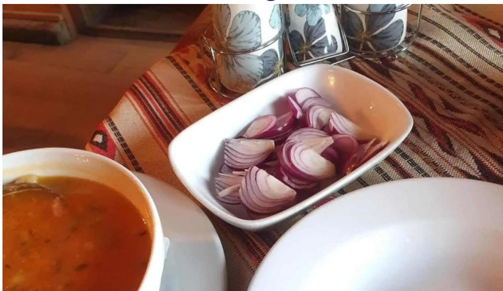
Leu de aur zlatna