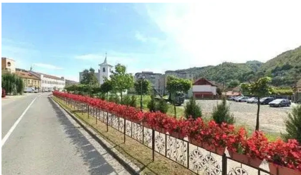
Leu de aur street view si 360deg