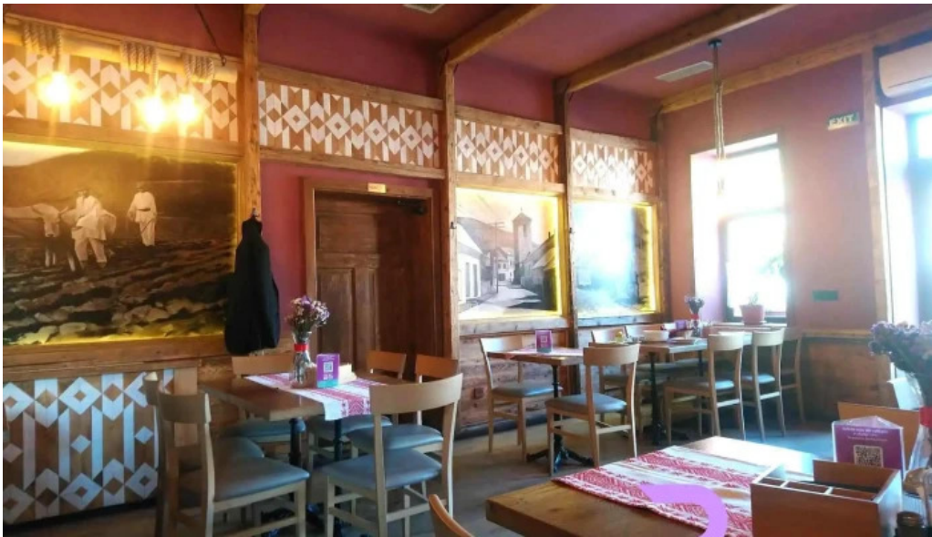
Leu de aur atmosfera