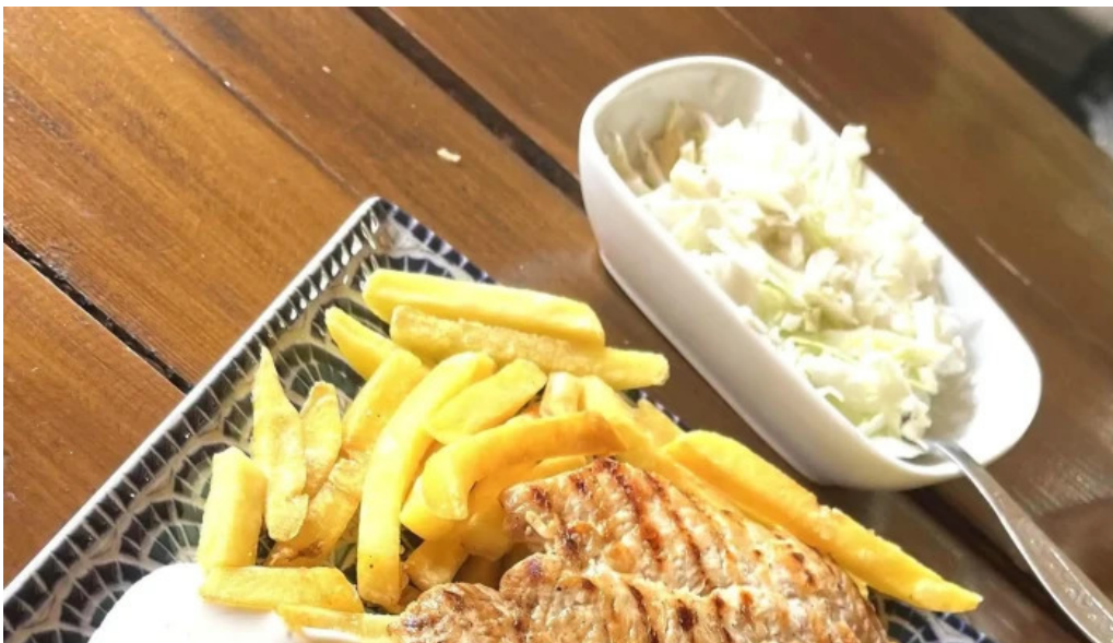
Leu de aur comentarii