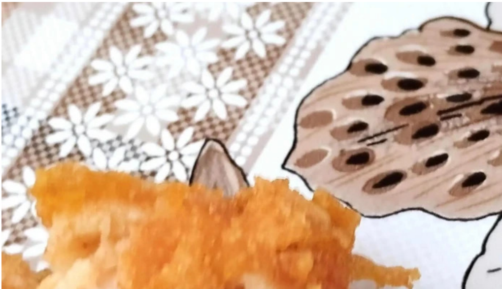
Leu de aur instagram