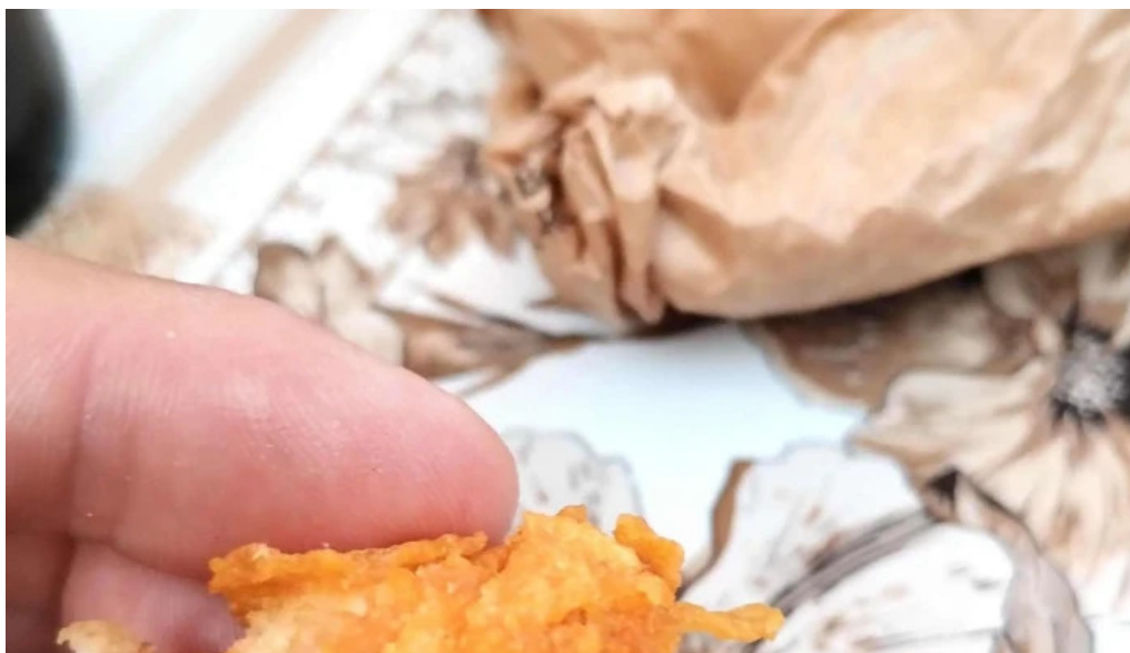
Leu de aur scor