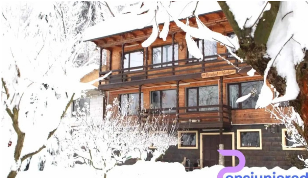
Paradisul verde de la proprietar