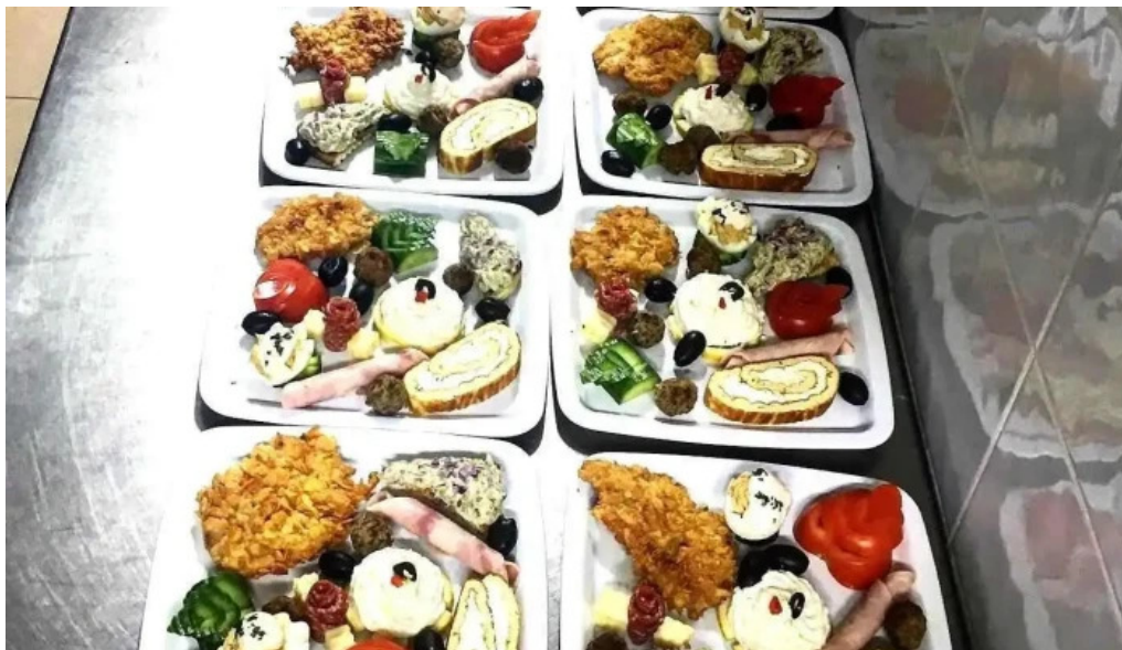
Paradisul verde mancaruribauturi