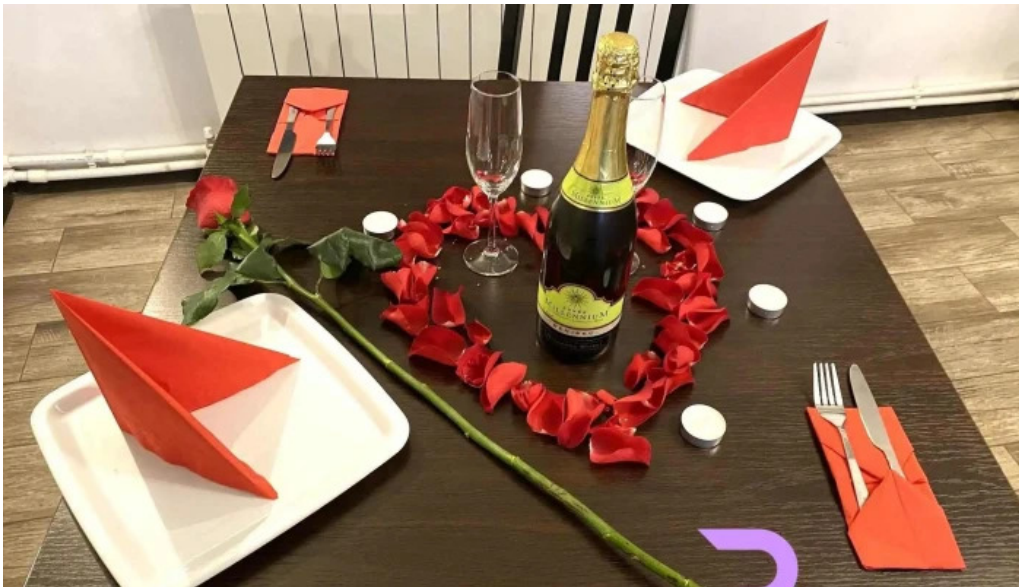
Paradisul verde instagram