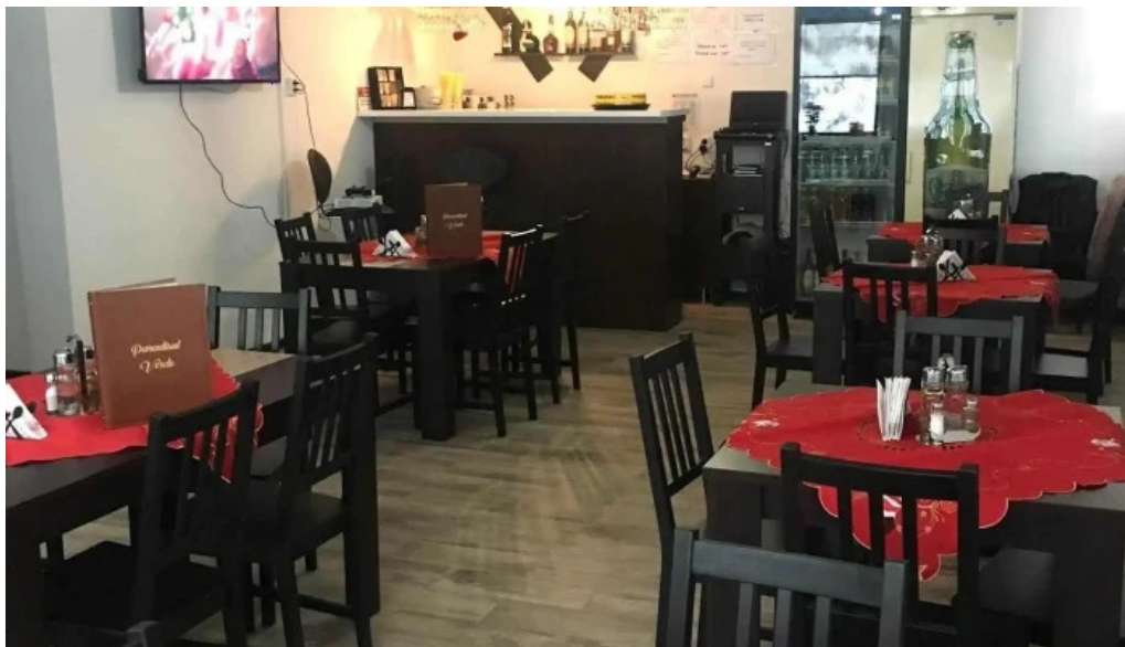
Paradisul verde atmosfera