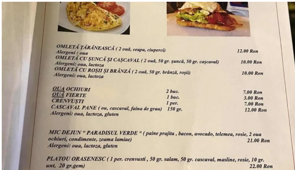
Paradisul verde meniu