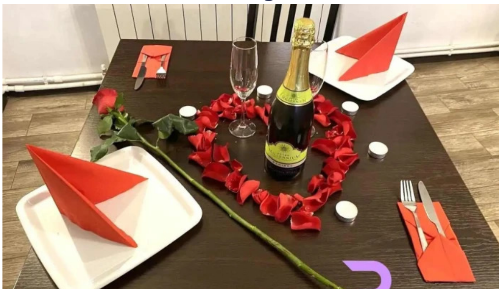
Paradisul verde vulcan