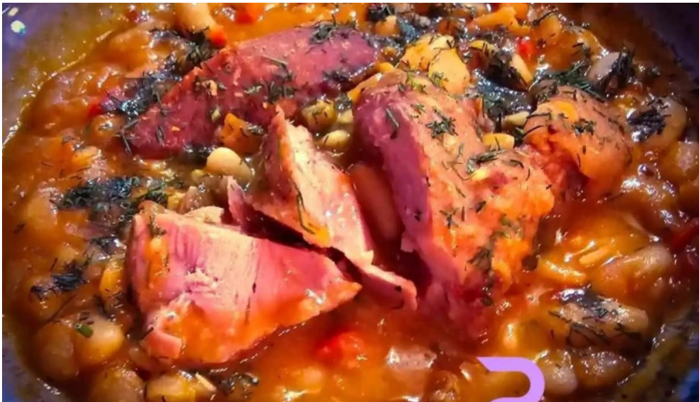
La taverna valea doftanei mancaruribauturi