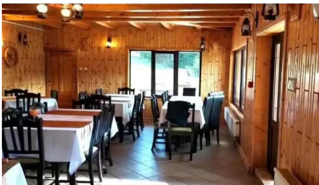
La taverna valea doftanei tr?isteni