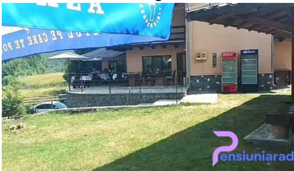
La taverna valea doftanei videoclipuri