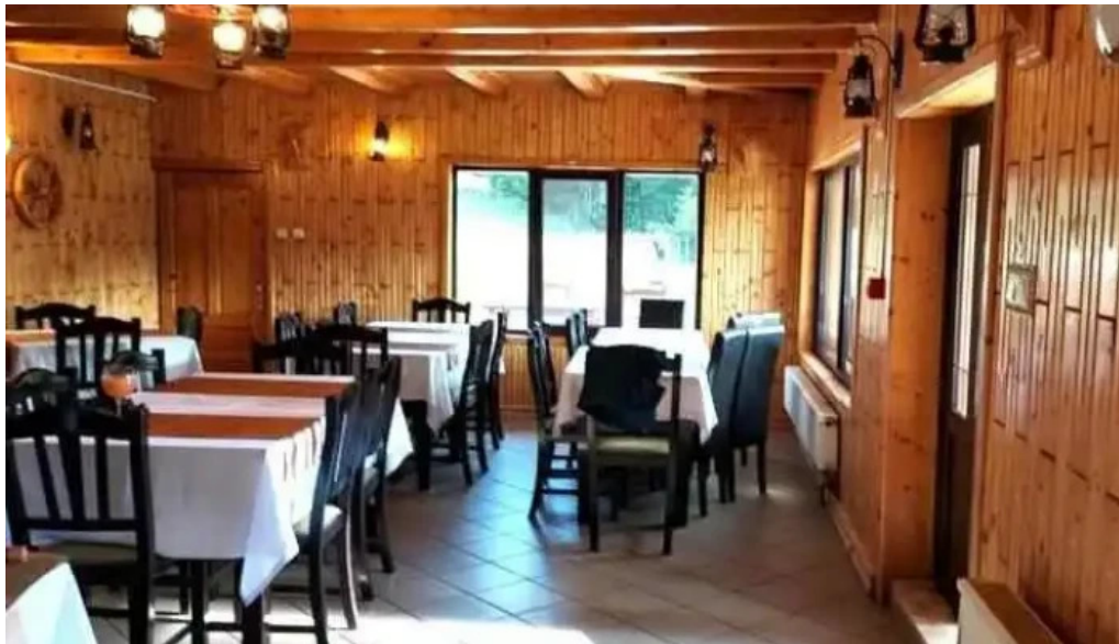
La taverna valea doftanei scor