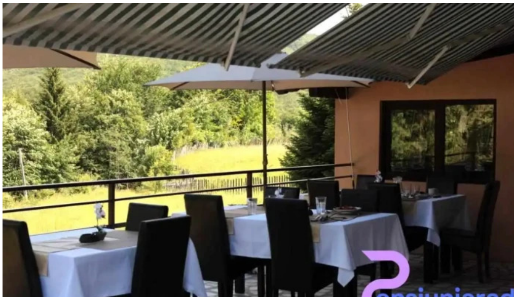
La taverna valea doftanei atmosfera