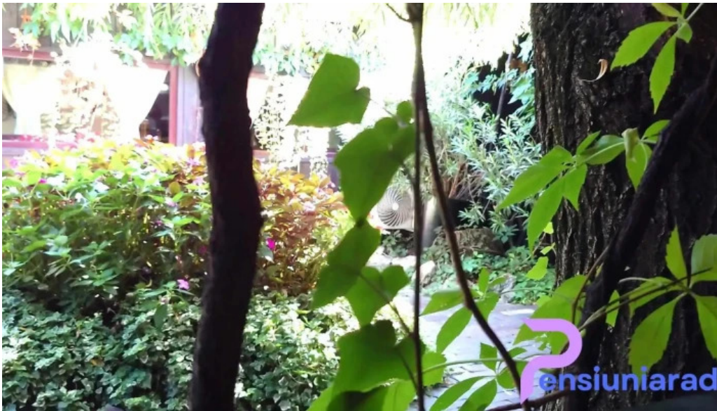
Hanul domnesc videoclipuri