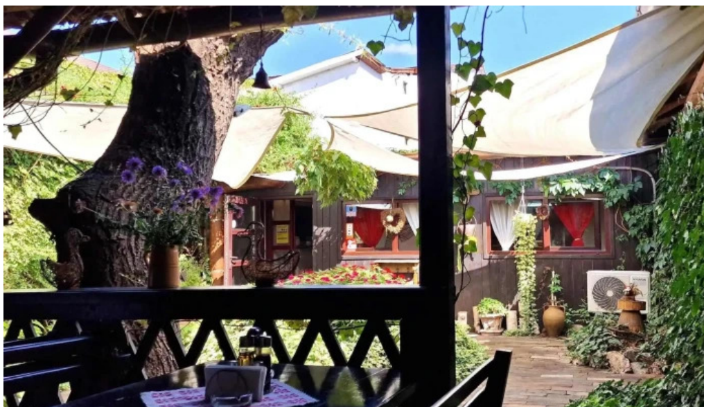
Hanul domnesc reduceri