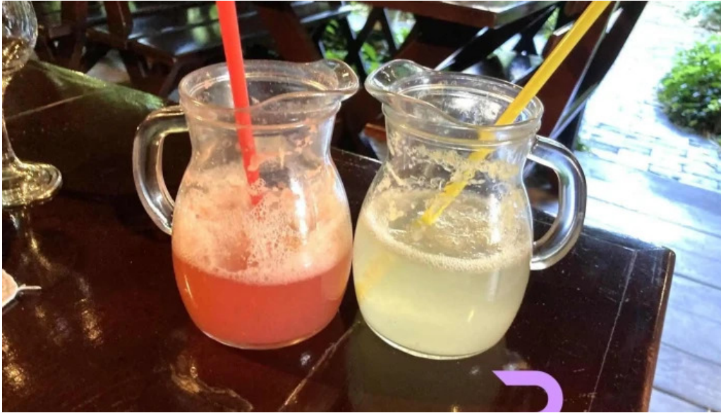
Hanul domnesc suc