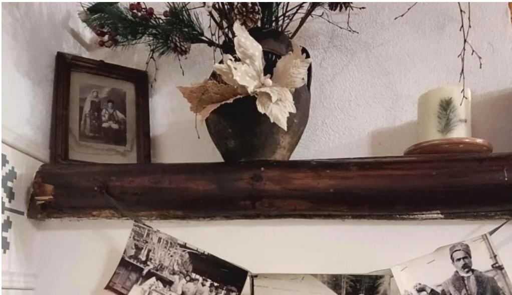
Hanul domnesc deschis acum