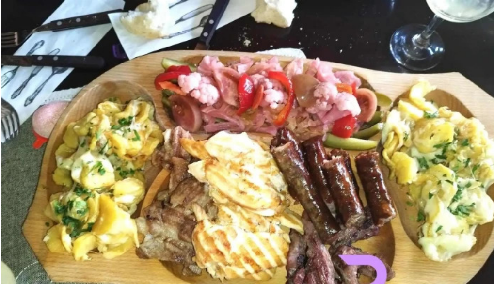
Hanul domnesc mancaruribauturi