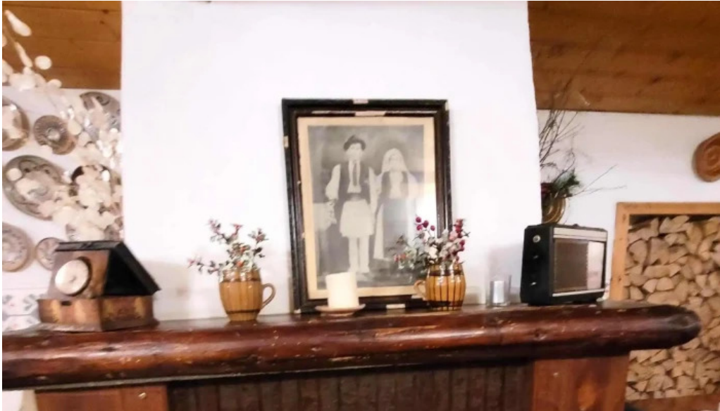
Hanul domnesc fotografii