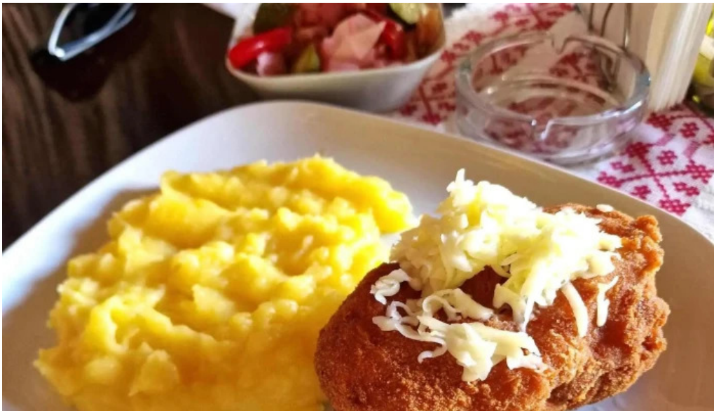
Hanul domnesc comentarii