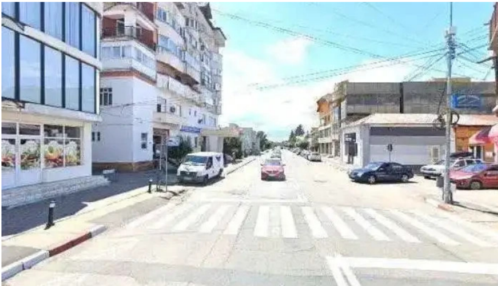
Hanul domnesc street view si 360deg