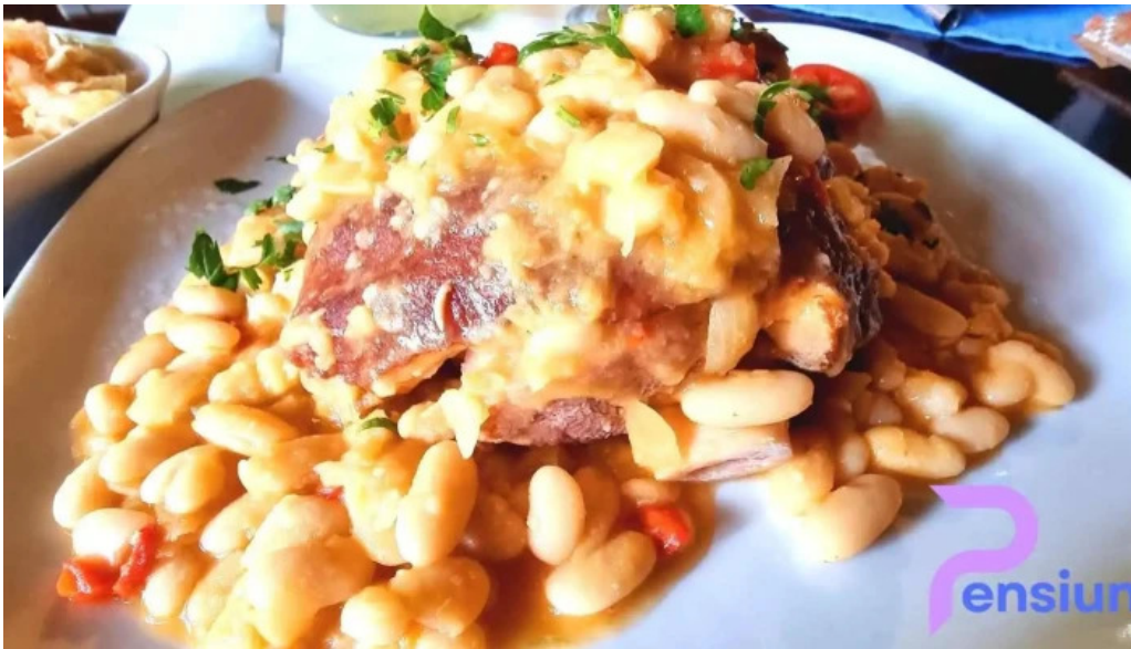
Hanul domnesc cassoulet