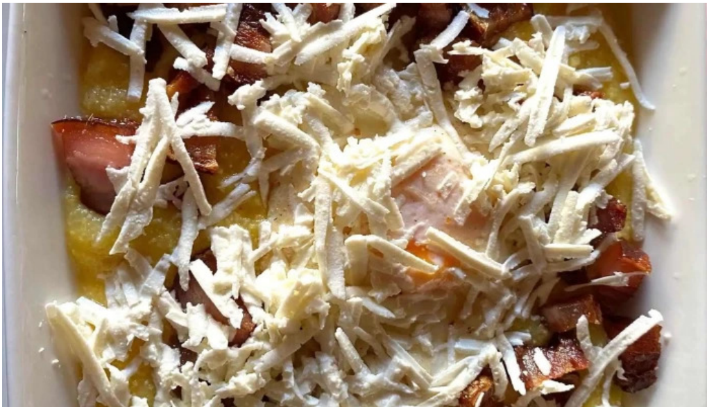
Hanul domnesc targu jiu