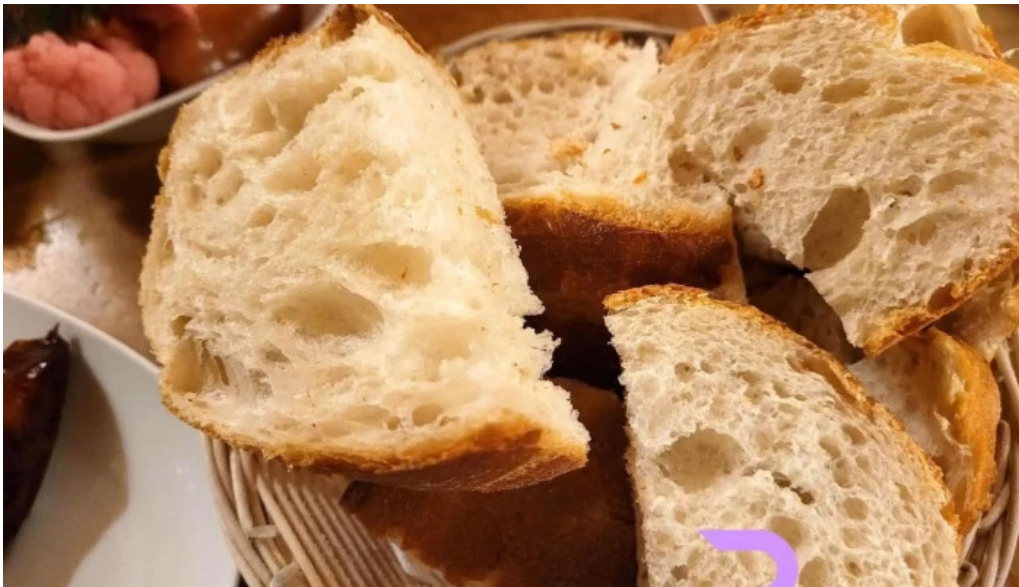
Hanul domnesc cele mai recente