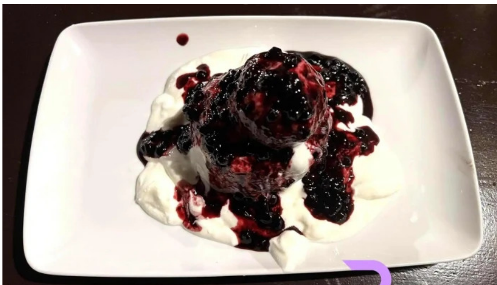
Hanul domnesc afina