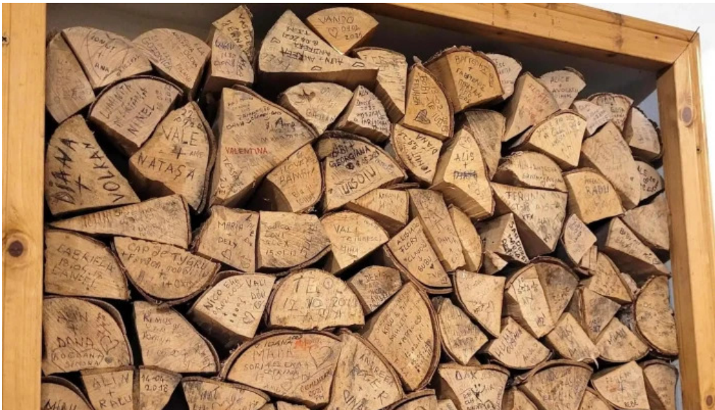
Hanul domnesc telefon