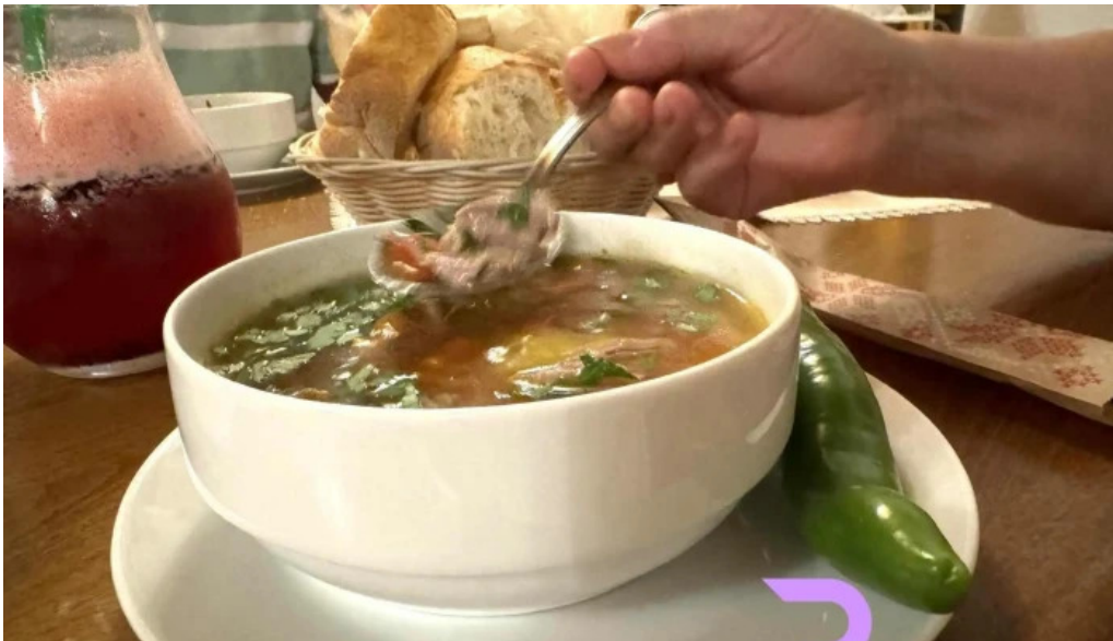
Hanul domnesc supa de pui