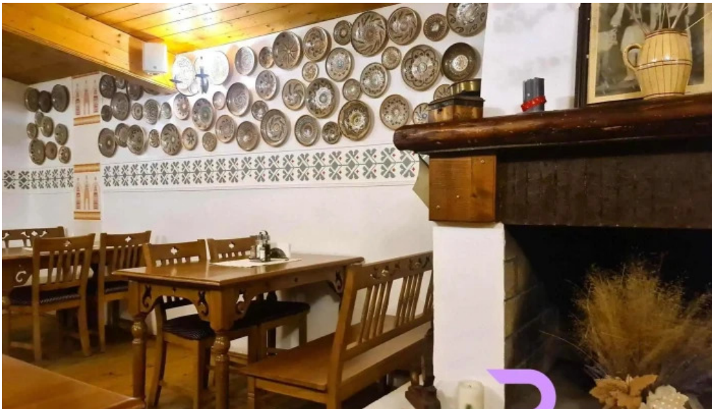
Hanul domnesc atmosfera