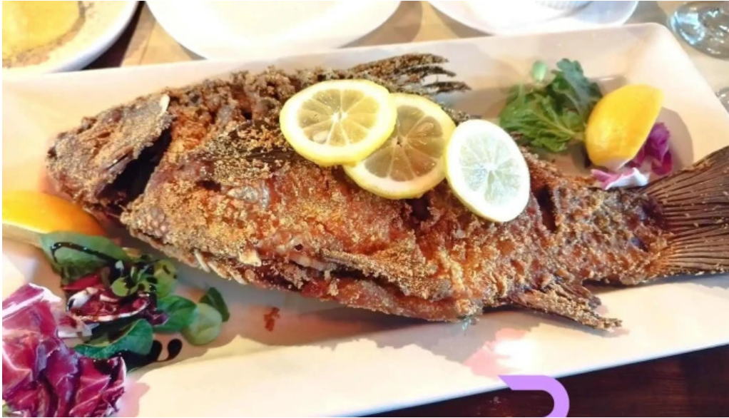
Cherhana la parfene biban de mare