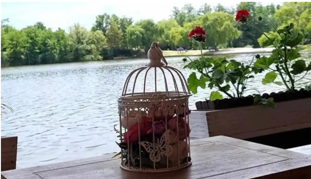
Cherhana la parfene videoclipuri