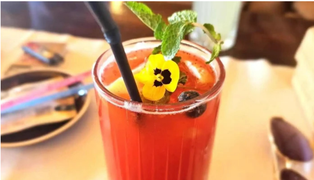
Cherhana la parfene suc