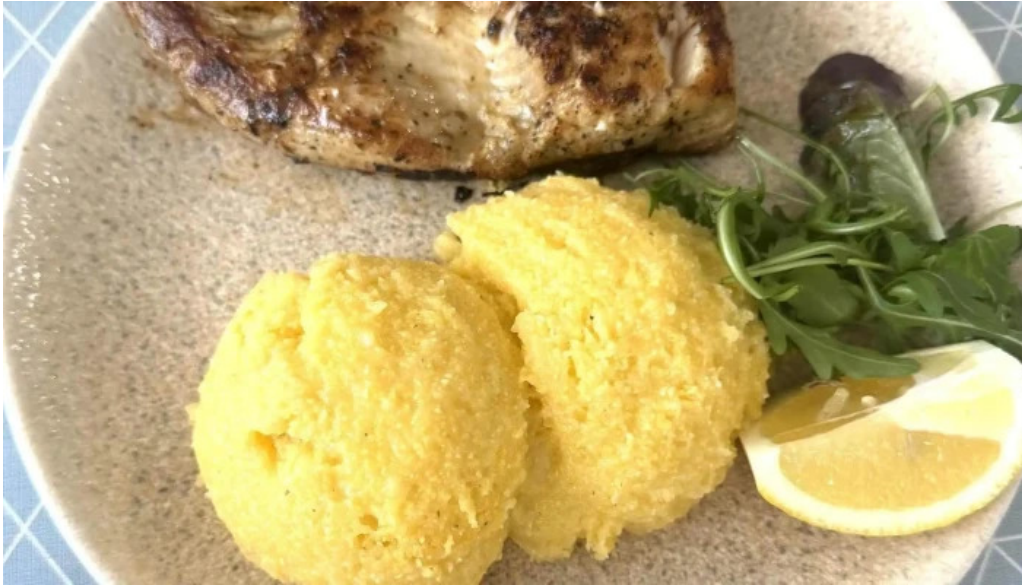
Cherhana la parfene polenta