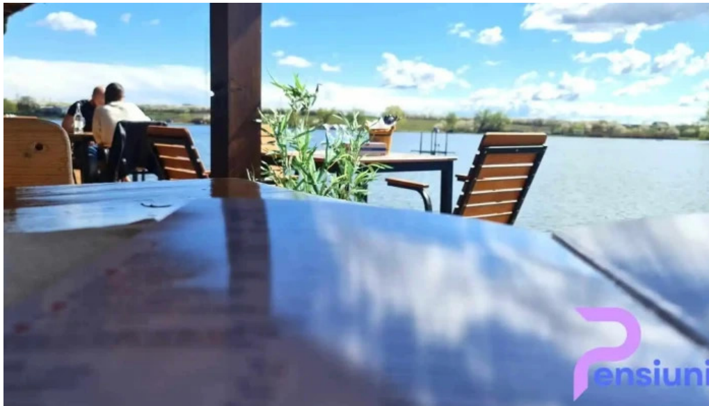
Cherhana la parfene de la proprietar