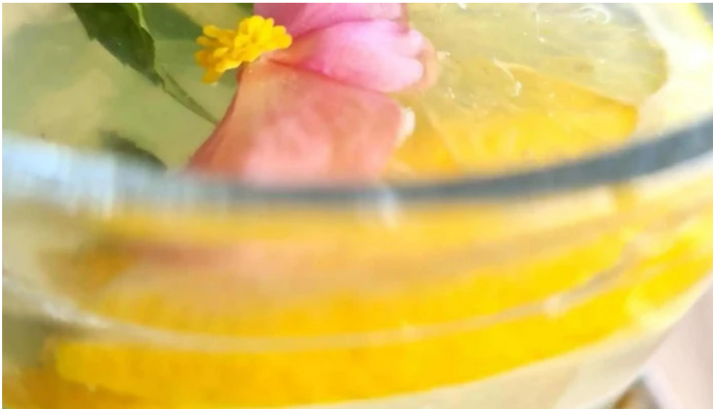
Cherhana la parfene mojito