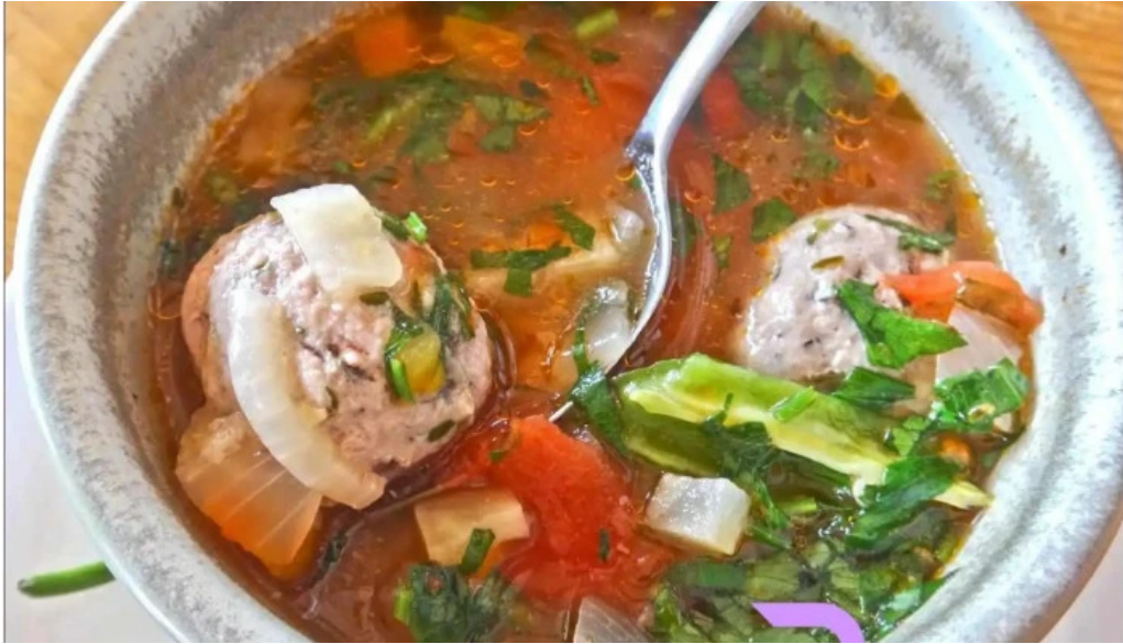
Cherhana la parfene supa