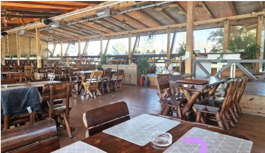
Cherhana la parfene atmosfera