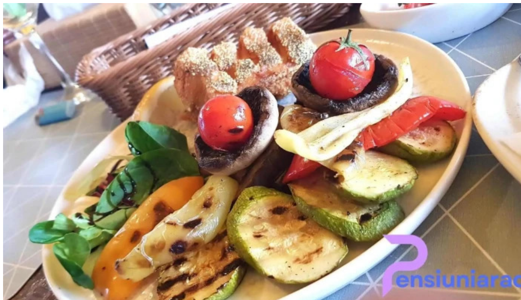
Cherhana la parfene mancaruribauturi