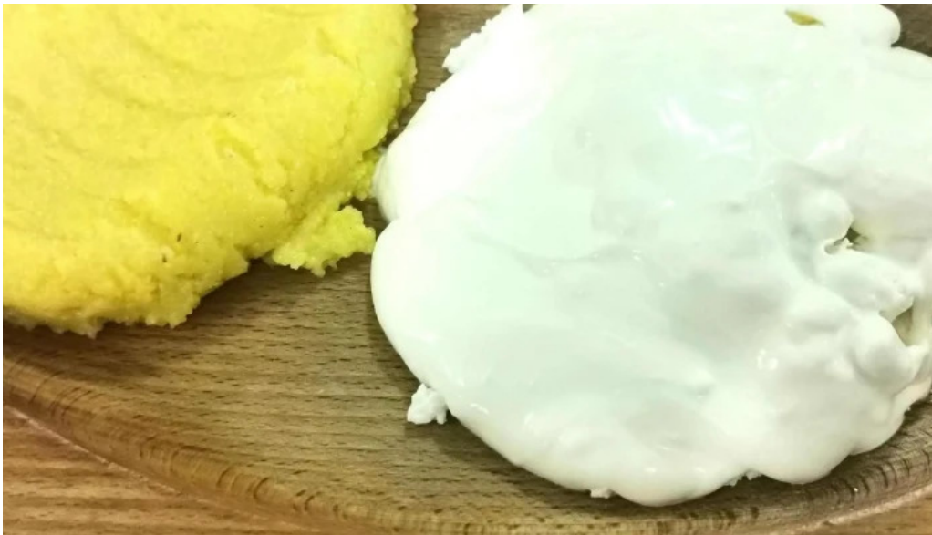
Hanul marioarei scor