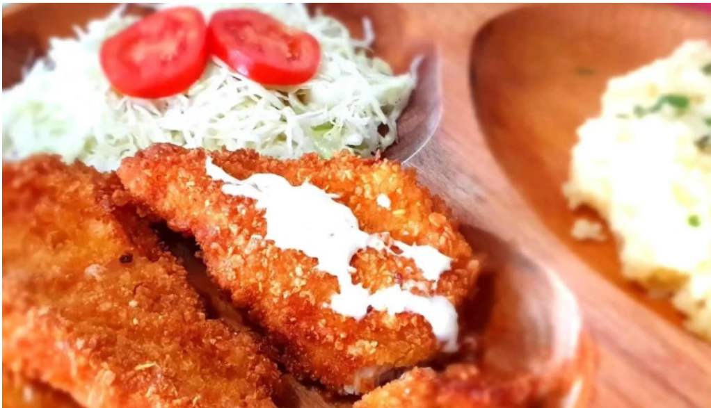
Hanul marioarei videoclipuri