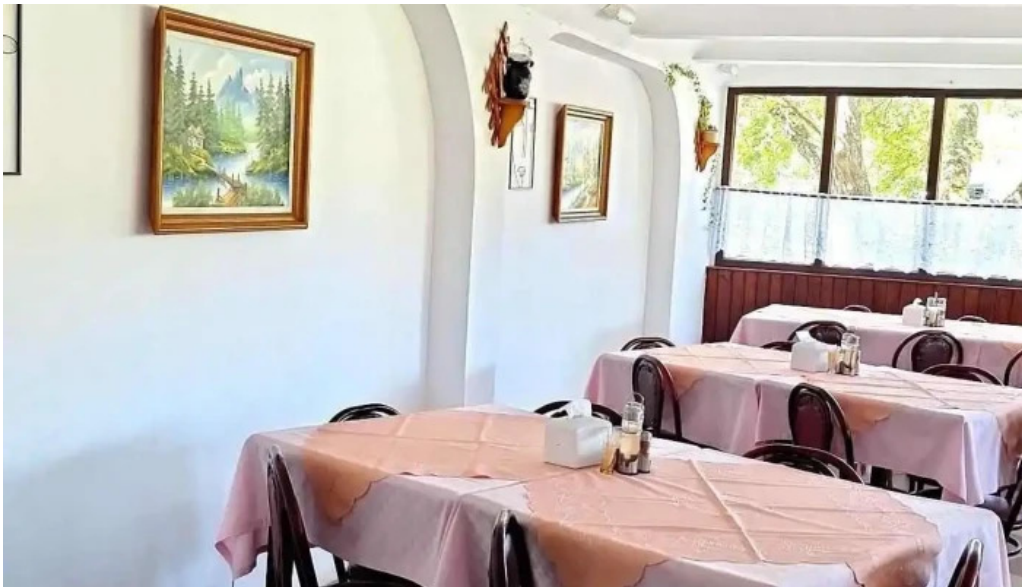
Hanul marioarei atmosfera