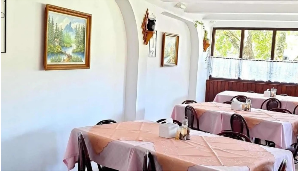
Hanul marioarei sucevi?a