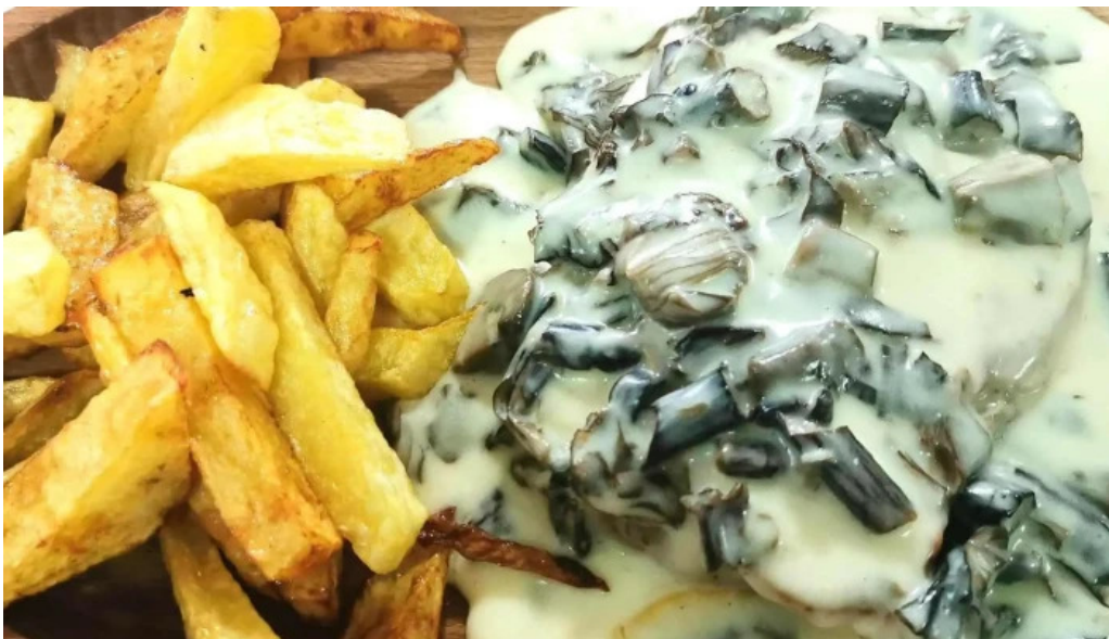
Hanul marioarei telefon