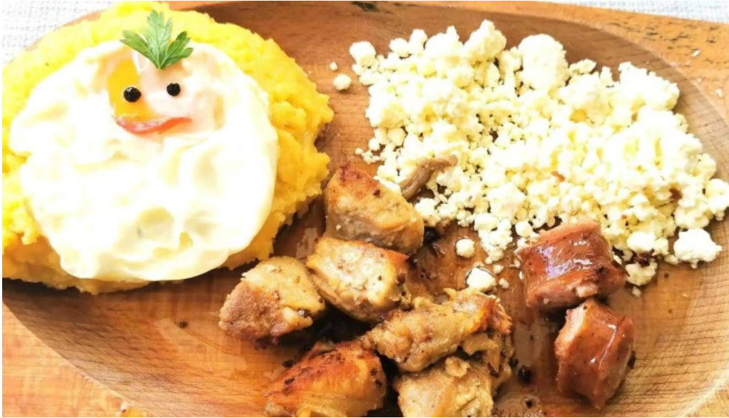
Hanul marioarei comentarii