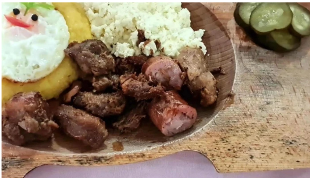
Hanul marioarei aproape de mine