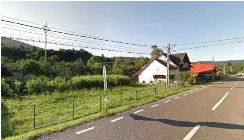
Hanul marioarei street view si 360deg