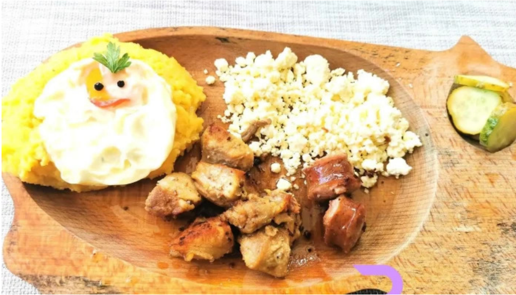
Hanul marioarei mancaruribauturi