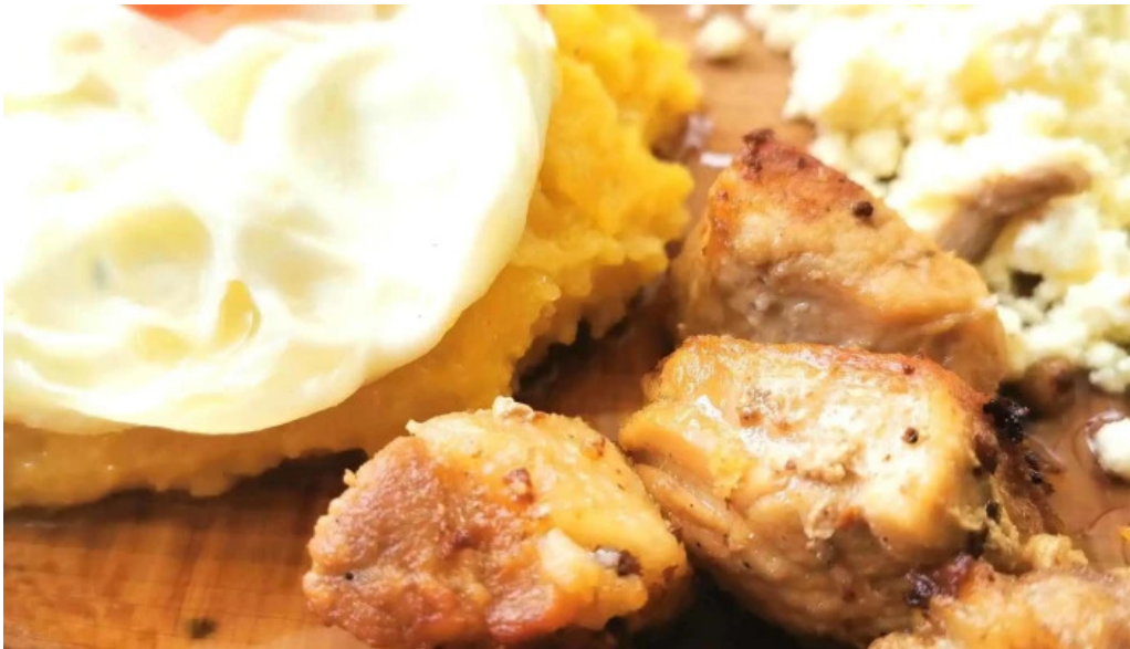
Hanul marioarei promo?ie