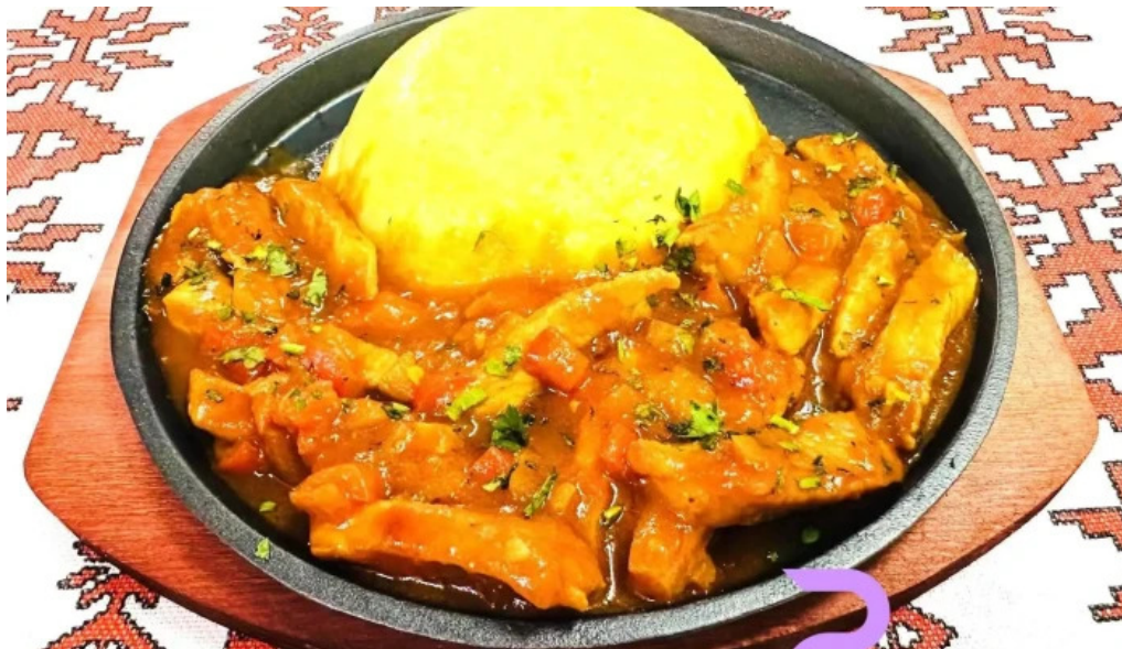
Hanul dacic mancaruribauturi