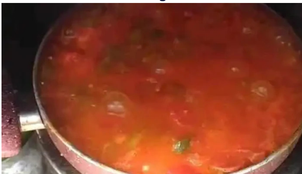
Hanul dacic videoclipuri