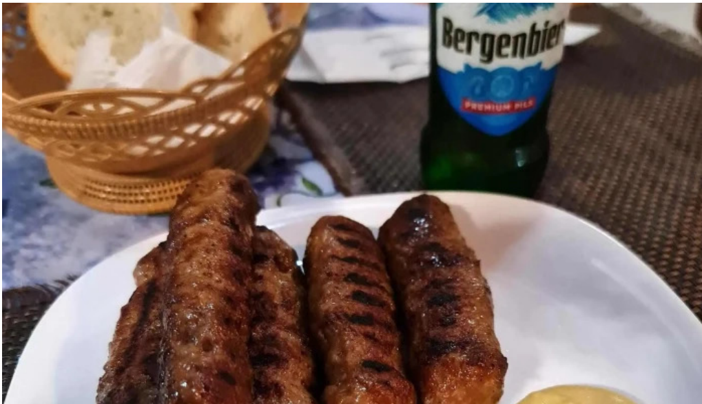
Hanul dacic deschis acum