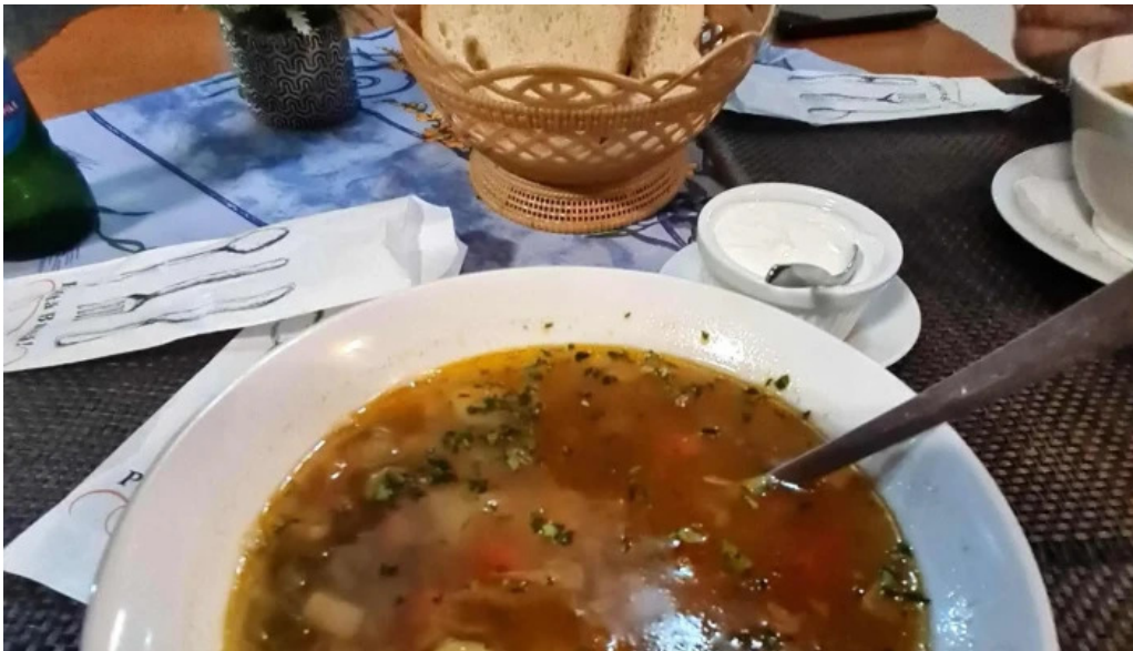
Hanul dacic simeria