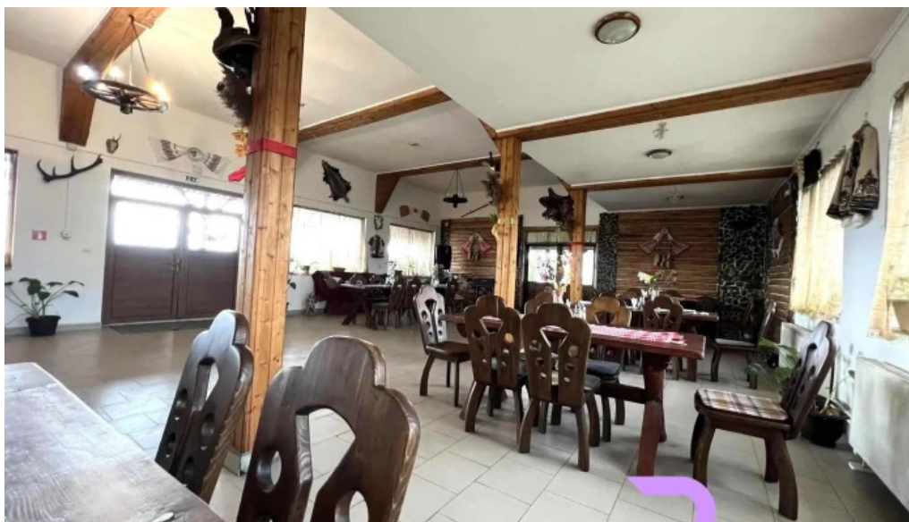
Hanul dacic atmosfera