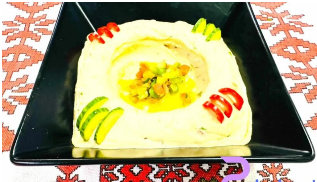
Hanul dacic cele mai recente