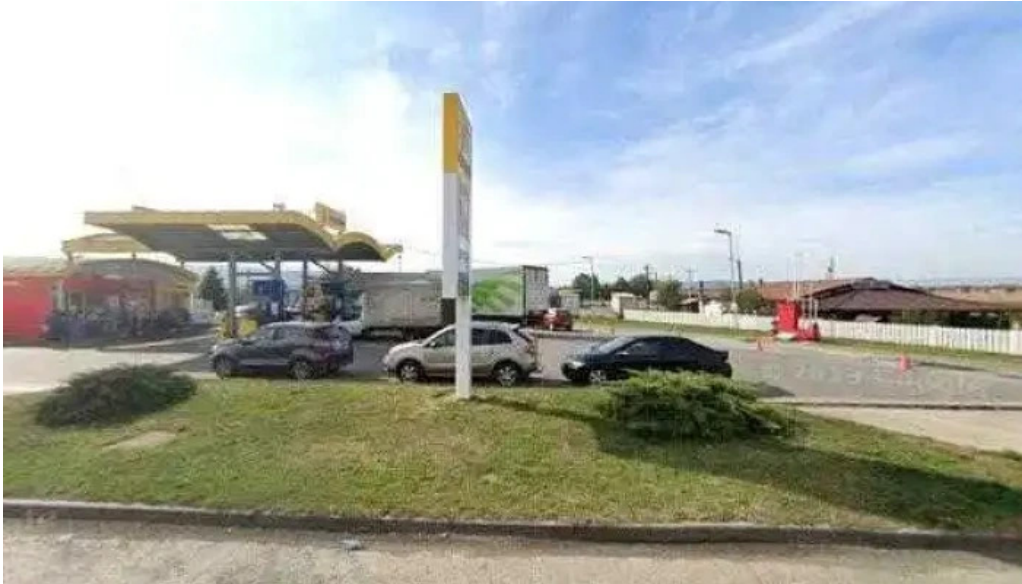
Hanul dacic street view si 360deg