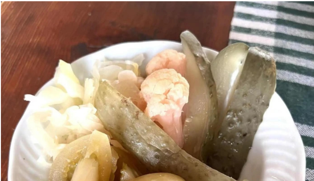
Hanul dacic unde