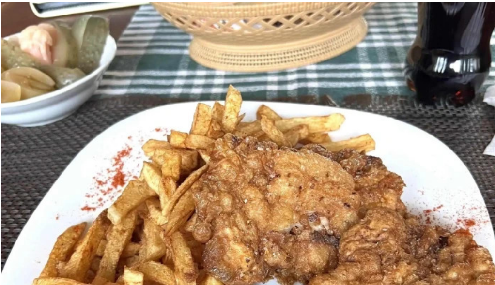
Hanul dacic reduceri