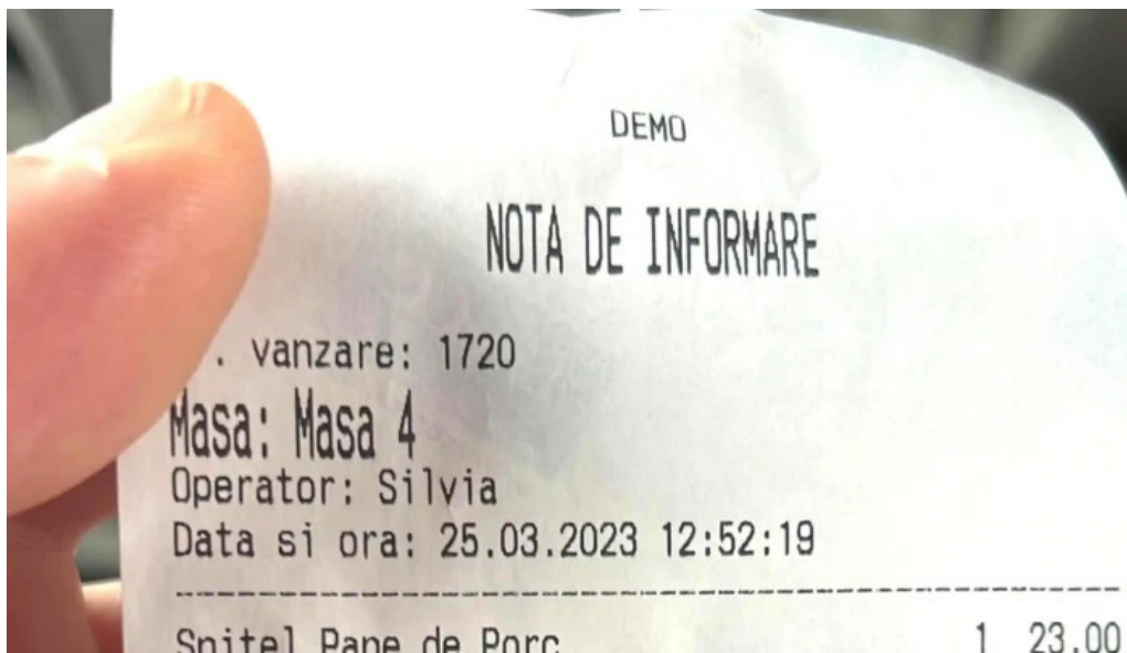
Hanul dacic program