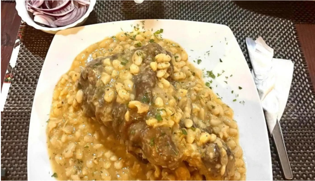
Hanul dacic rizoto