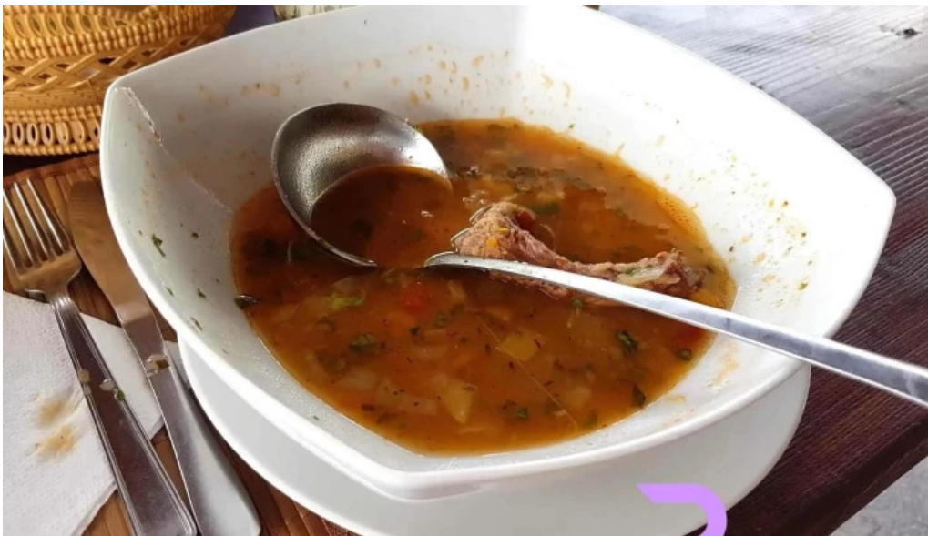
Hanul dacic supa de legume