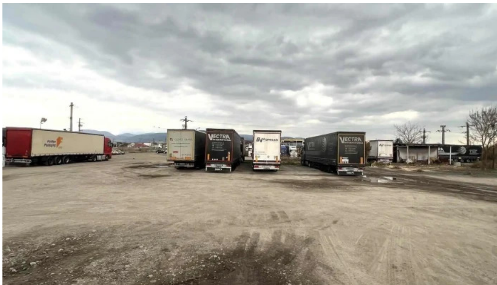
Hanul dacic pre?uri