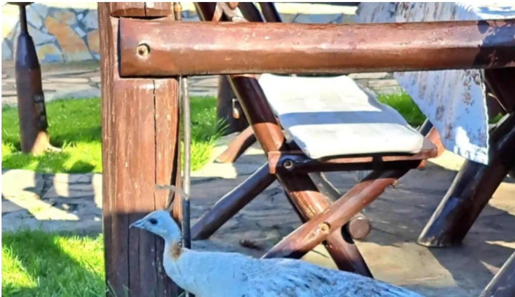
Pensiune han madaras fotografii