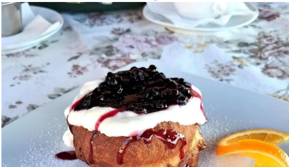
Pensiune han madaras videoclipuri