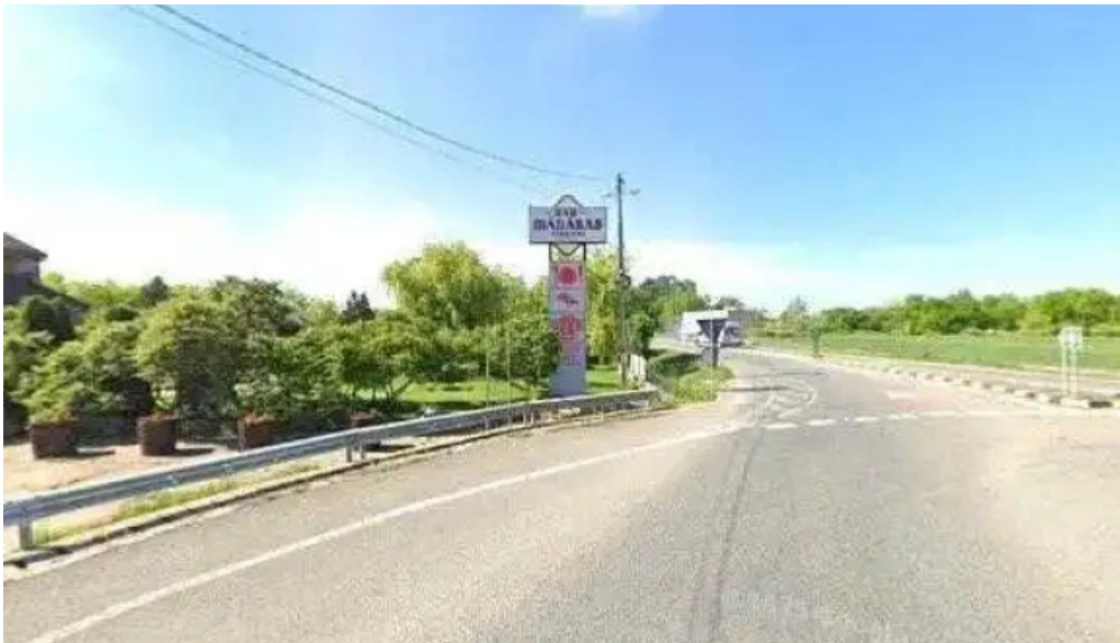
Pensiune han madaras street view si 360deg