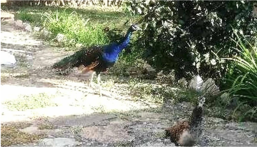
Pensiune han madaras pre?uri