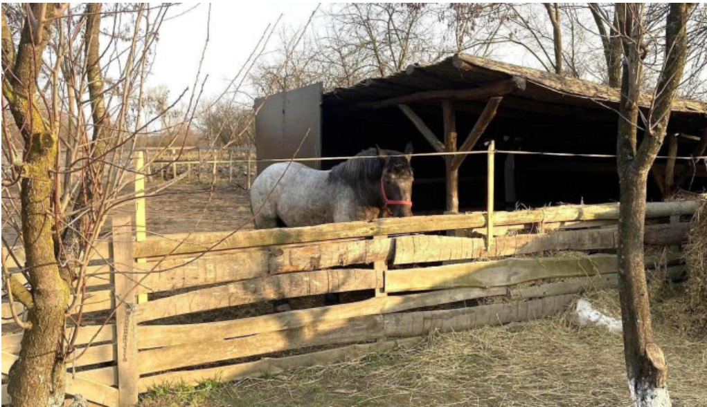
Pensiune han madaras cele mai recente