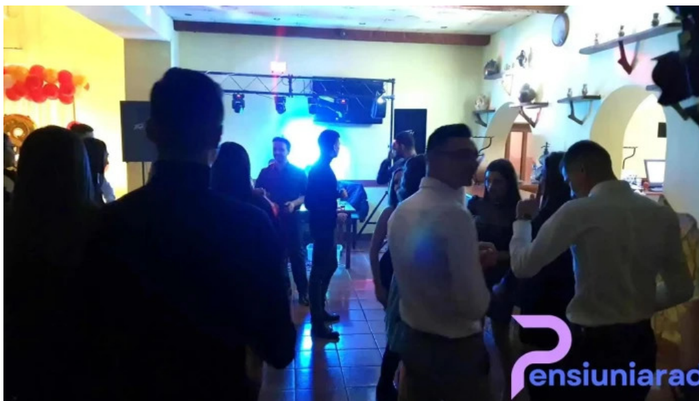
Pensiune han madaras atmosfera