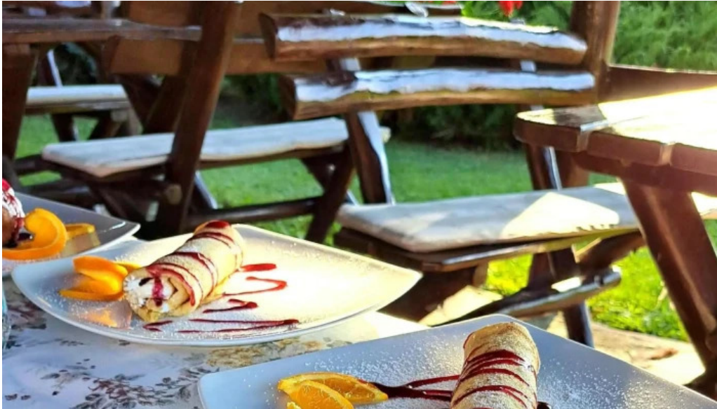
Pensiune han madaras salonta