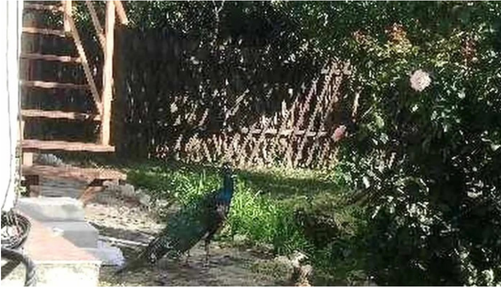
Pensiune han madaras deschis acum