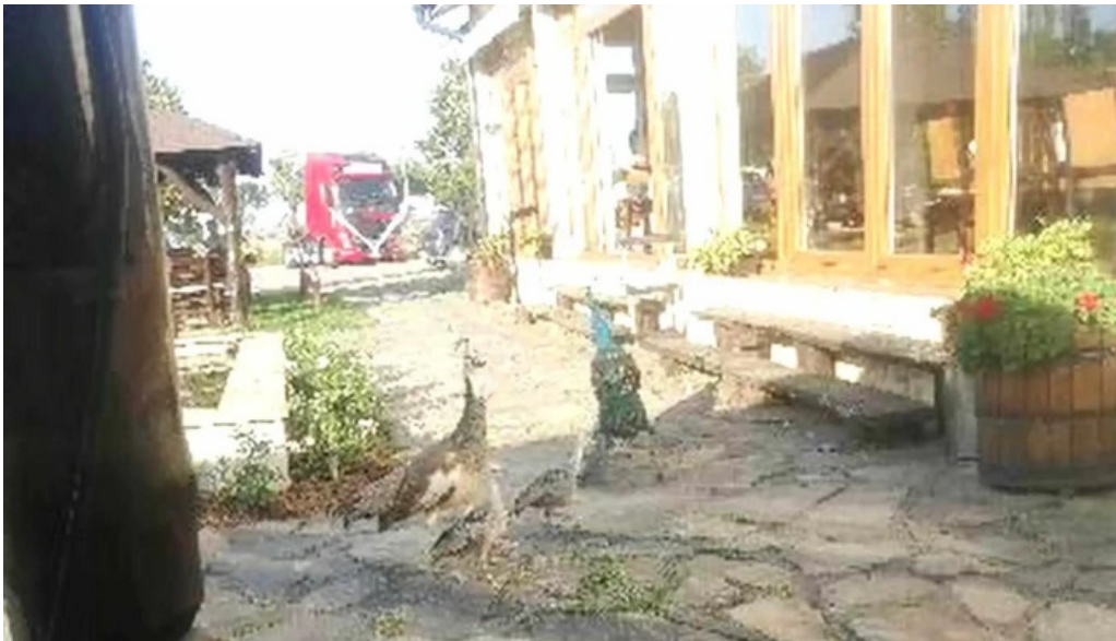
Pensiune han madaras reduceri