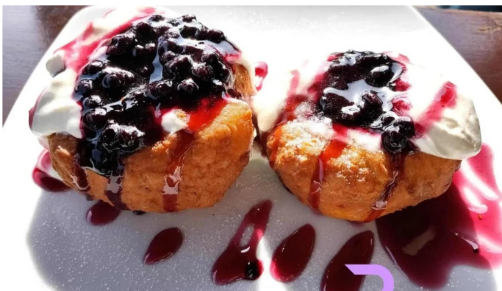
Pensiune han madaras afina