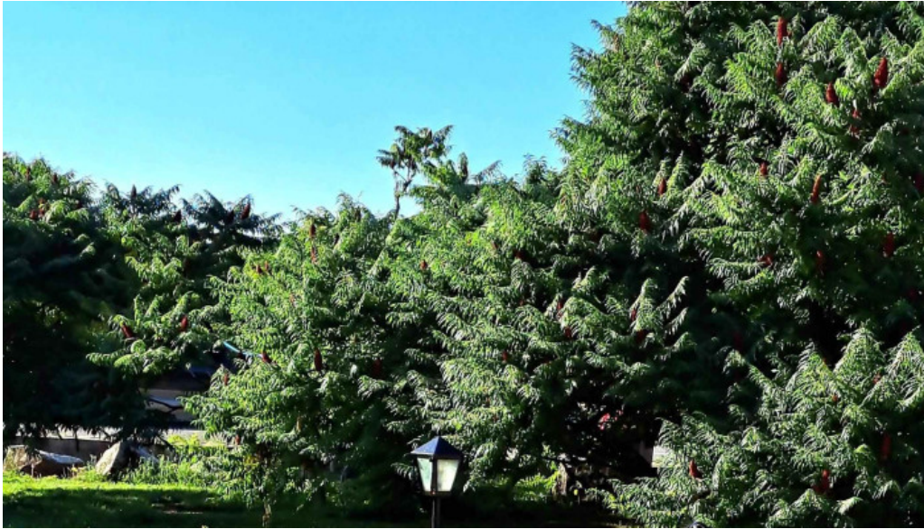
Pensiune han madaras unde