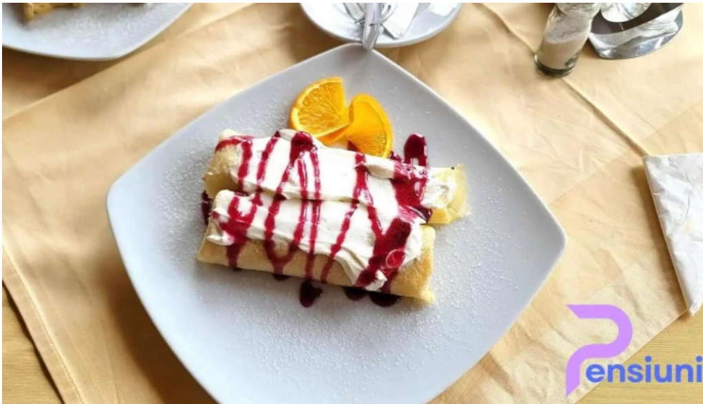
Pensiune han madaras mancaruribauturi