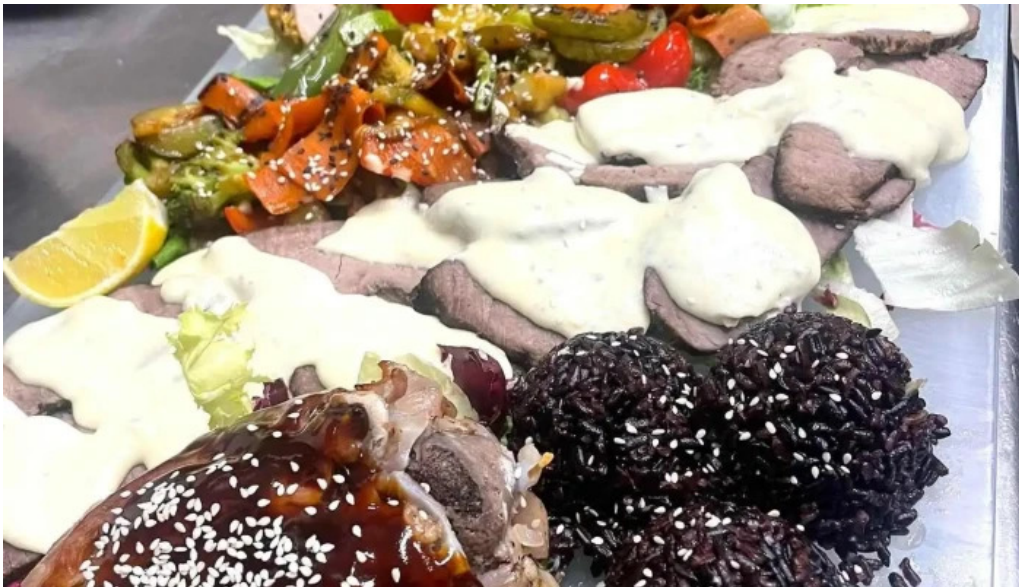
Doi voievozi mancaruribauturi