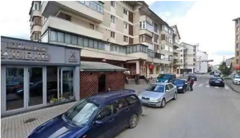
Doi voievozi street view si 360deg