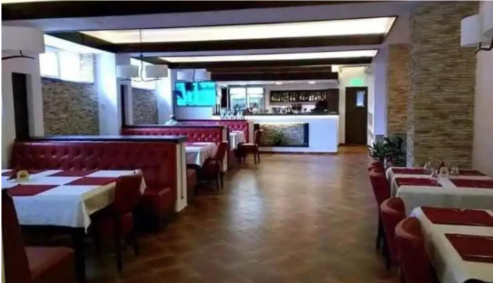
Doi voievozi atmosfera