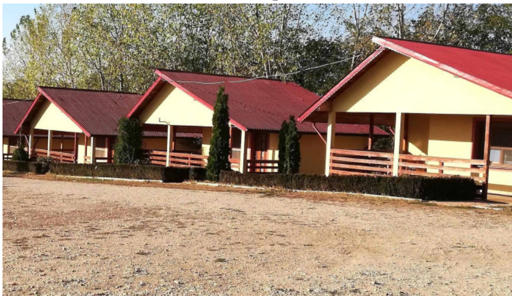
Hanul domnesc videoclipuri