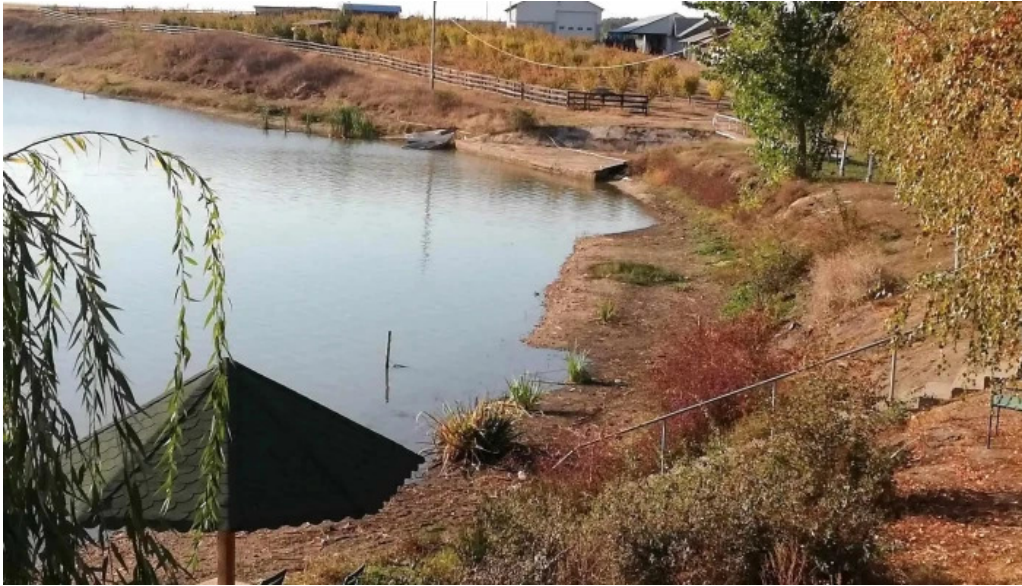
Hanul domnesc loca?ie