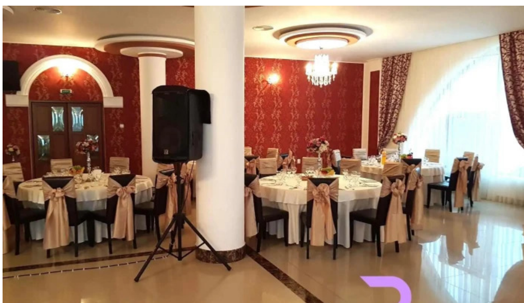
Hanul domnesc atmosfera