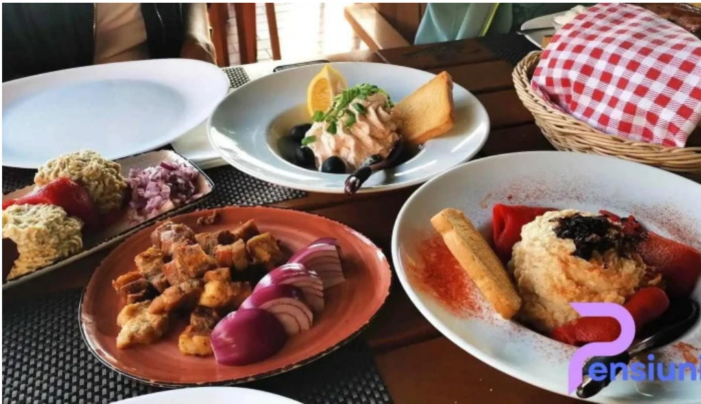
Hanul domnesc mancaruribauturi