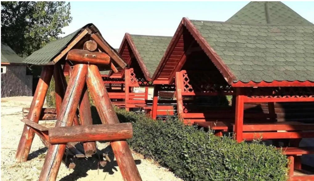
Hanul domnesc pre?uri