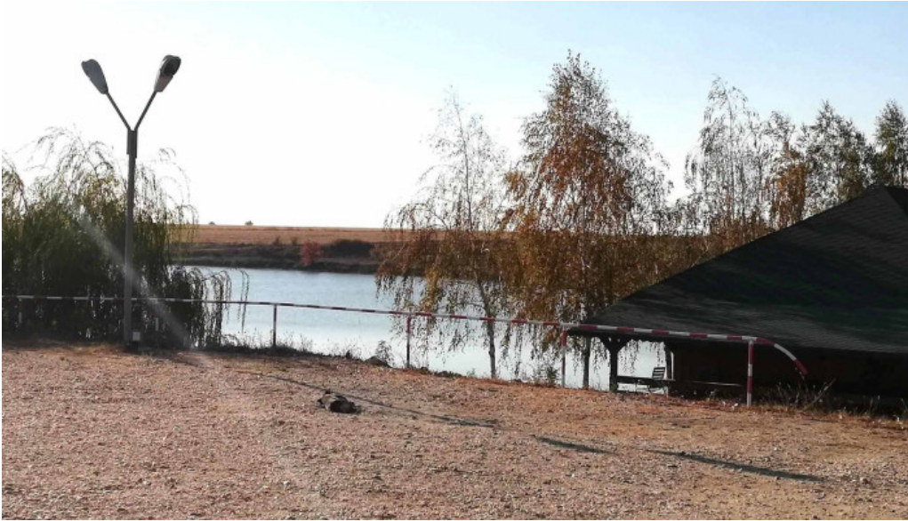
Hanul domnesc site web