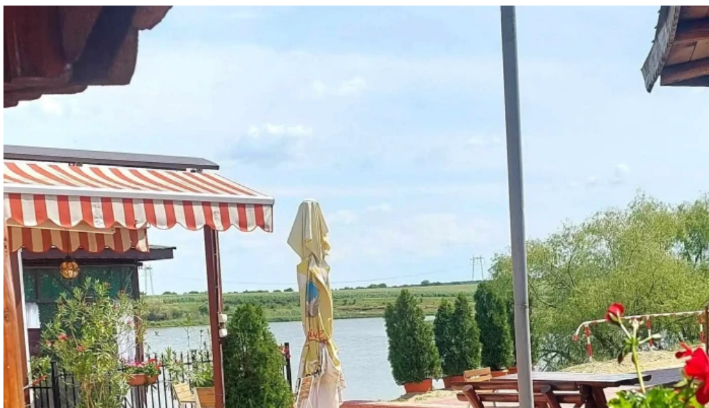
Hanul domnesc comentarii