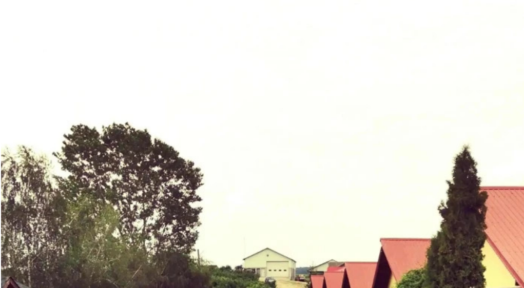
Hanul domnesc romania