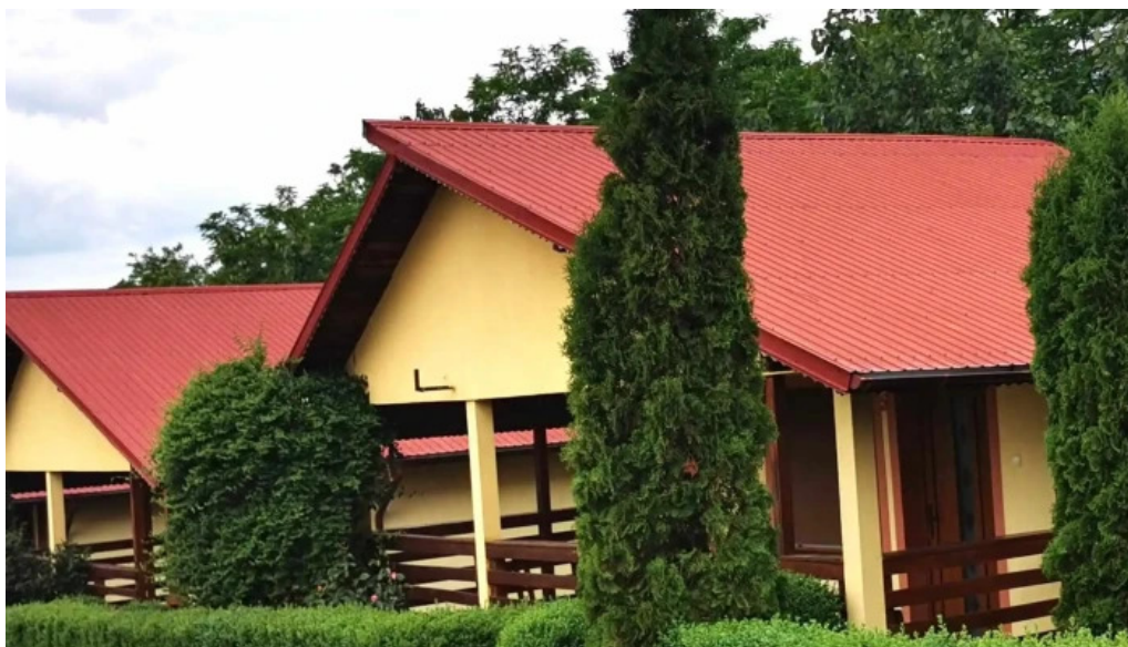
Hanul domnesc unde