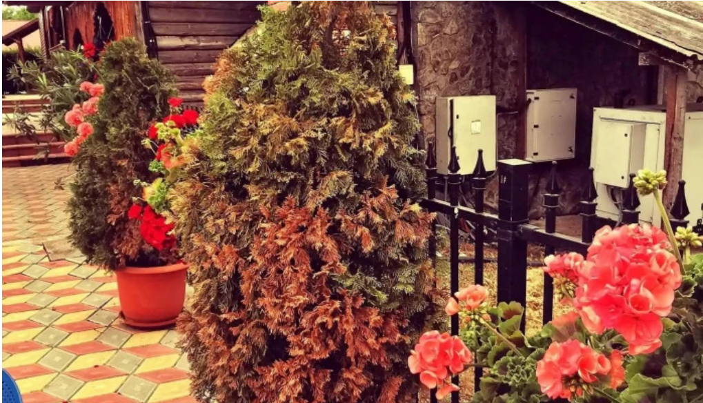
Hanul domnesc recenzii