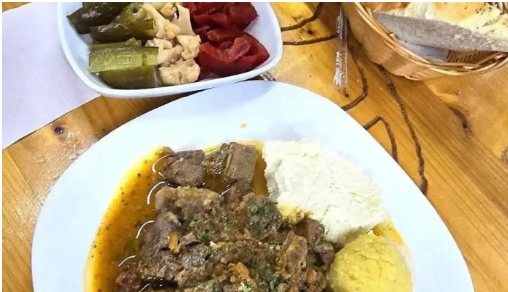
Hanul vanatorului polenta