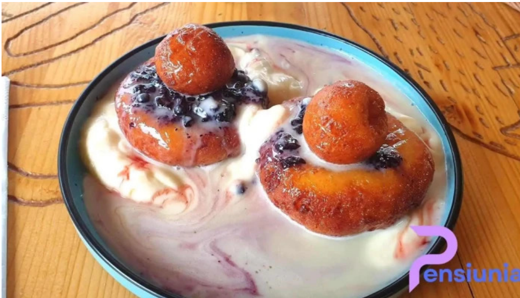
Hanul vanatorului mancaruribauturi