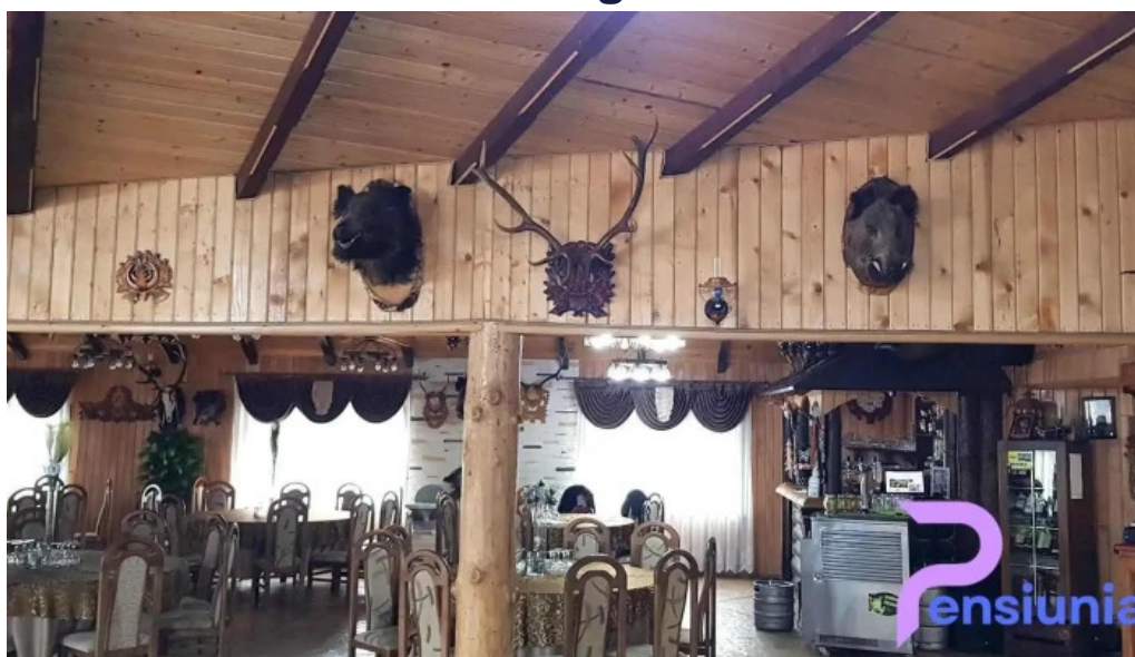
Hanul van?torului p?ltinoasa