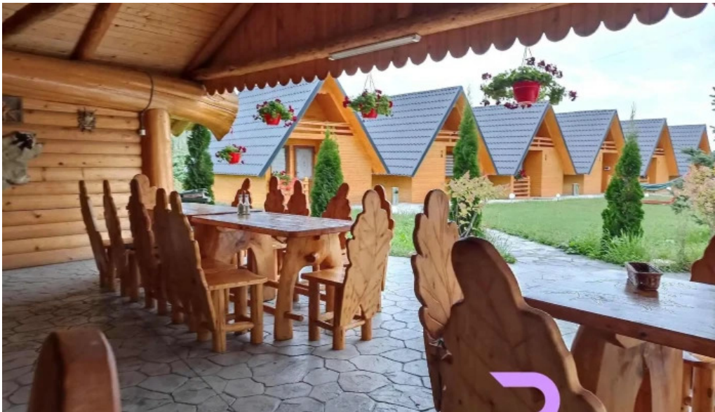
Hanul vanatorului zon?