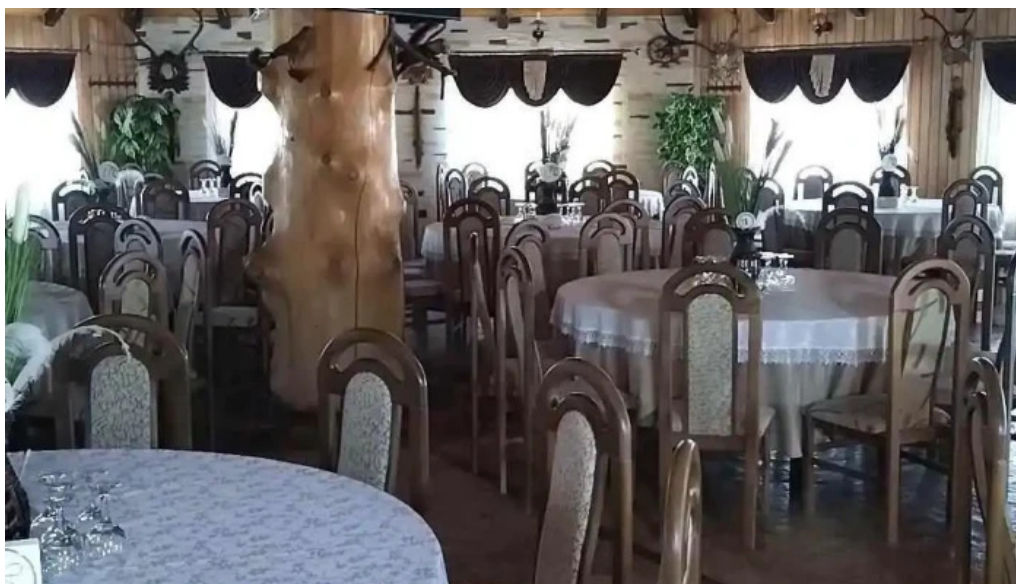
Hanul vanatorului atmosfera