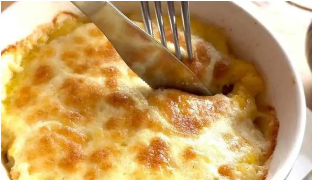
Hanul vanatorului videoclipuri