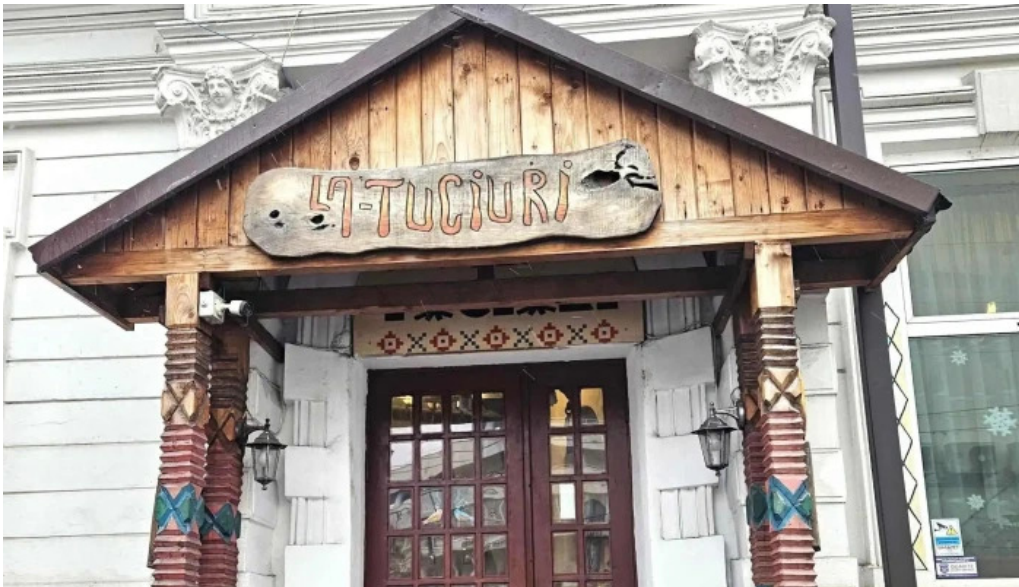
La tuciuiri pite?ti