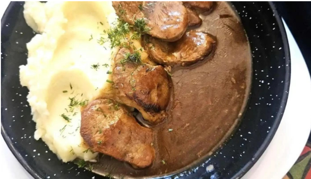
La tuciuri polenta