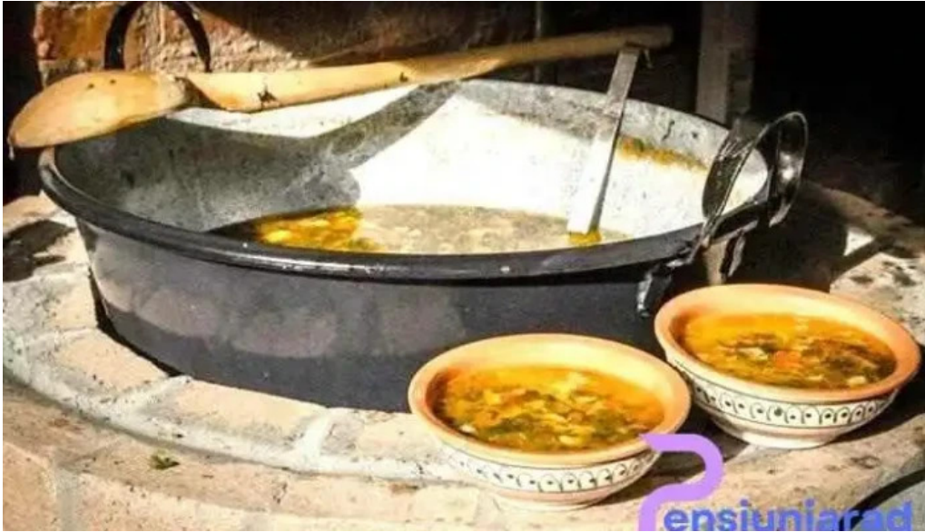
La tuciuri de la proprietar