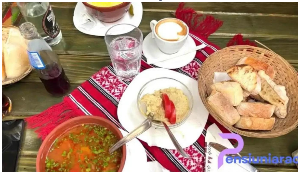
La tuciuri videoclipuri