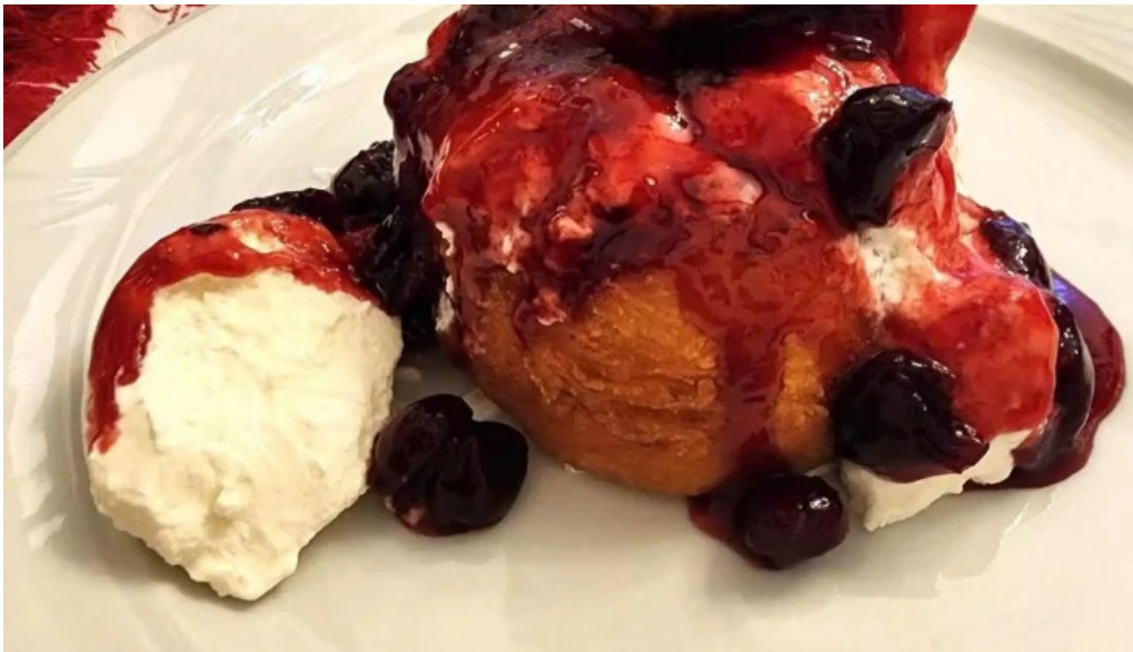
La tuciuiri papanasi