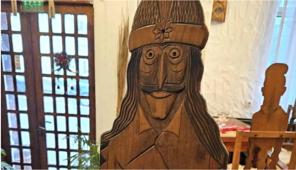
La tuciuri unde