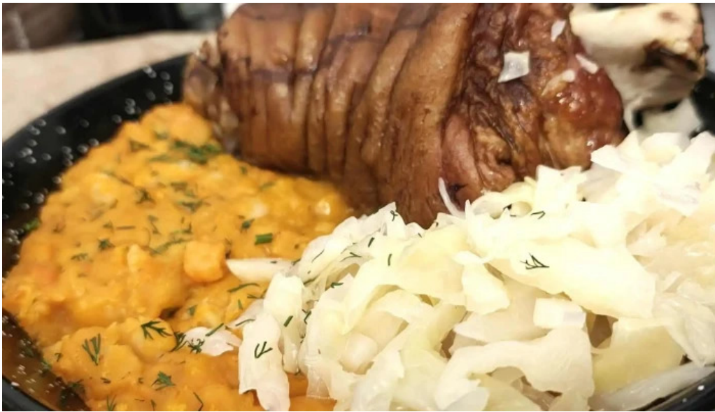
La tuciuri reduceri