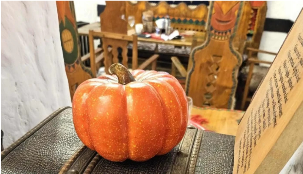
La tuciuri comentarii