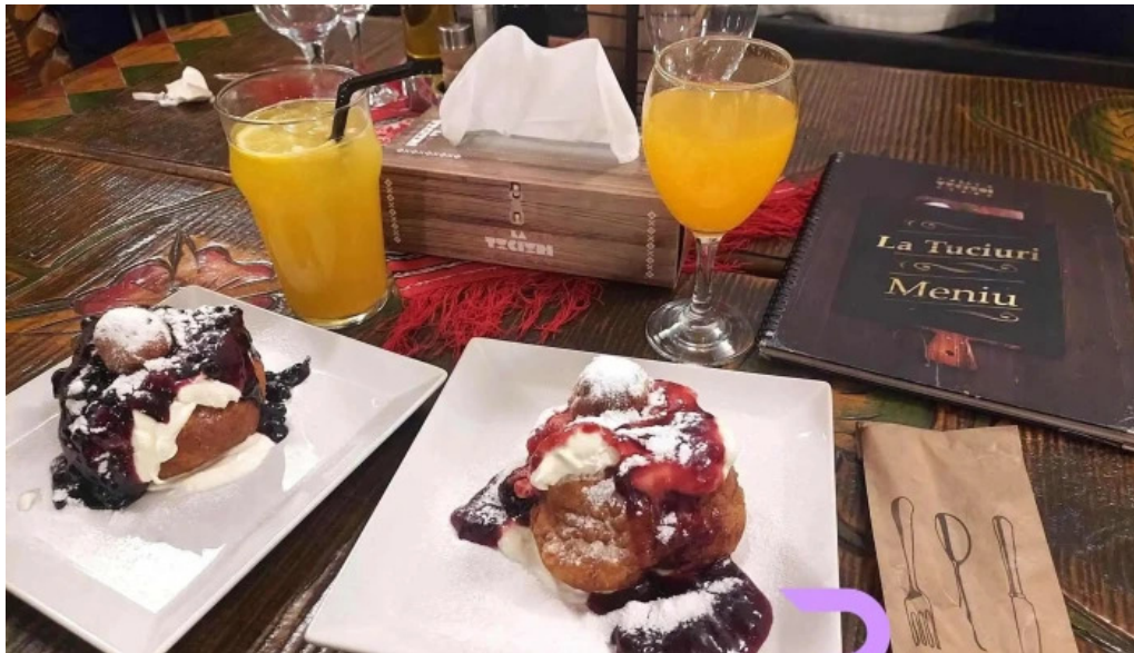
La tuciuri cele mai recente