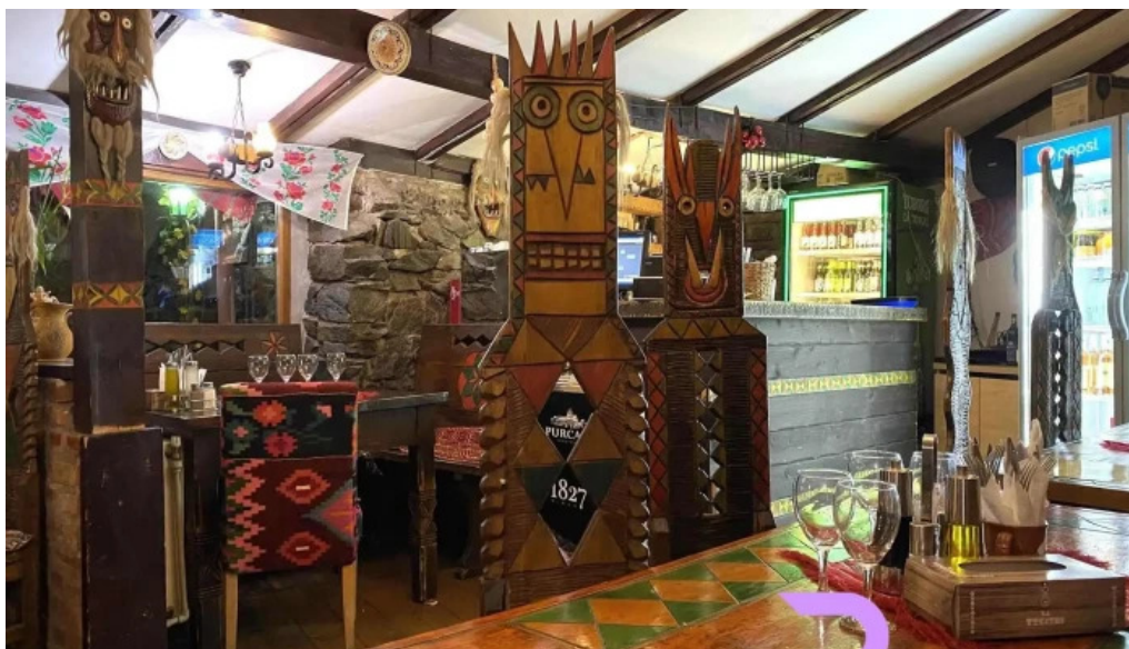
La tuciuri atmosfera