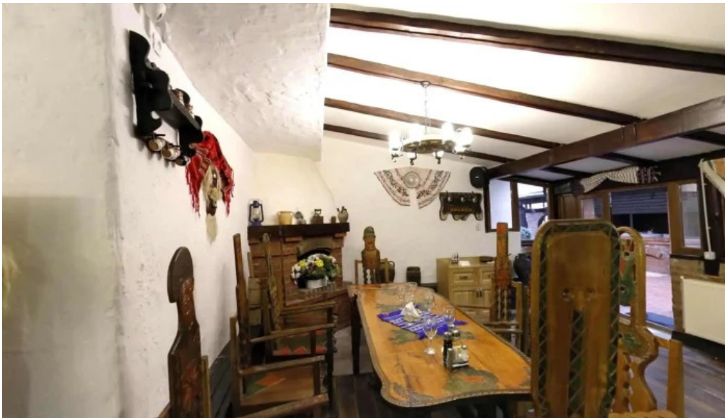
La tuciuri street view si 360deg