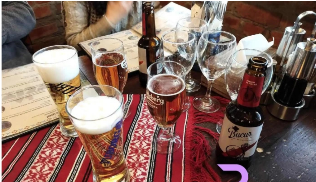
La tuciuri bere