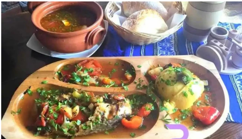
La tuciuri mancaruri bauturi