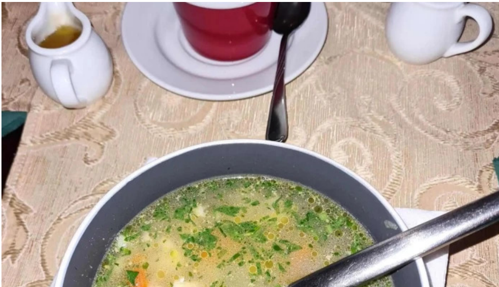
Casa sattler pite?ti