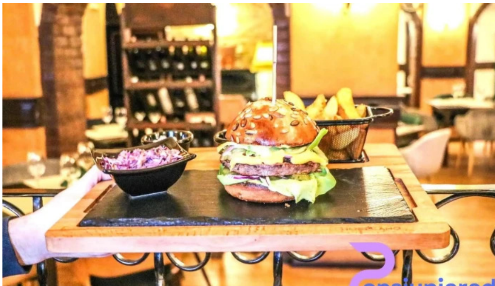
Casa sattler mancaruribauturi