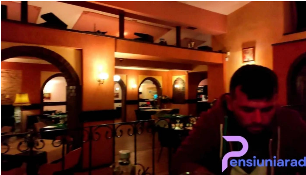
Casa sattler videoclipuri