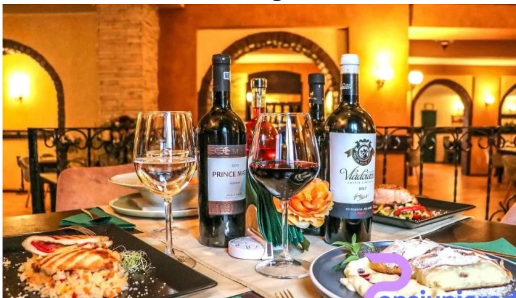
Casa sattler vin