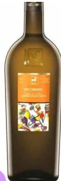
Casa sattler menu

Attractive honey blossom, peach, lemon peel and lime nose and palate. Complex and long, textured with bright lift. Smooth and silky, an appealing glassful.