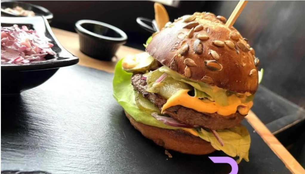
Casa sattler hamburger