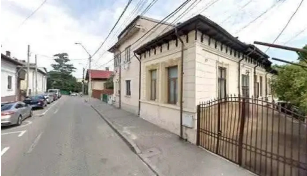
Casa sattler street view si 360deg