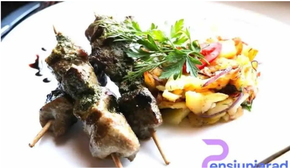
Casa sattler pui de balta