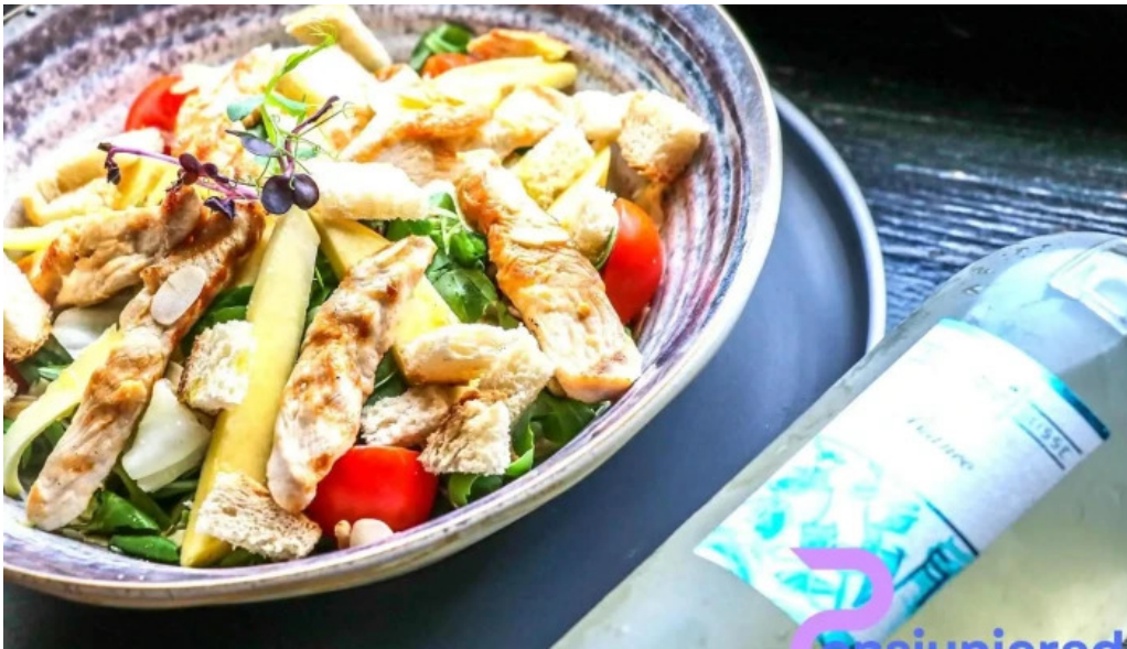
Casa sattler salata