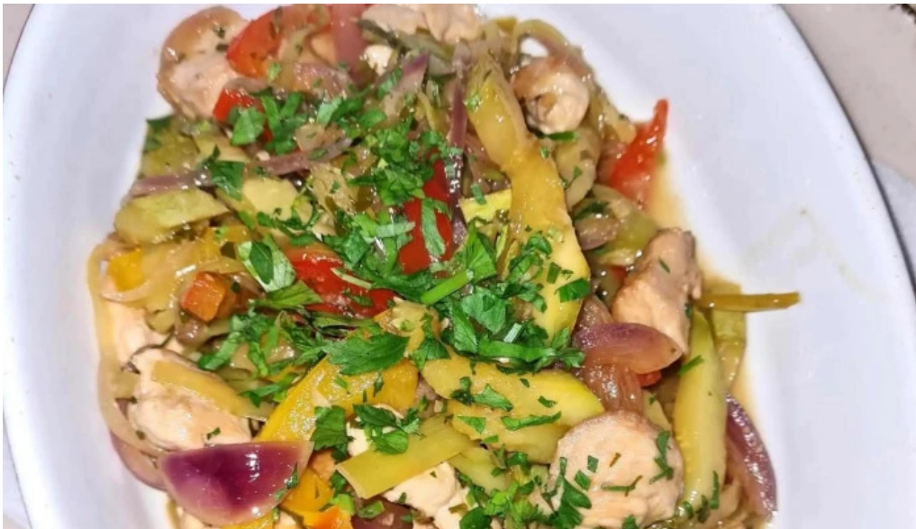
Casa sattler promo?ie