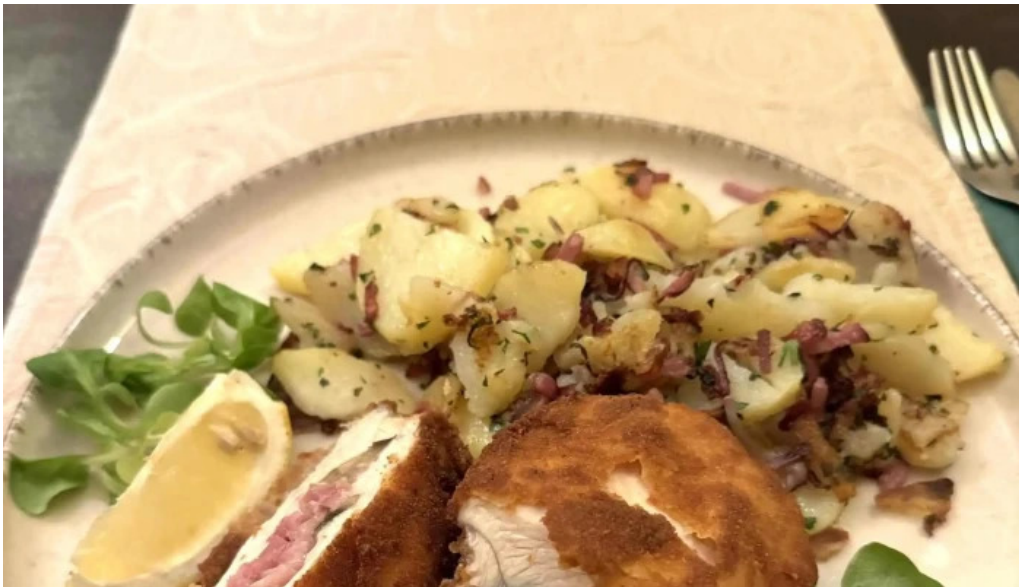
Casa sattler loca?ie