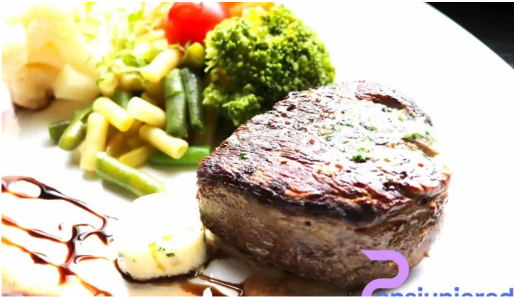
Casa sattler friptura