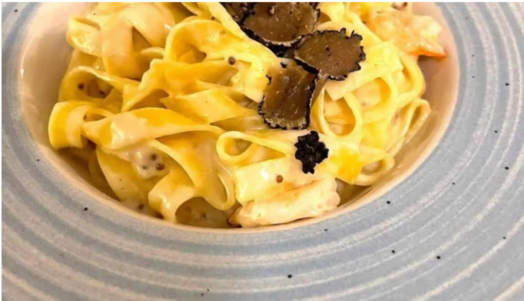
Casa sattler tagliatelle