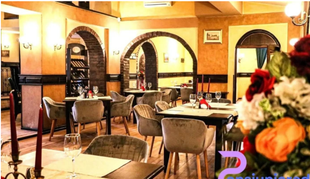
Casa sattler de la proprietar