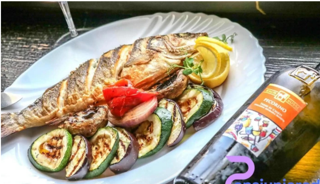
Casa sattler peste