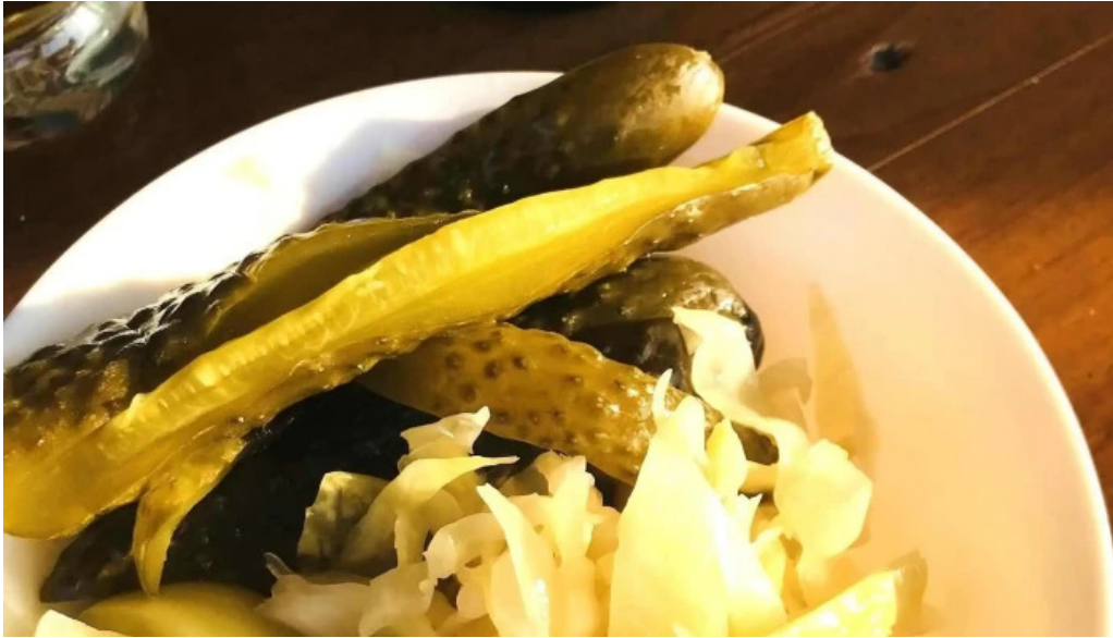
Hanu surianu scor