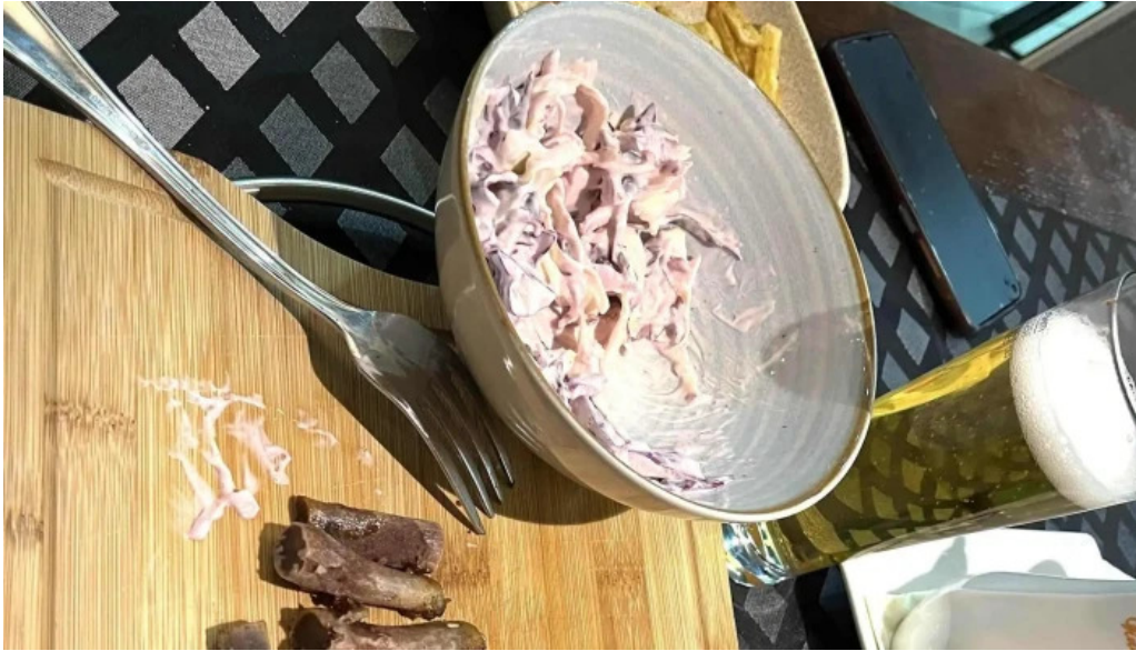
Hanu surianu zon?