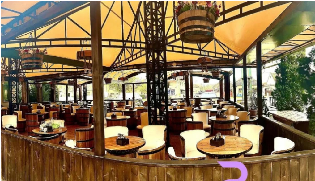
Hanu surianu de la proprietar