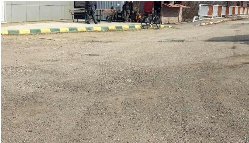
Hanu surianu cele mai recente