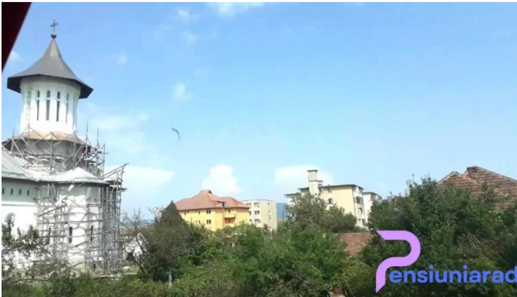
Hanu surianu videoclipuri