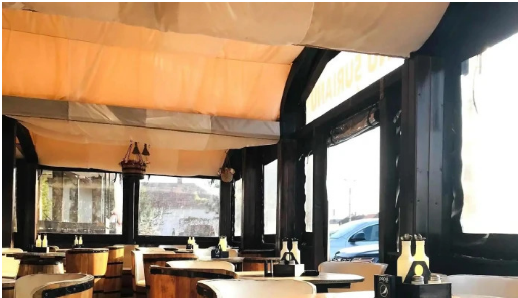
Hanu surianu reduceri