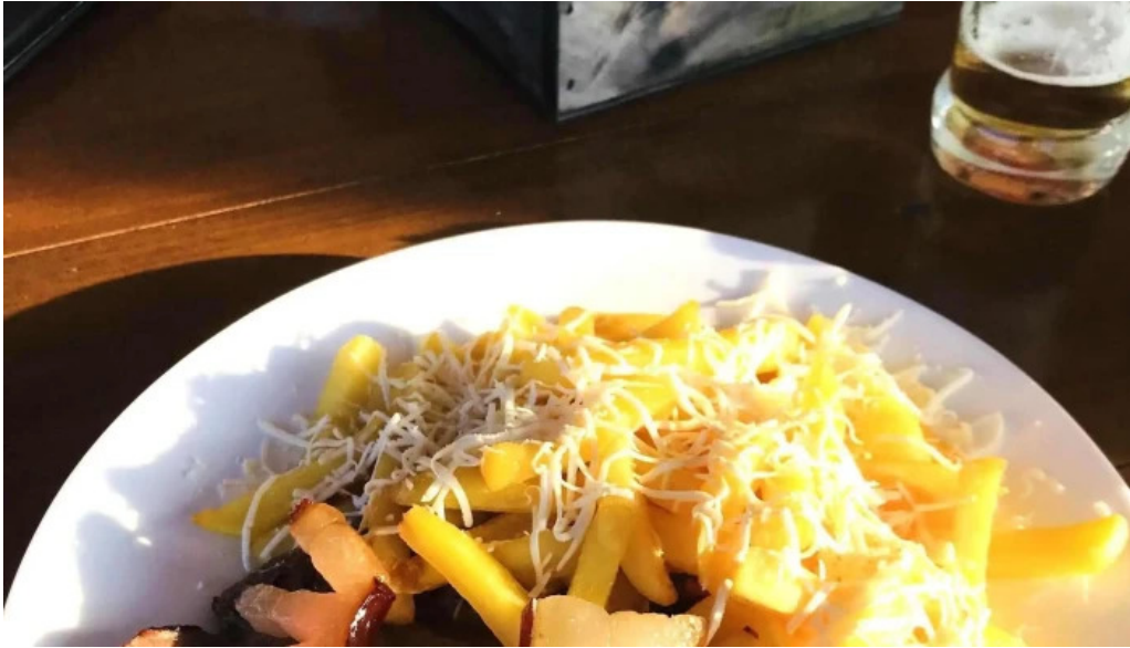
Hanu surianu program