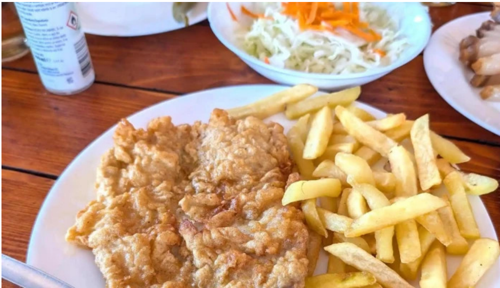
Hanu surianu or??tie