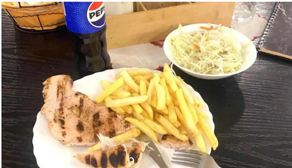
Hanu surianu mancaruribauturi