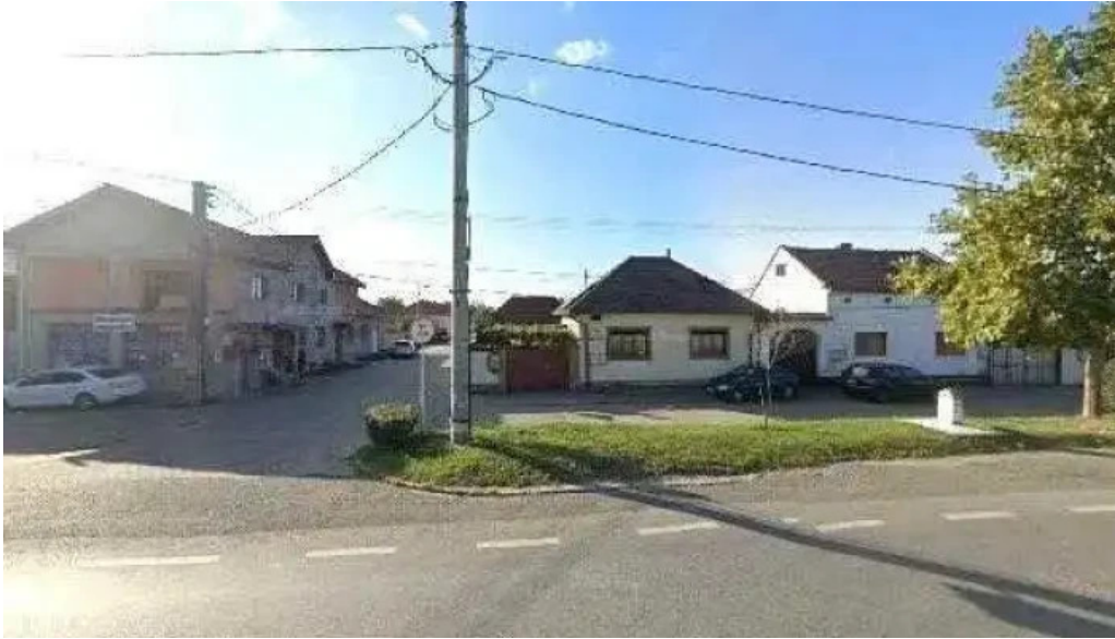
Hanu surianu street view si 360deg