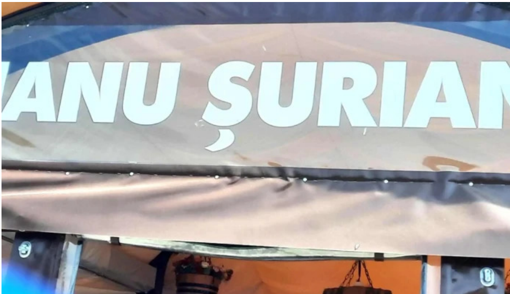
Hanu surianu aproape de mine