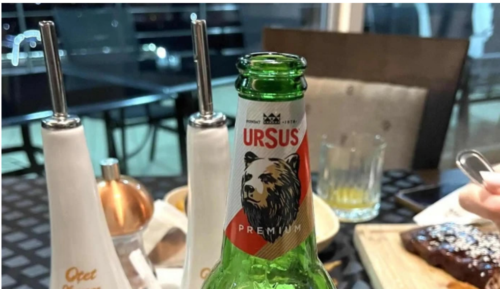
Hanu surianu catalog