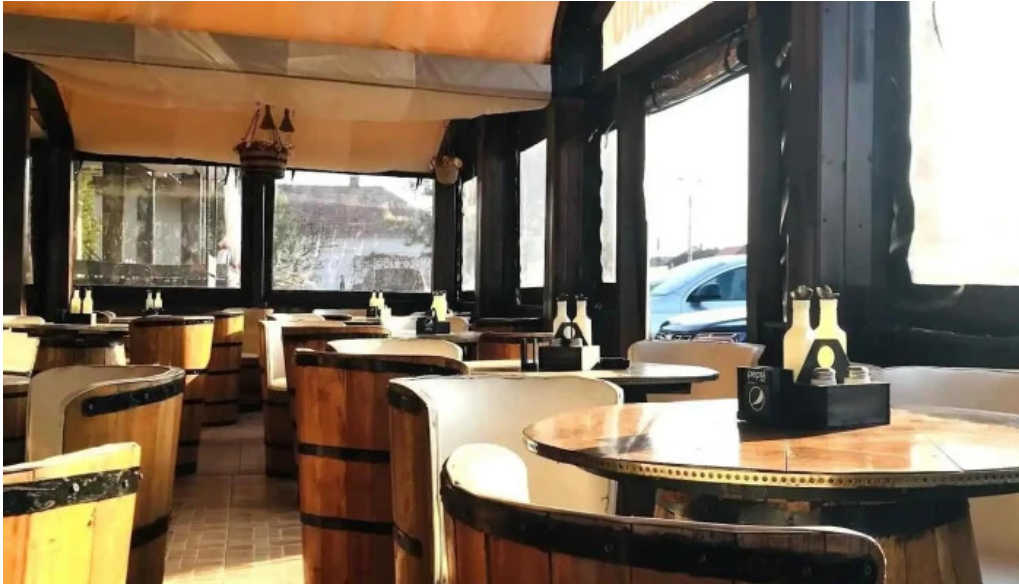
Hanu surianu atmosfera