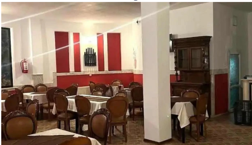
Hanu' ?urianu or??tie