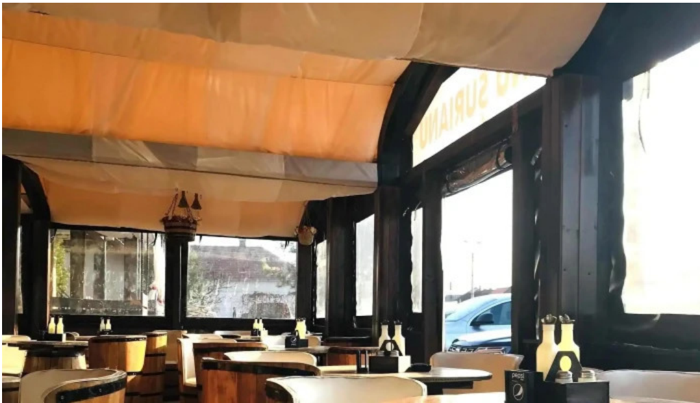
Hanu surianu site web