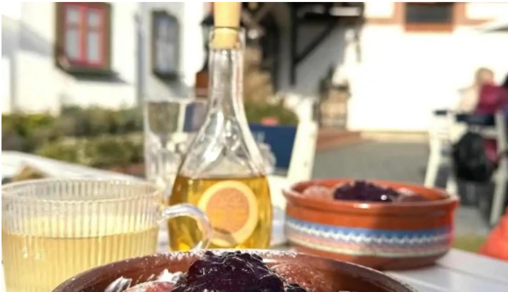
Hanul teilor cele mai recente