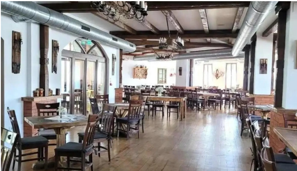
Hanul teilor d?ne?ti