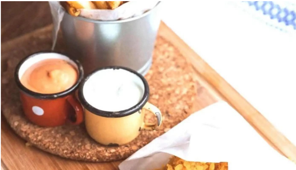
Hanul teilor de la proprietar