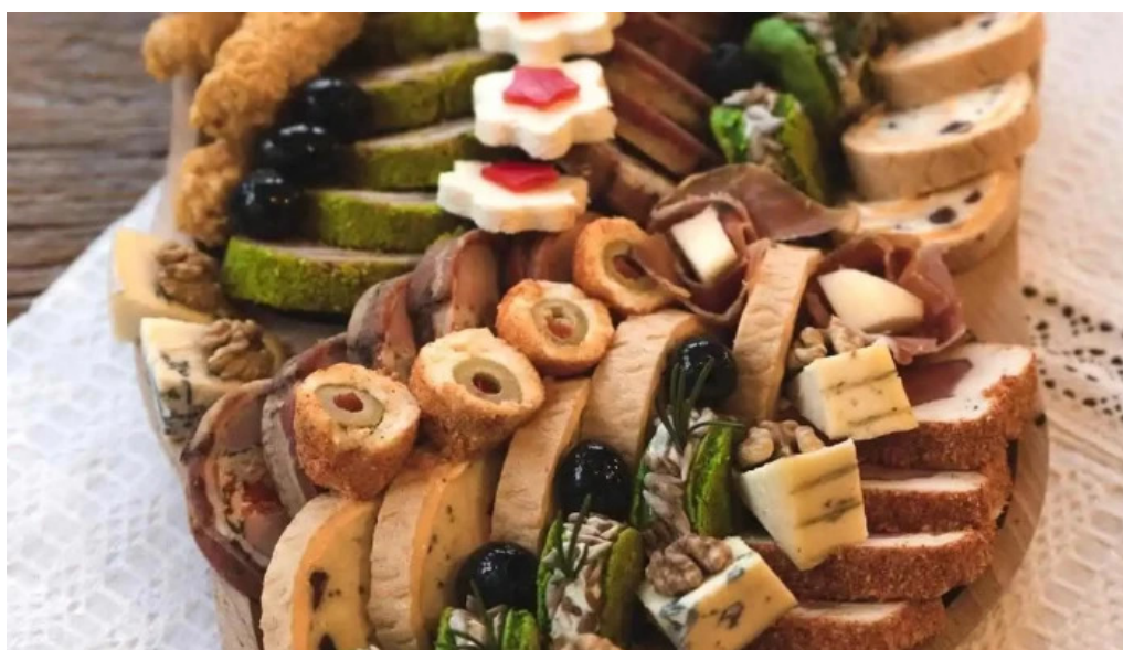
Hanul teilor mancaruribauturi