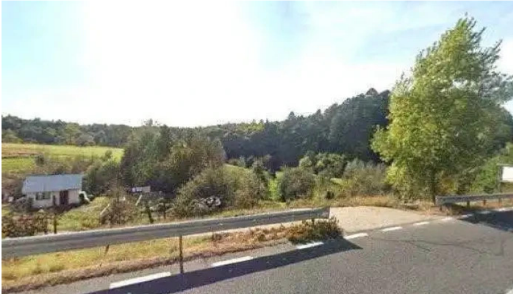
Hanul teilor street view si 360deg