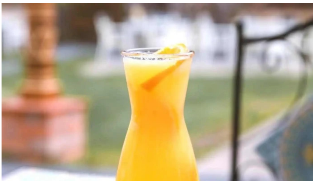
Hanul teilor suc