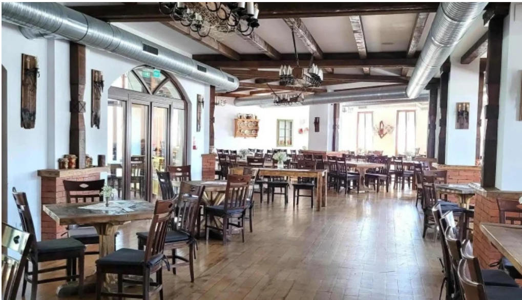
Hanul teilor promo?ie