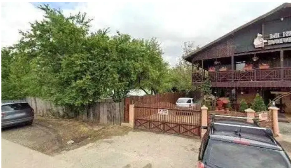
La hanul bucatarilor street view si 360deg