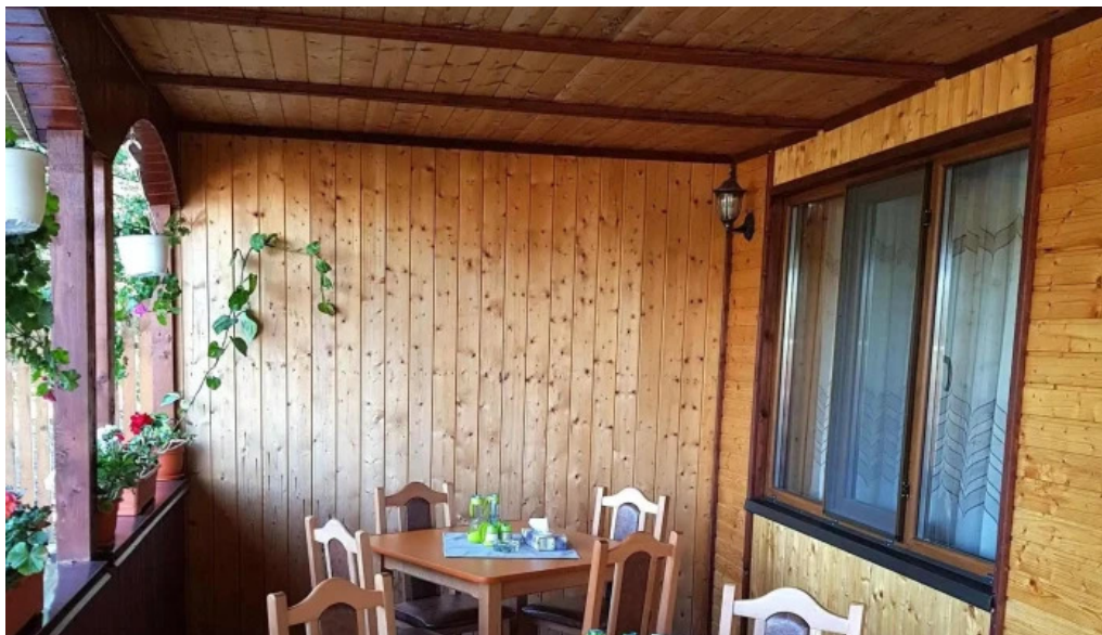
La hanul bucatarilor adres?