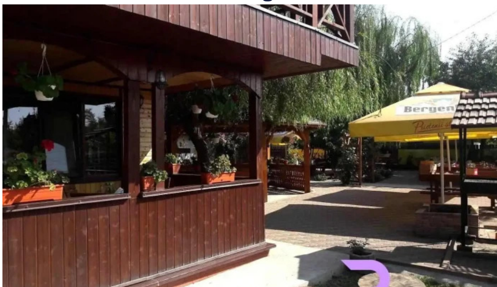
La hanul buc?tarilor c?z?ne?ti