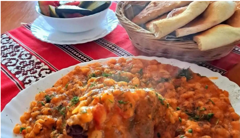
La hanul bucatarilor mancaruribauturi