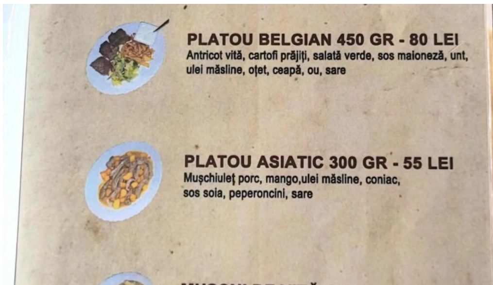
La hanul bucatarilor aproape de mine