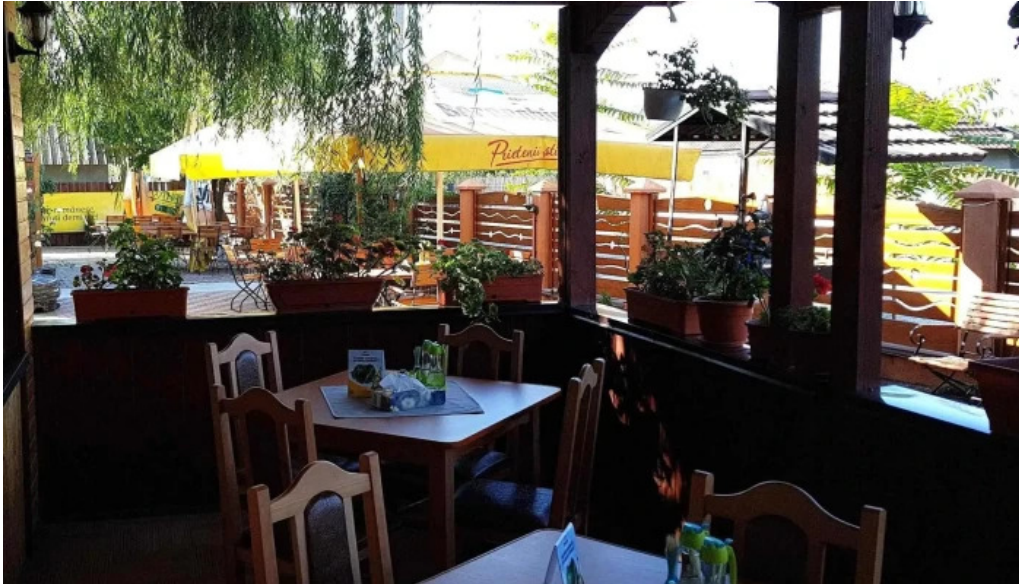
La hanul bucatarilor pre?uri