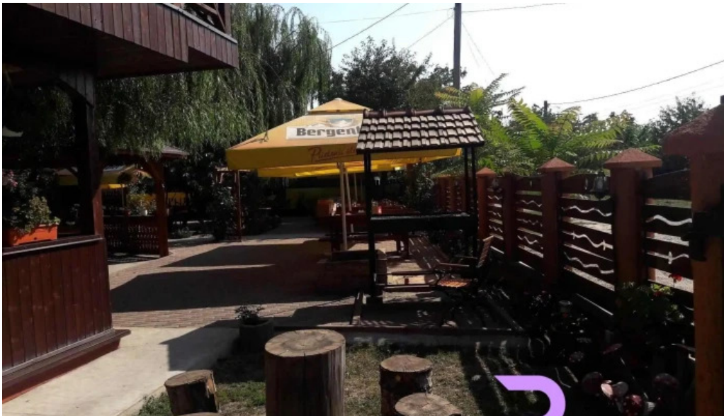
La hanul bucatarilor atmosfera