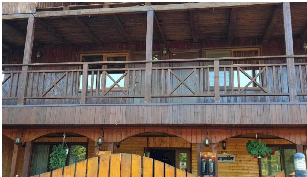
La hanul bucatarilor reduceri