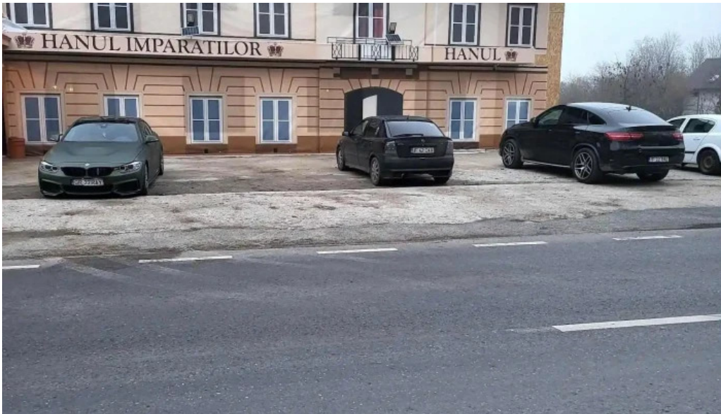
Hanul imparatilor num?r