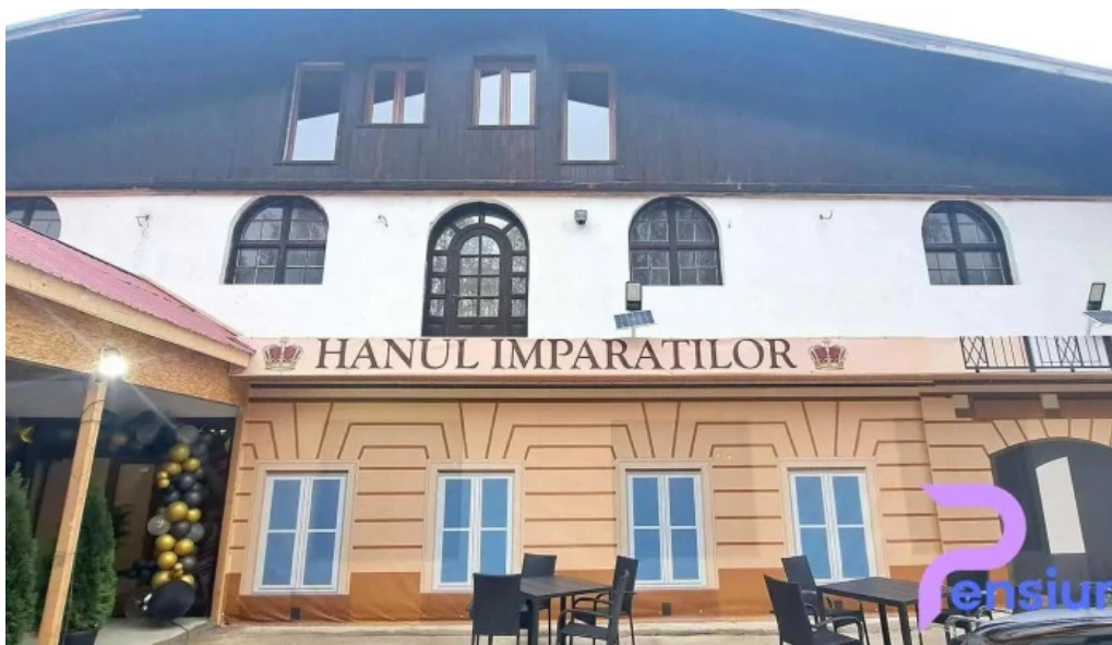
Hanul imparatilor de la proprietar