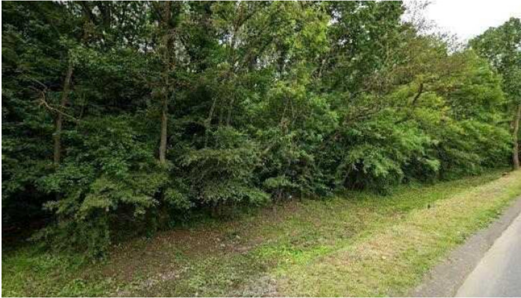
Hanul imparatilor street view si 360deg