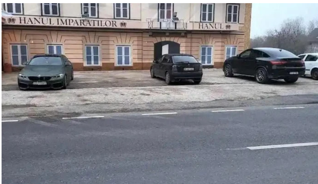
Hanul imparatilor ciorogarla