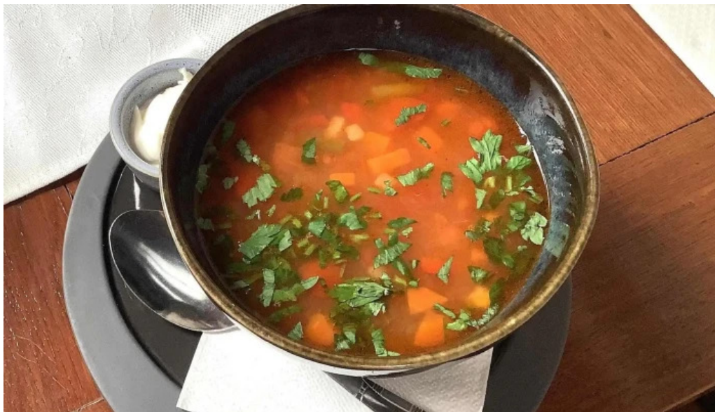
Restaurant ciobanasu campulung