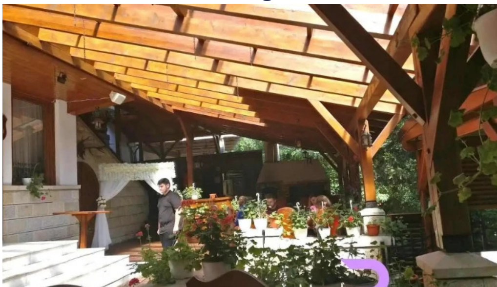
Restaurant ciob?na?u campulung