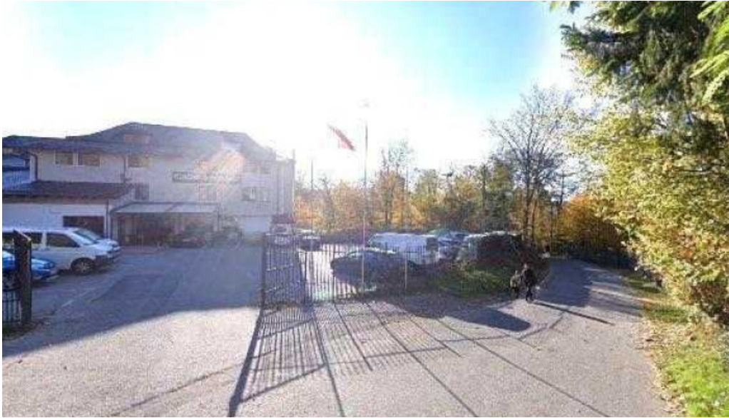
Restaurant ciobanasu street view si 360deg