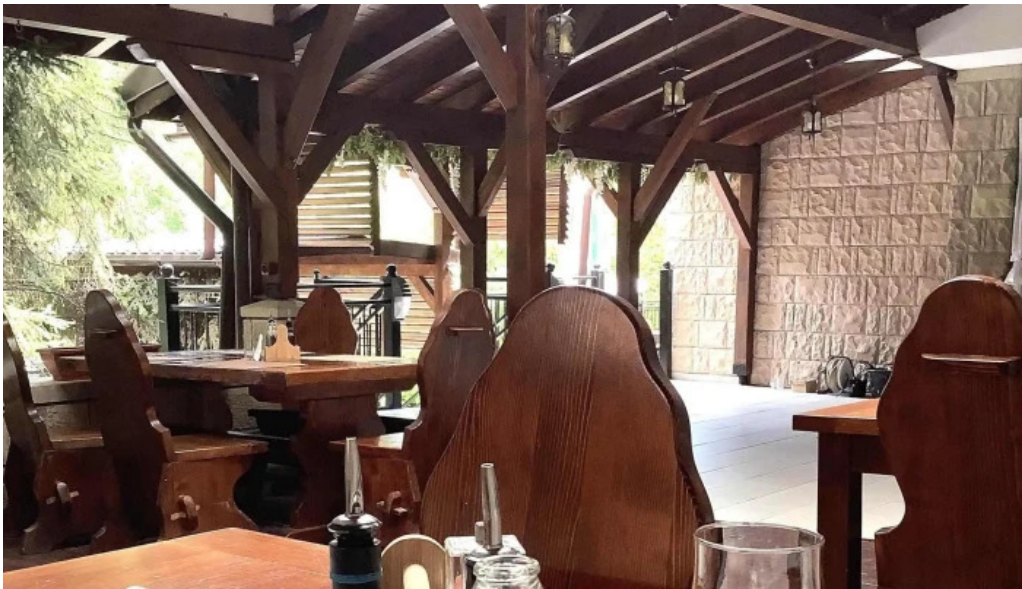
Restaurant ciobanasu pre?uri