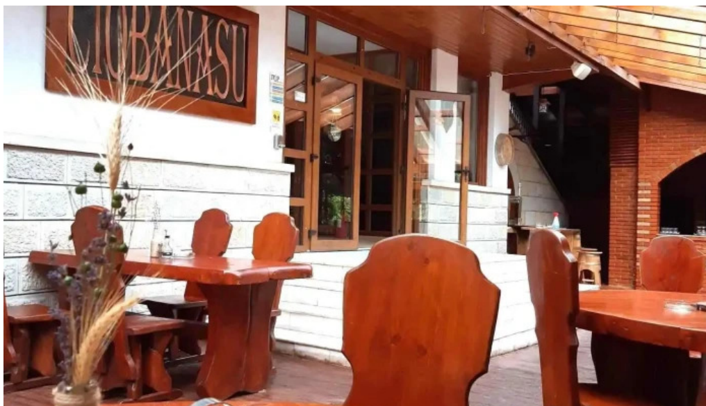
Restaurant ciobanasu atmosfera