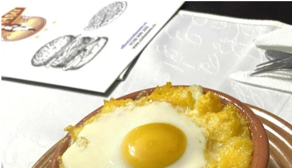
Restaurant ciobanasu comentarii