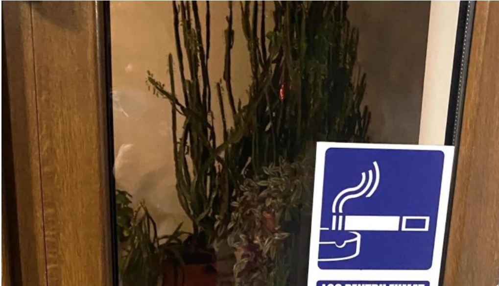
Restaurant ciobanasu zon?