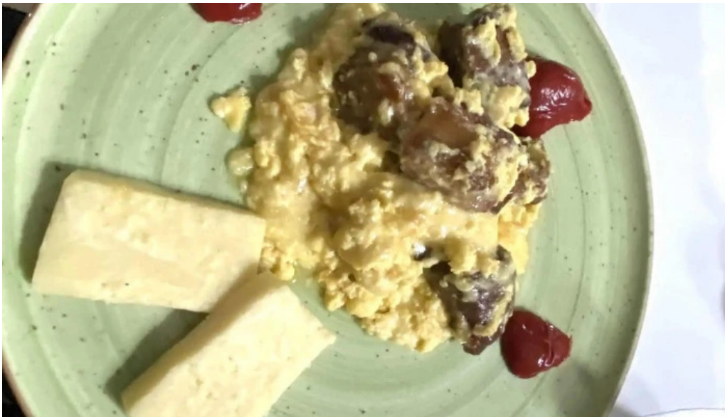
Restaurant ciobanasu deschis acum