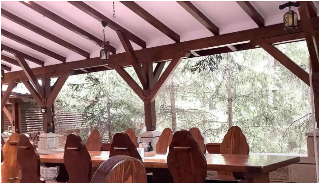
Restaurant ciobanasu videoclipuri