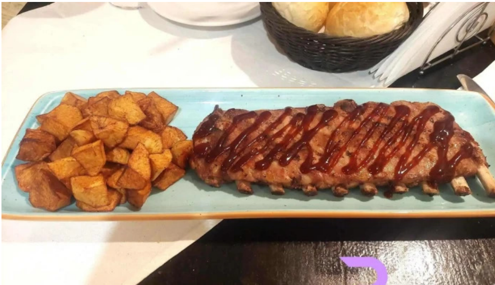
Restaurant ciobanasu friptura