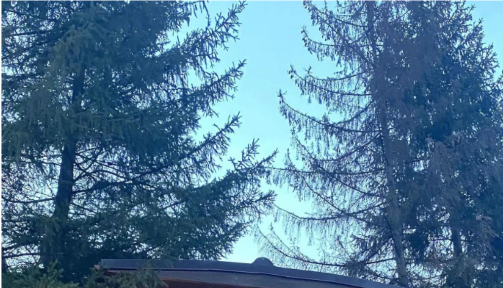
Restaurant ciobanasu loca?ie