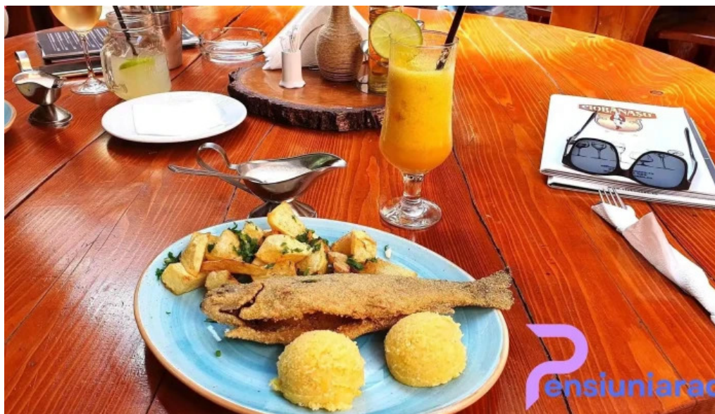
Restaurant ciobanasu mancaruribauturi