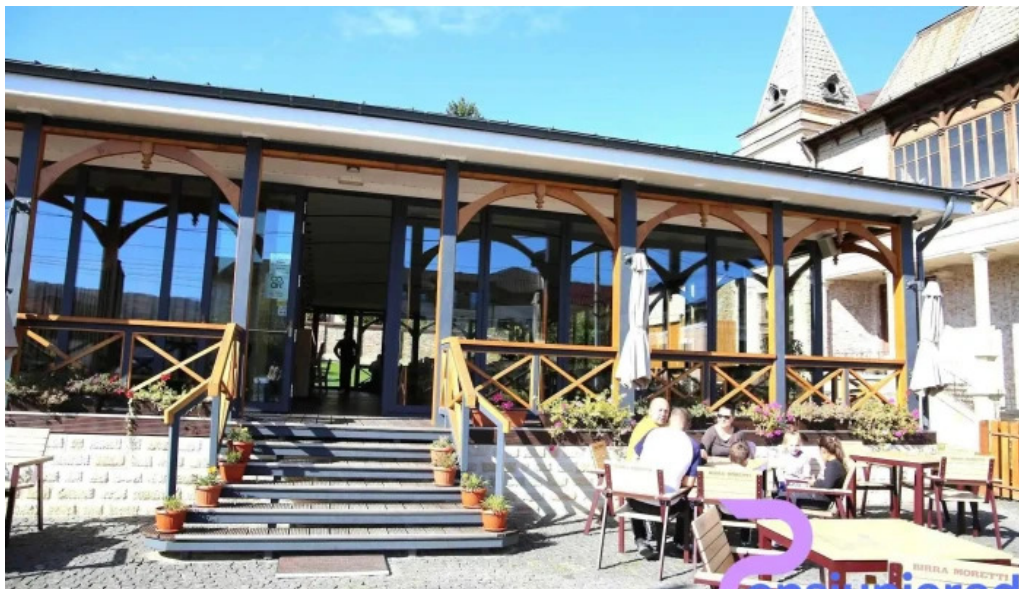
Coart de la proprietar