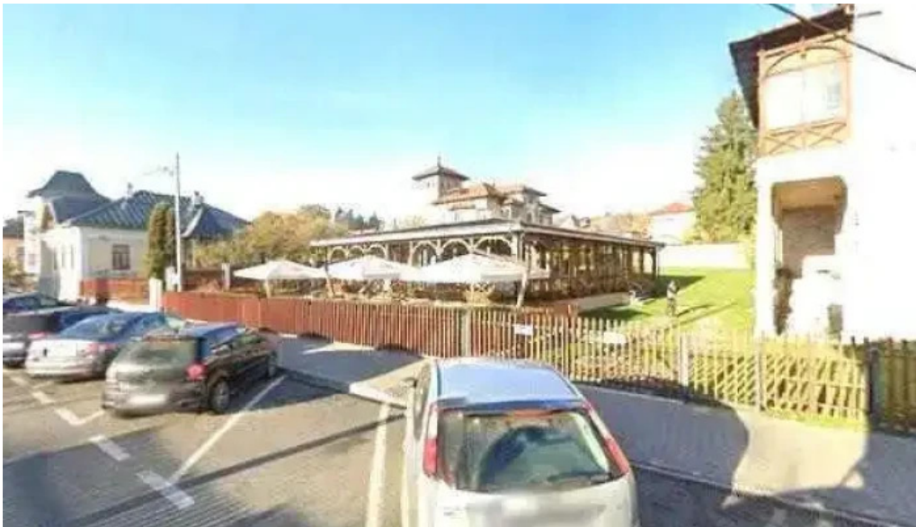
Coart street view si 360deg