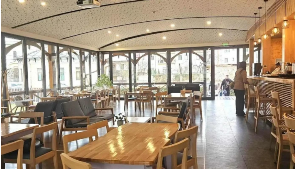
Coart cele mai recente