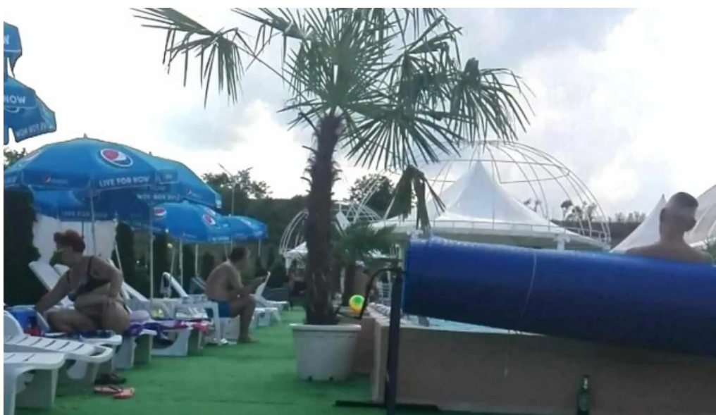
Pensiunea juliana brad