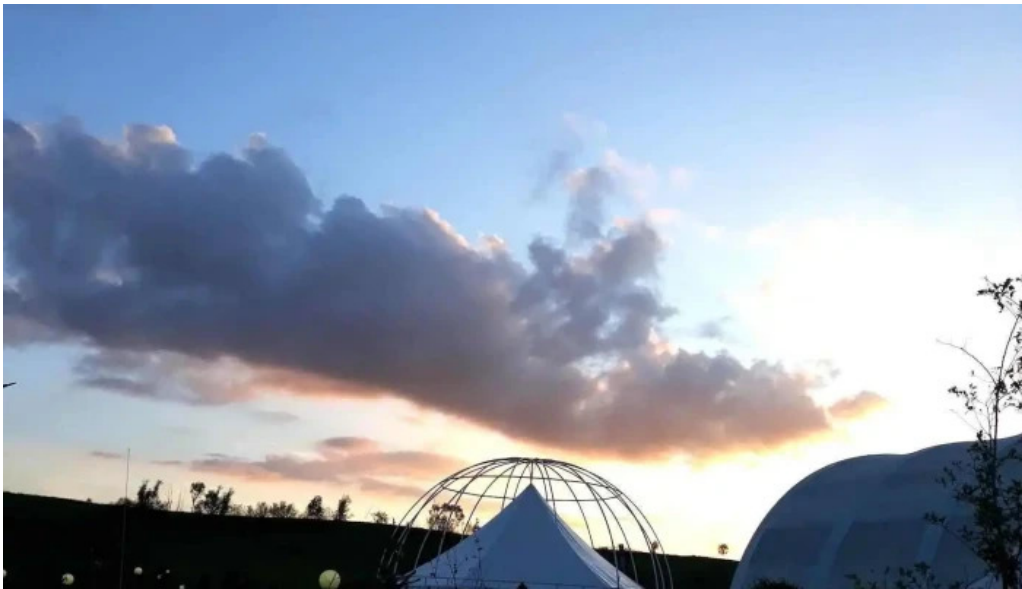
Pensiunea juliana program