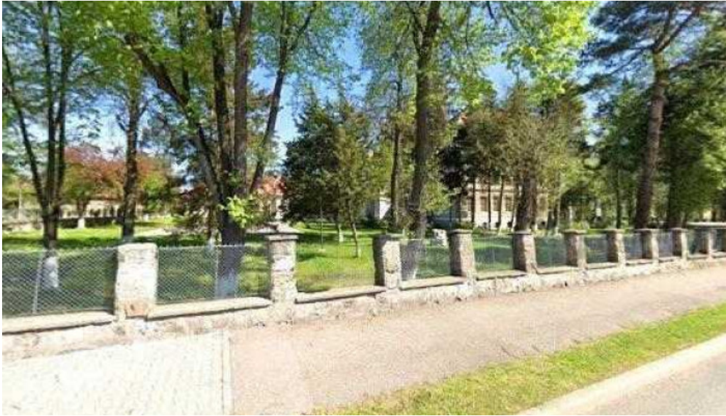
Pensiunea juliana street view si 360deg