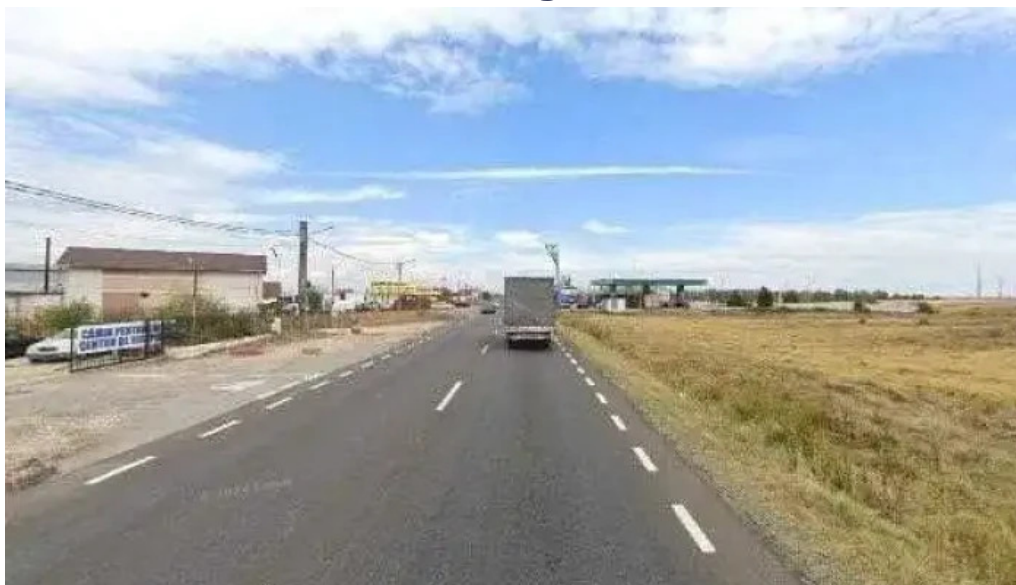
Restaurant relly street view si 360deg