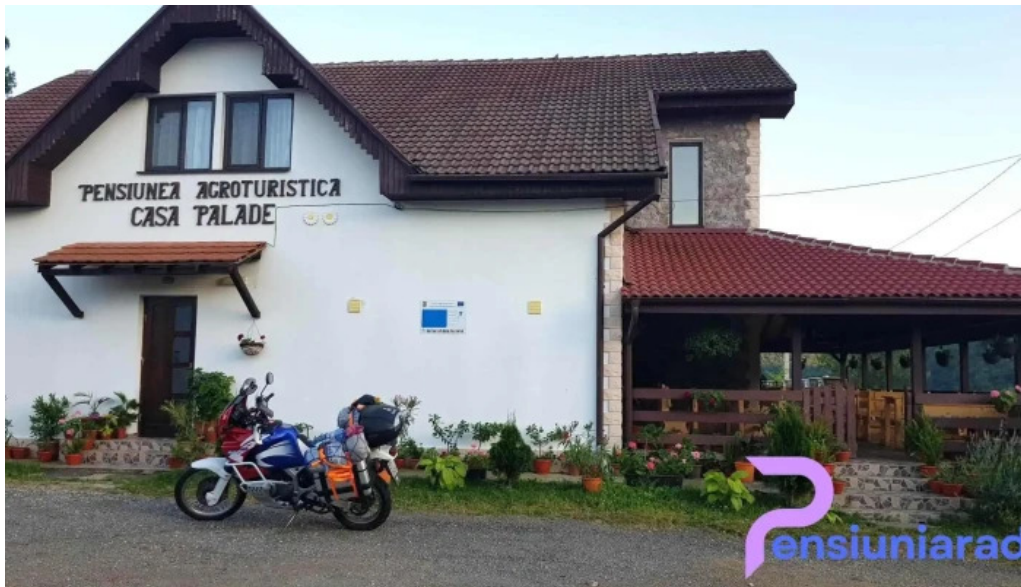
Restaurant relly loca?ie