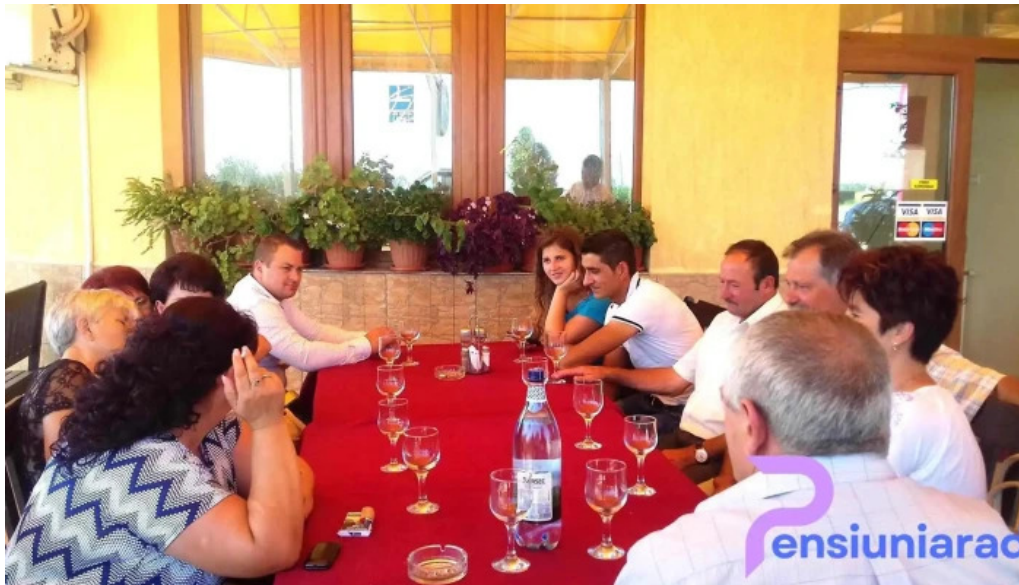
Restaurant relly atmosfera