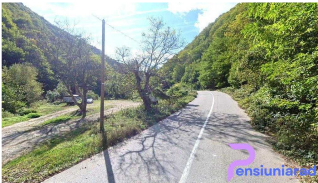
Furnalul de la topli?a topli?a