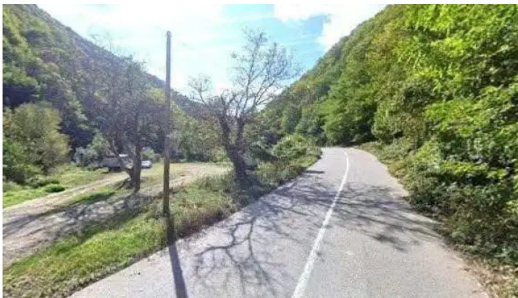
Furnalul de la toplita promo?ie