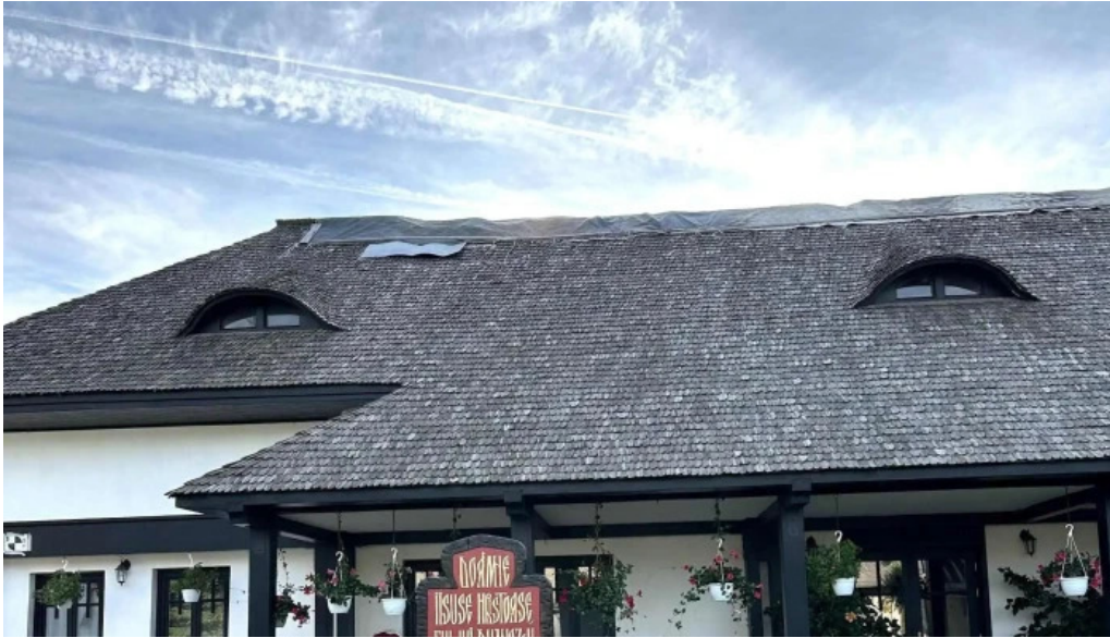
Manastirea turnu de prahova telefon