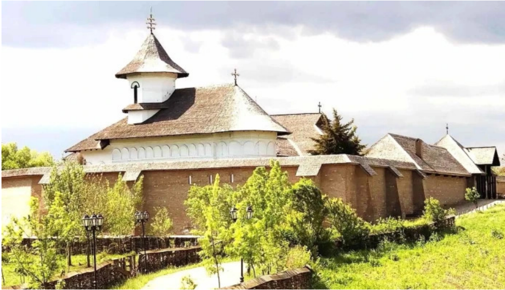
Manastirea turnu de prahova zon?