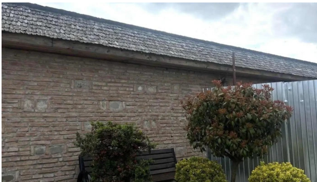
Manastirea turnu de prahova cele mai recente