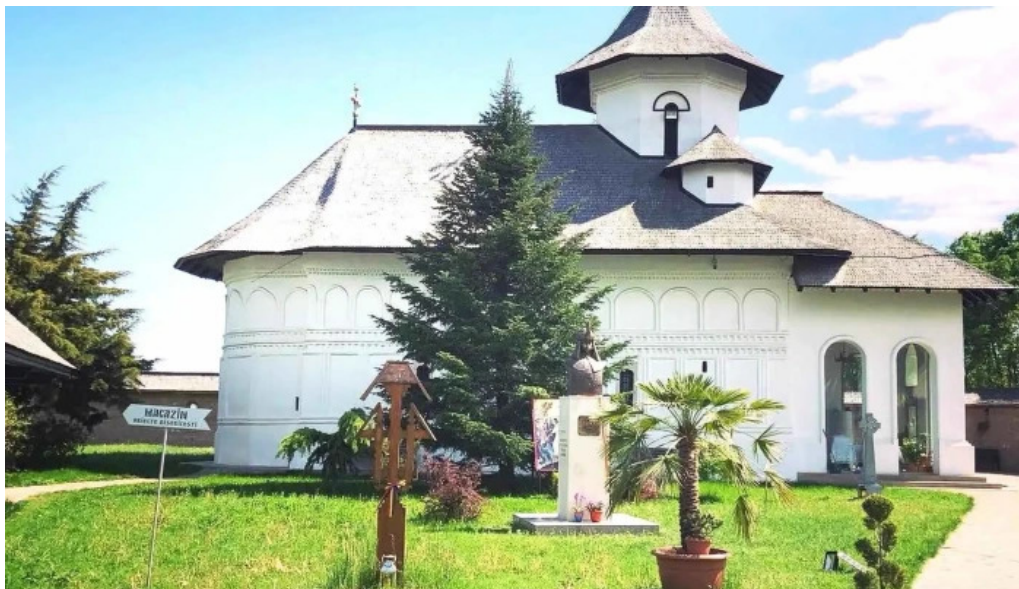
Manastirea turnu de prahova fotografii