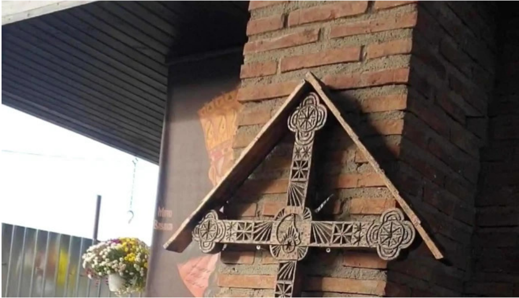
Manastirea turnu de prahova num?r