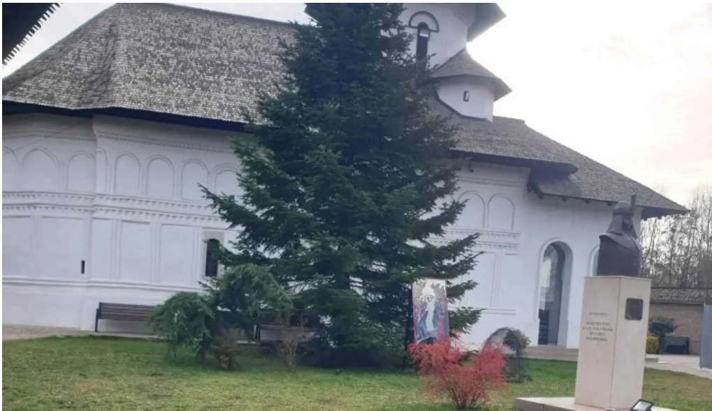
Manastirea turnu de prahova instagram