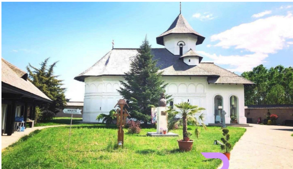
Măștiarea turnu de prahova targ?oru vechi