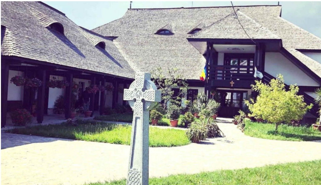
Manastirea turnu de prahova reduceri