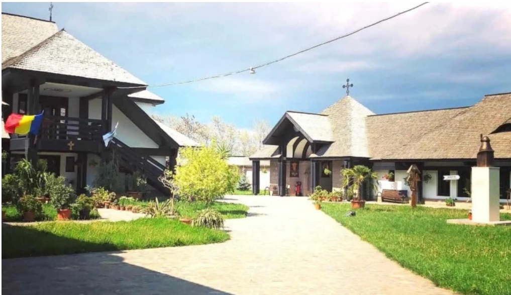
Manastirea turnu de prahova recenzii