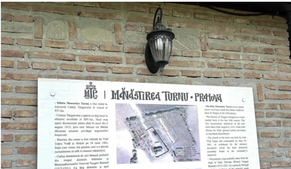
Manastirea turnu de prahova promo?ie