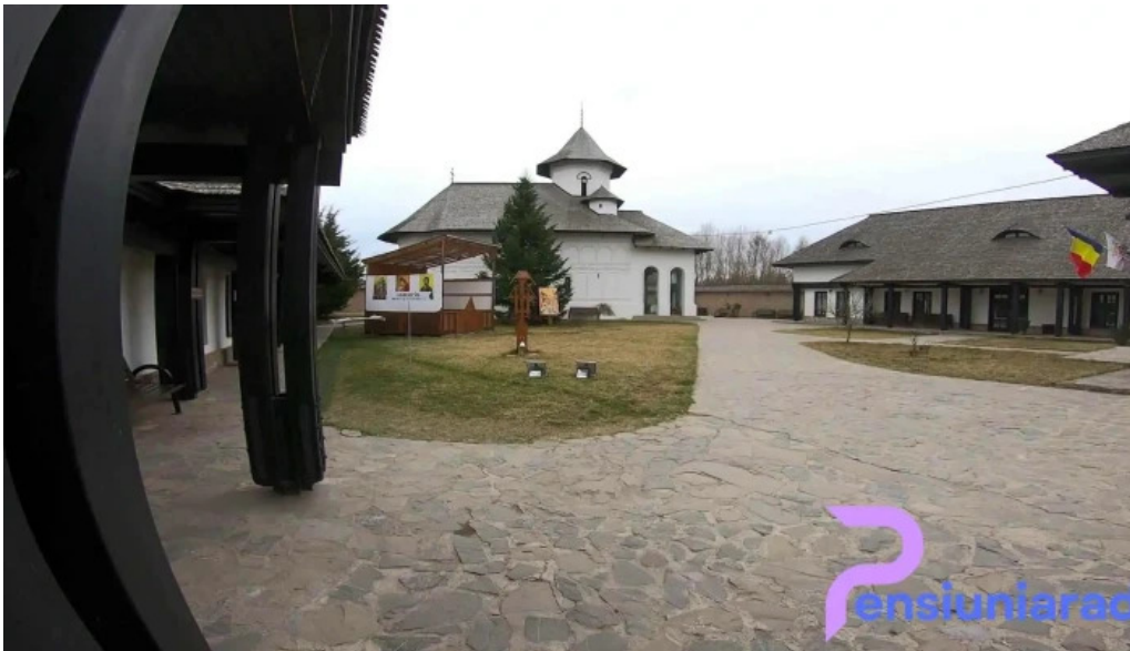
Manastirea turnu de prahova videoclipuri