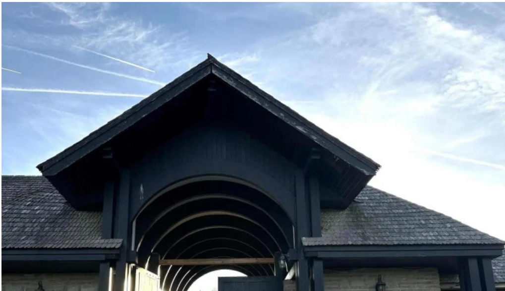
Manastirea turnu de prahova targ?oru vechi