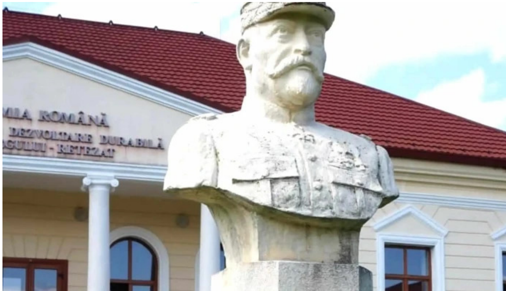
Conacul berthelot loca?ie