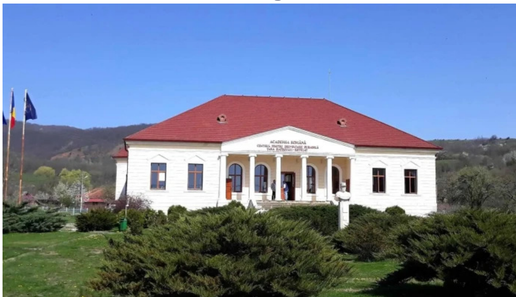
Conacul berthelot site web