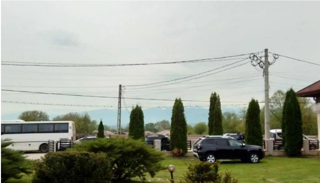
Conacul berthelot cum s? ajungi acolo