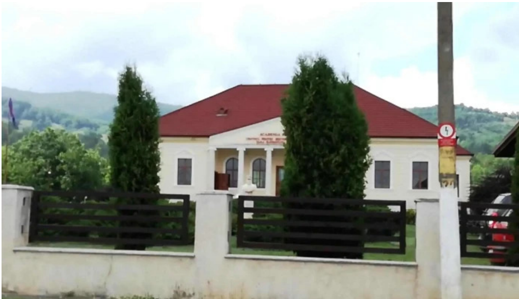
Conacul berthelot catalog