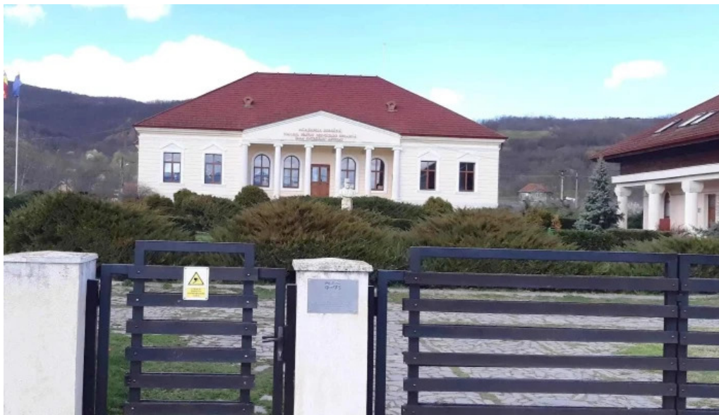
Conacul berthelot deschis acum