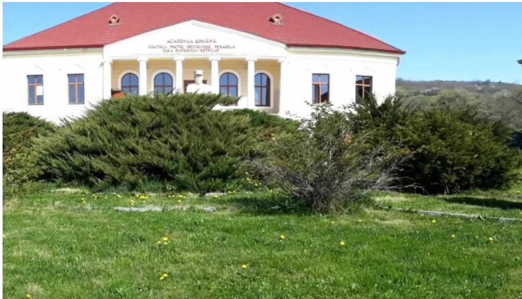
Conacul berthelot aproape de mine