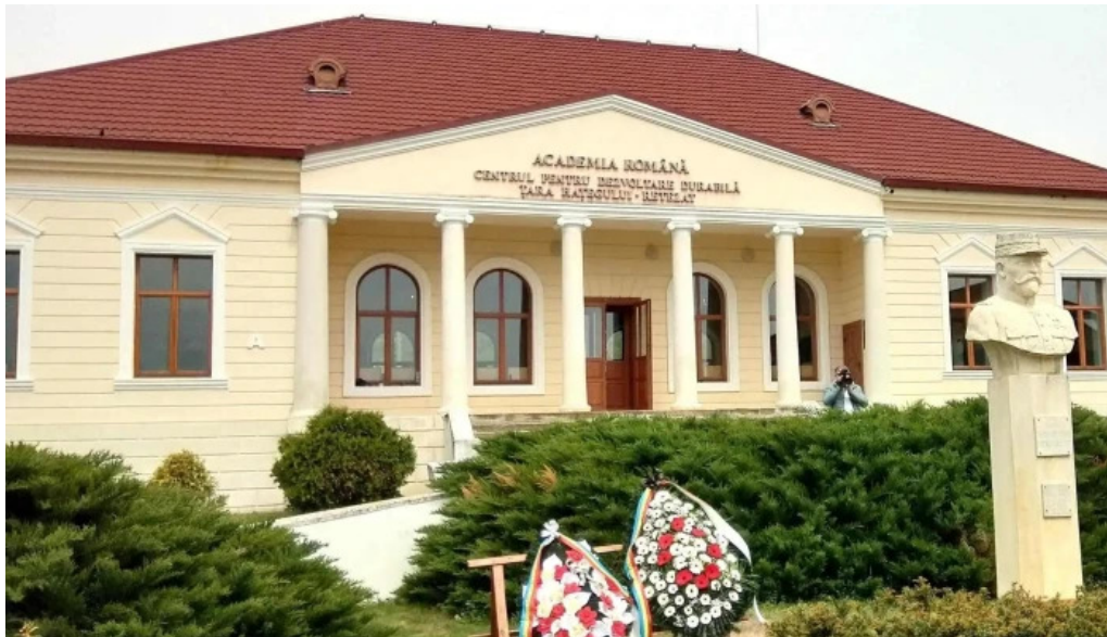
Conacul berthelot general berthelot