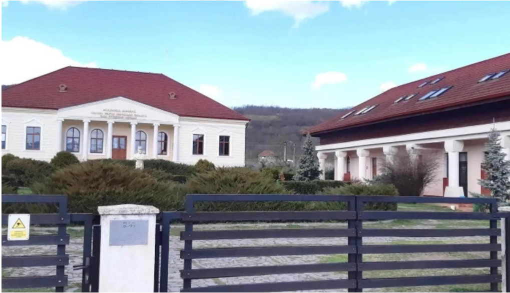
Conacul berthelot program