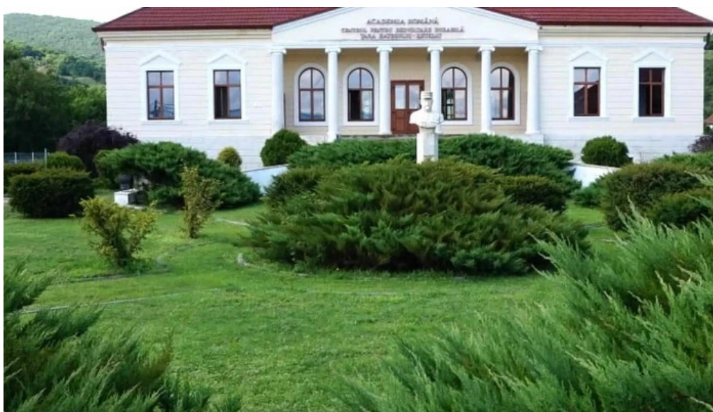
Conacul berthelot promoție