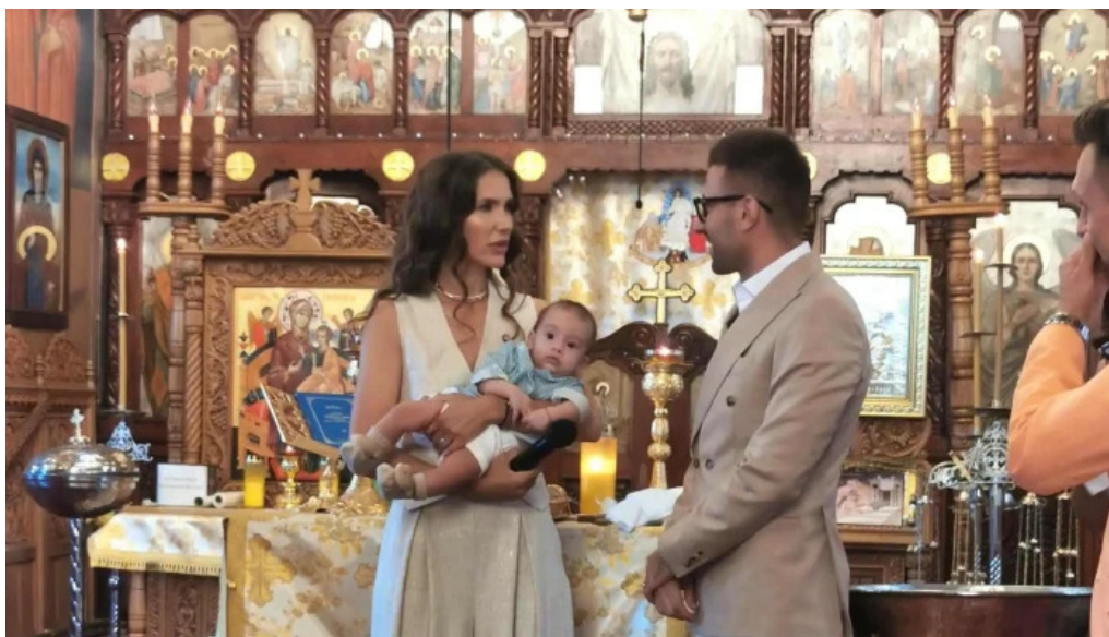
Biserica sfantul nicolae din ciofliceni ciofliceni