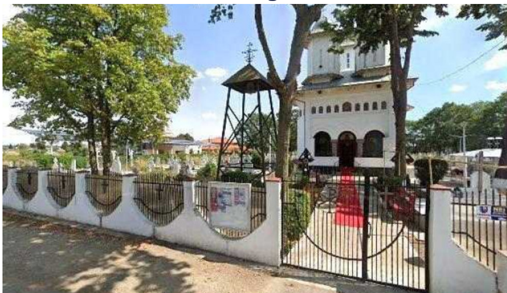
Biserica sfantul nicolae din ciofliceni street view si 360deg