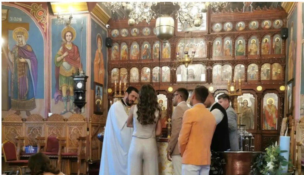
Biserica sfantul nicolae din ciofliceni deschis acum