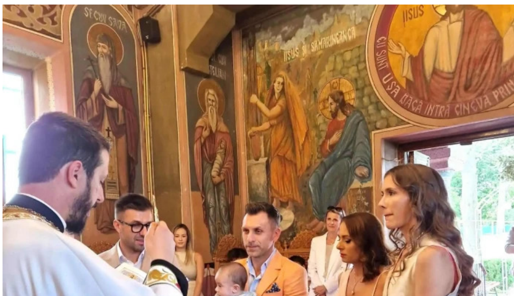
Biserica sfantul nicolae din ciofliceni program