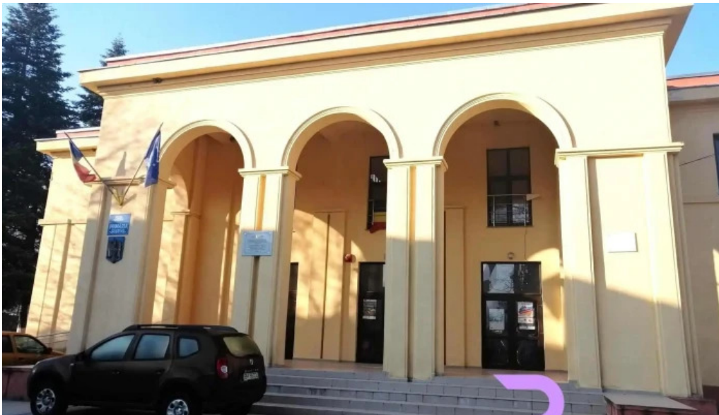
Primaria vascau catalog