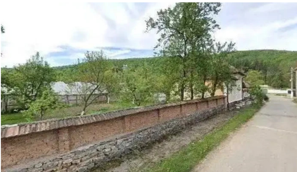
Primaria vascau street view si 360deg