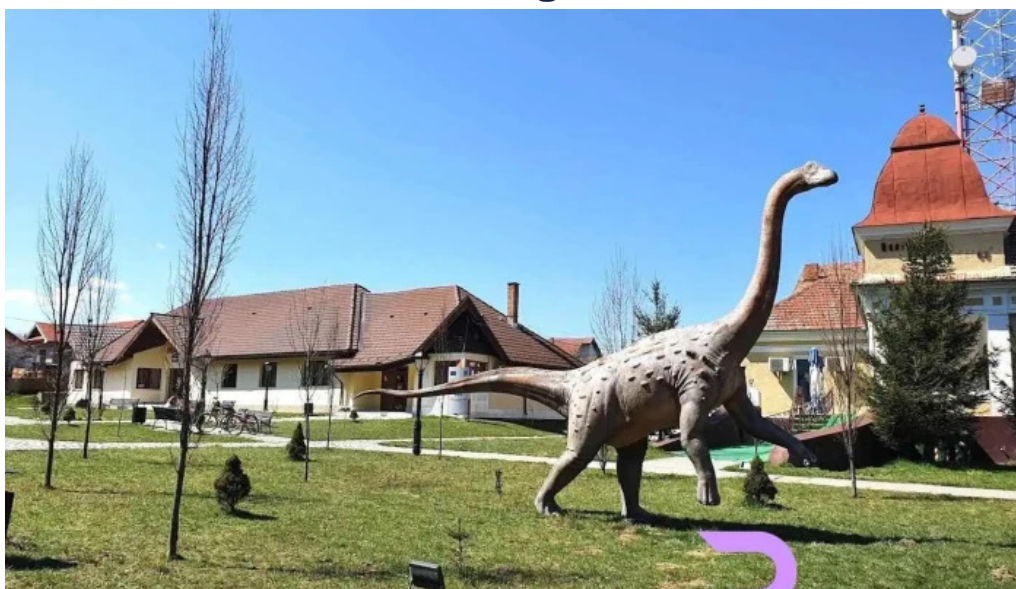
Primăria sălașu de sus sălașu de sus