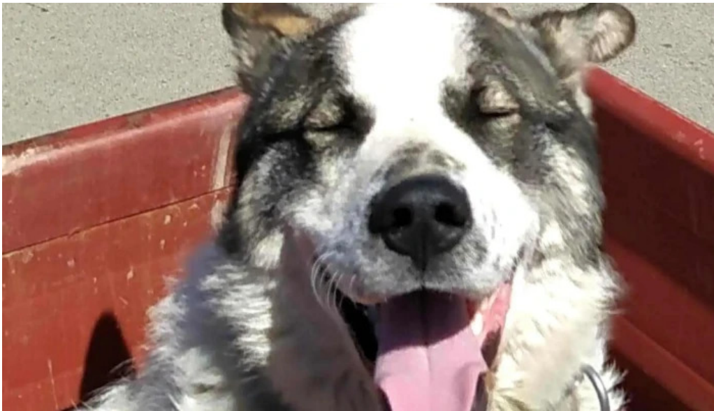
Primaria salasu de sus s?la?u de sus