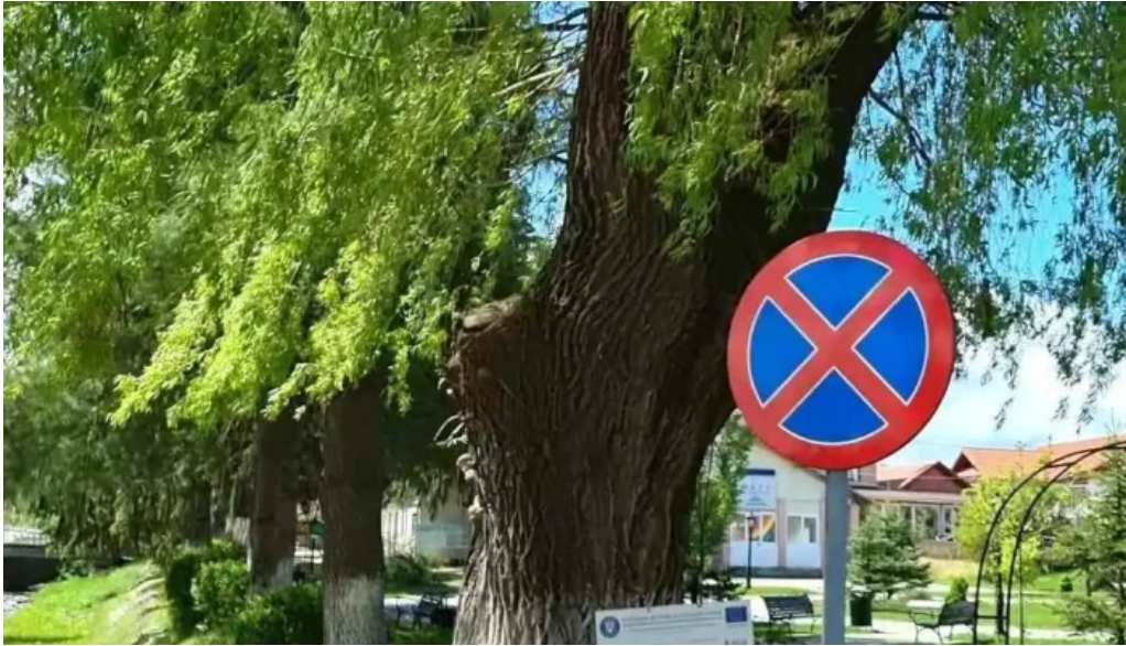
Primaria salasu de sus videoclipuri