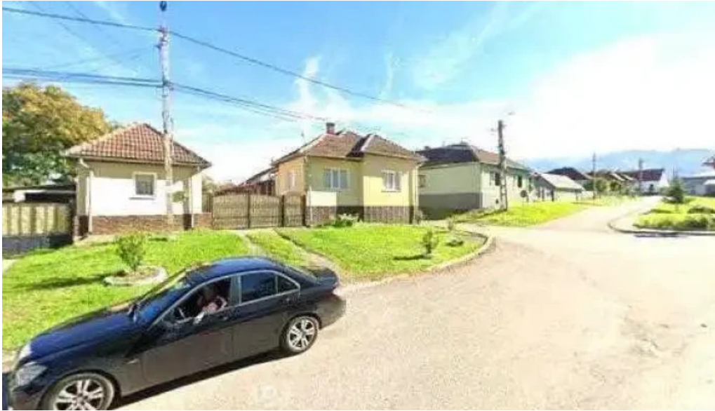
Primaria salasu de sus street view si 360deg