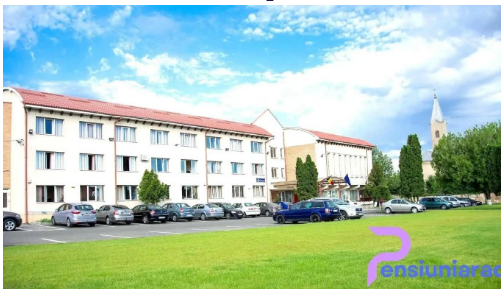
Primăria sanmartin sanmartin