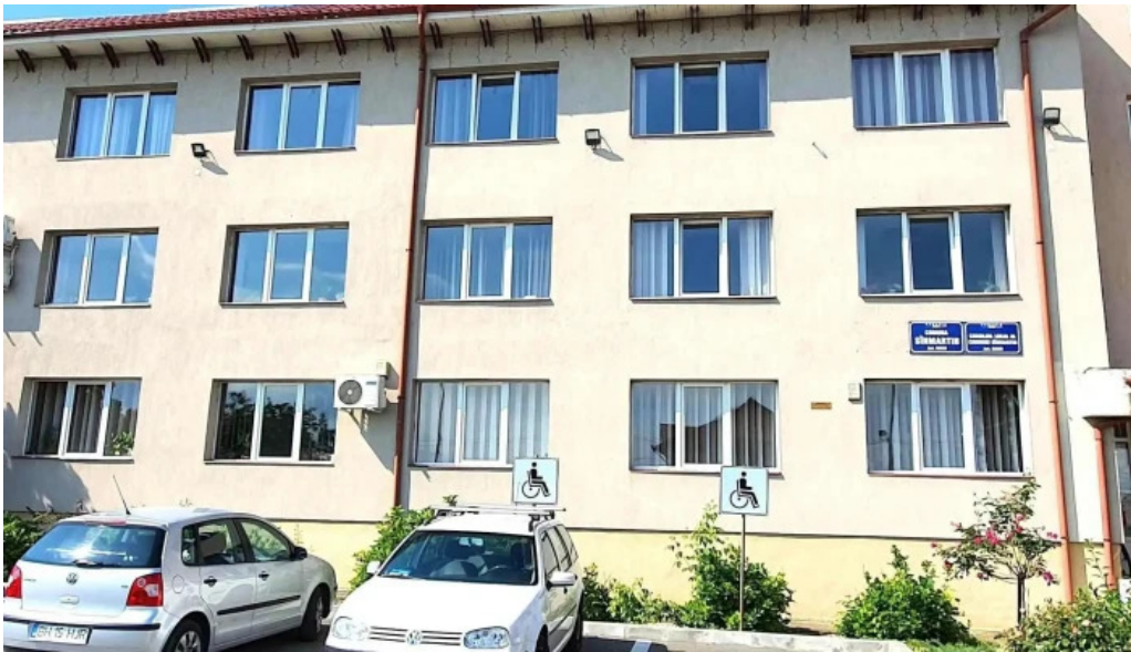
Primaria sanmartin unde