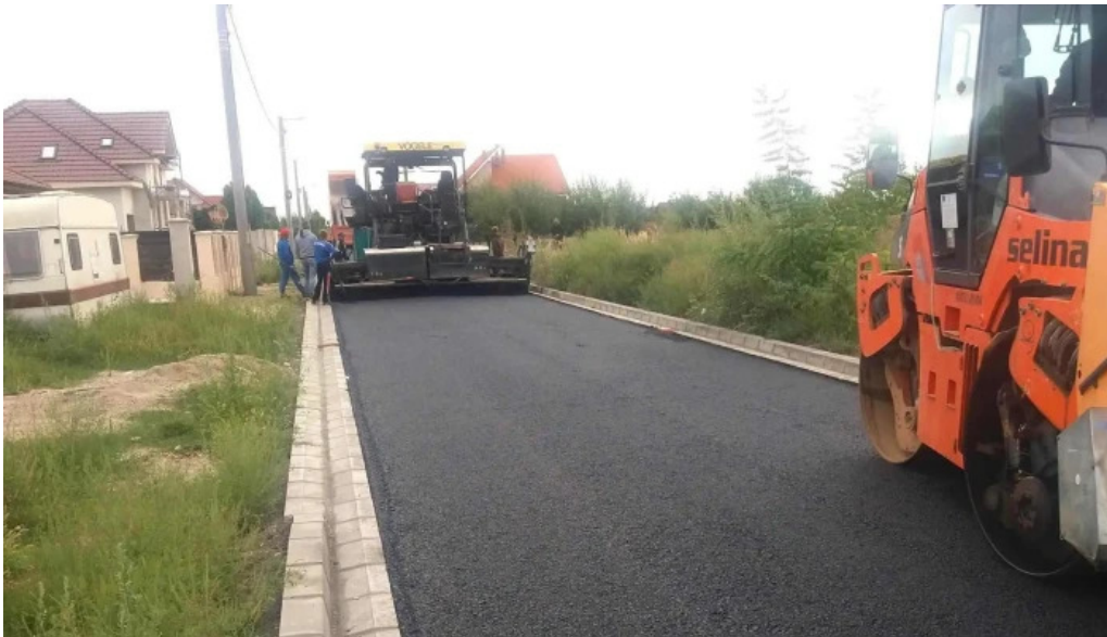
Primaria sanmartin loca?ie