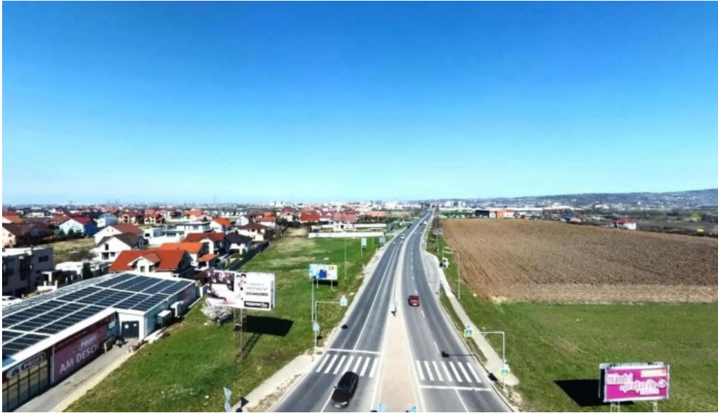
Primaria sanmartin street view si 360deg