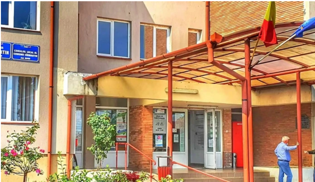
Primaria sanmartin sanmartin