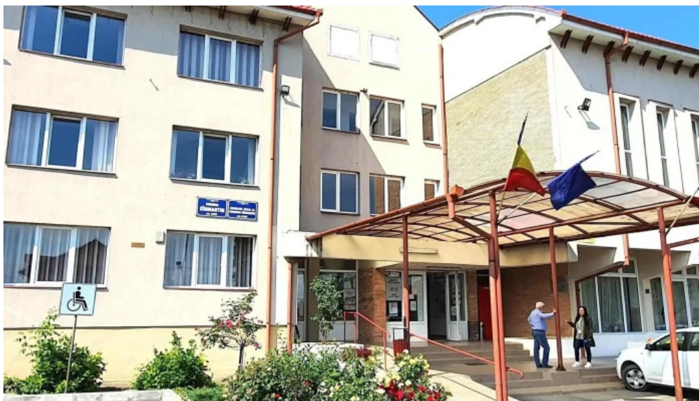
Primaria sanmartin comentarii