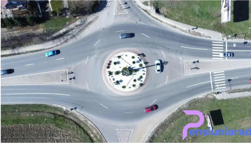
Primaria sanmartin videoclipuri