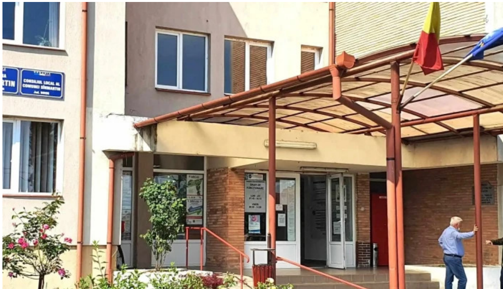
Primaria sanmartin reduceri