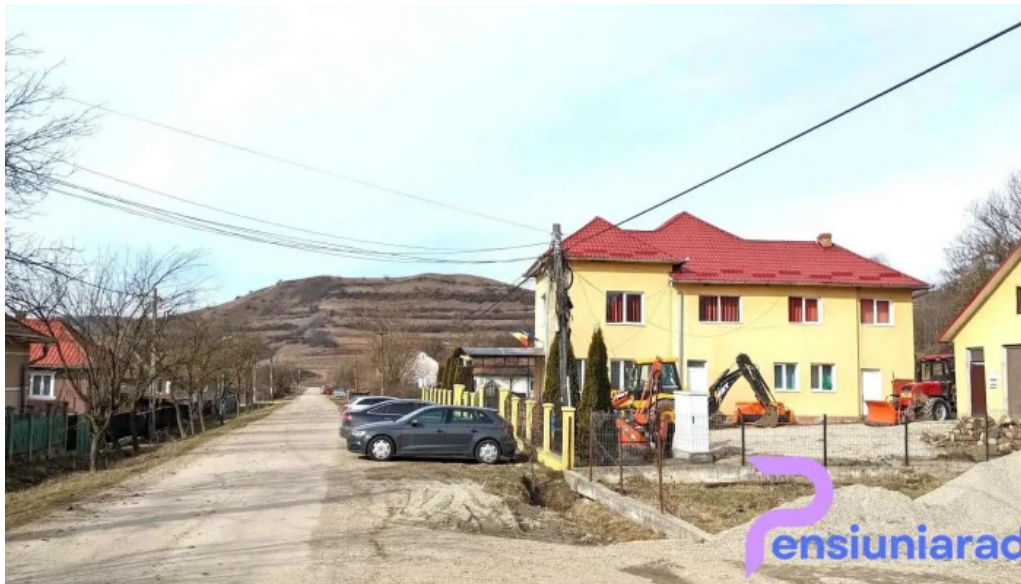
Primaria sanmartin peisaj