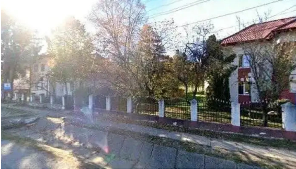
Primaria malureni street view si 360deg