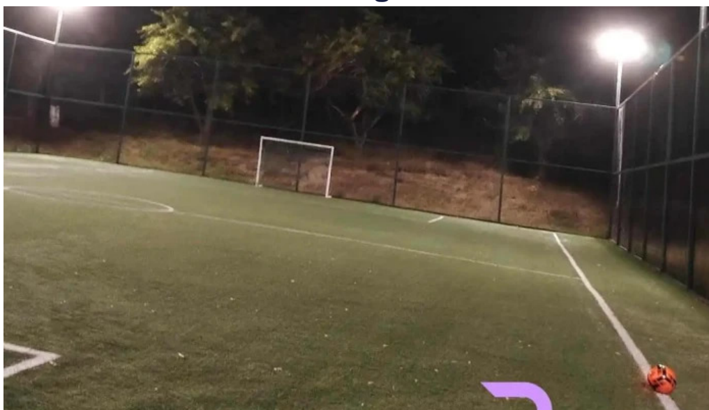
Primăria mălureni mălureni