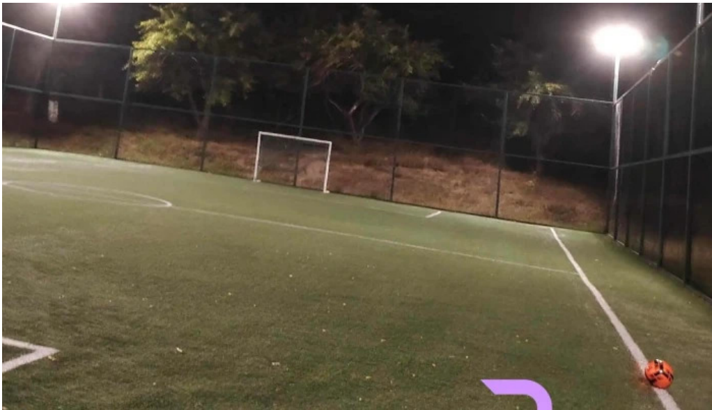
Primaria malureni scor