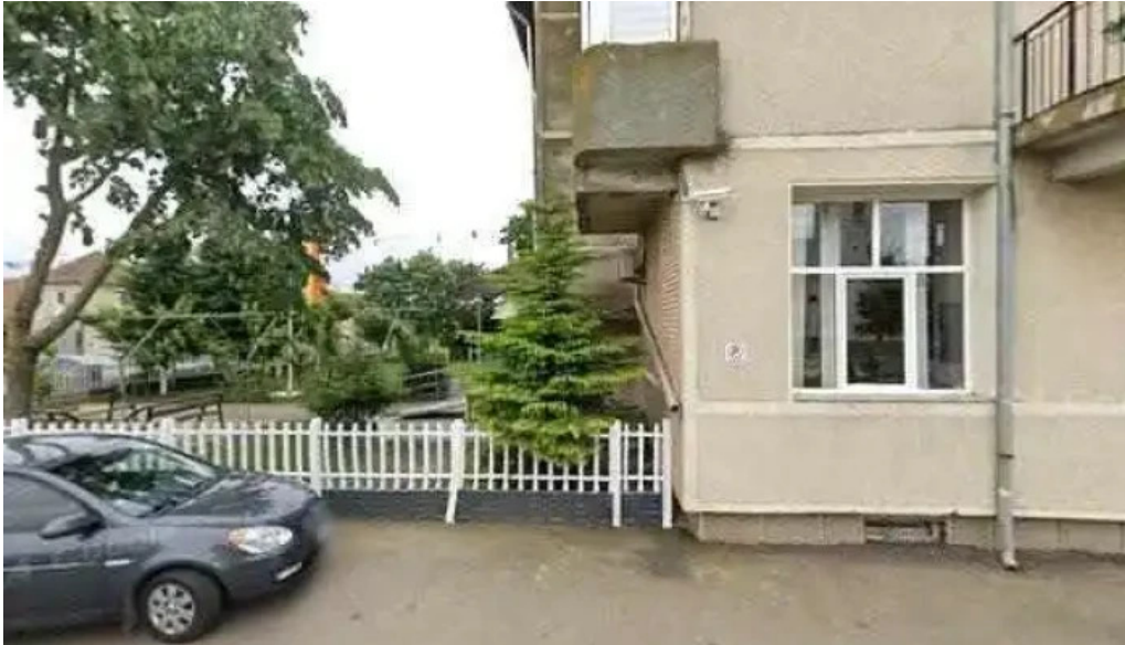
Primaria girisu de cris scor