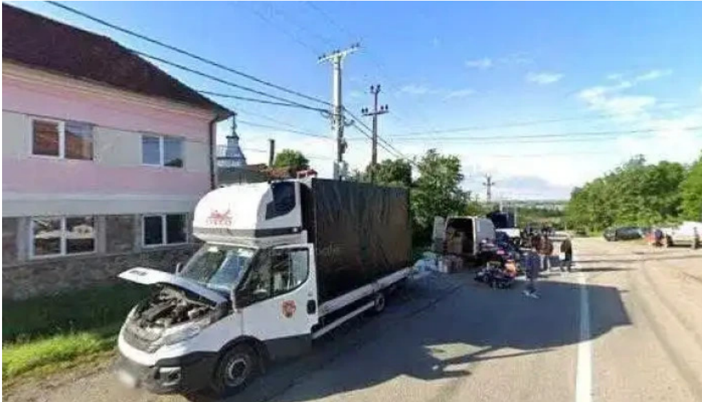
Primaria capalna street view si 360deg