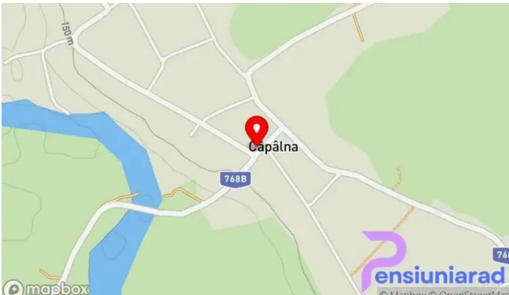
Primaria capalna hart?