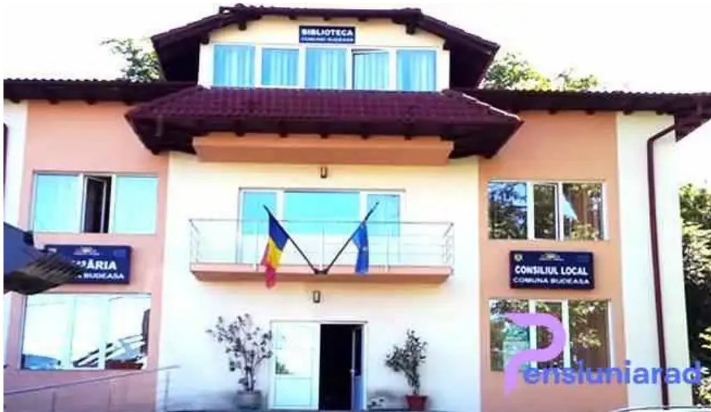
Primaria budeasa cum s? ajungi acolo