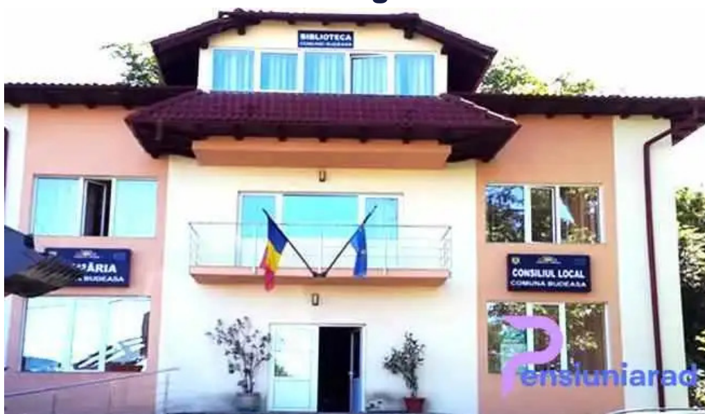
Prim?ria budeasa budeasa mare