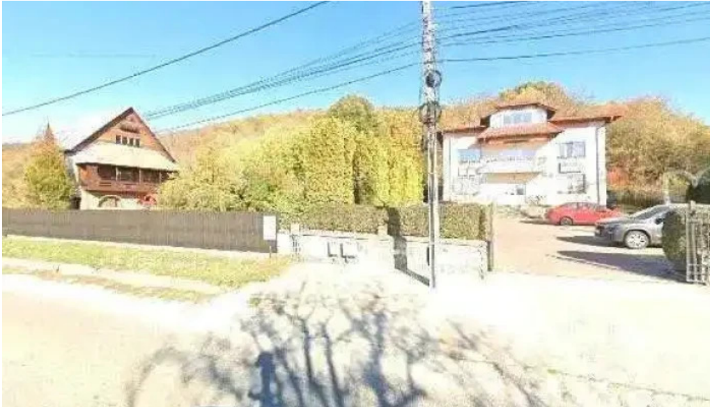
Primaria budeasa street view si 360deg