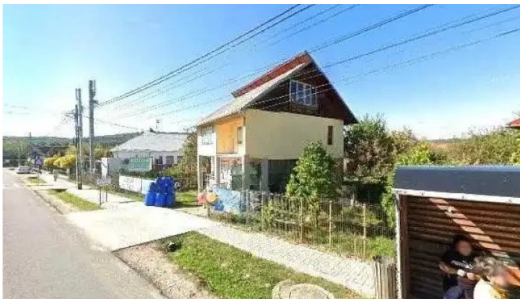
Primaria comunei albestii de arges site web