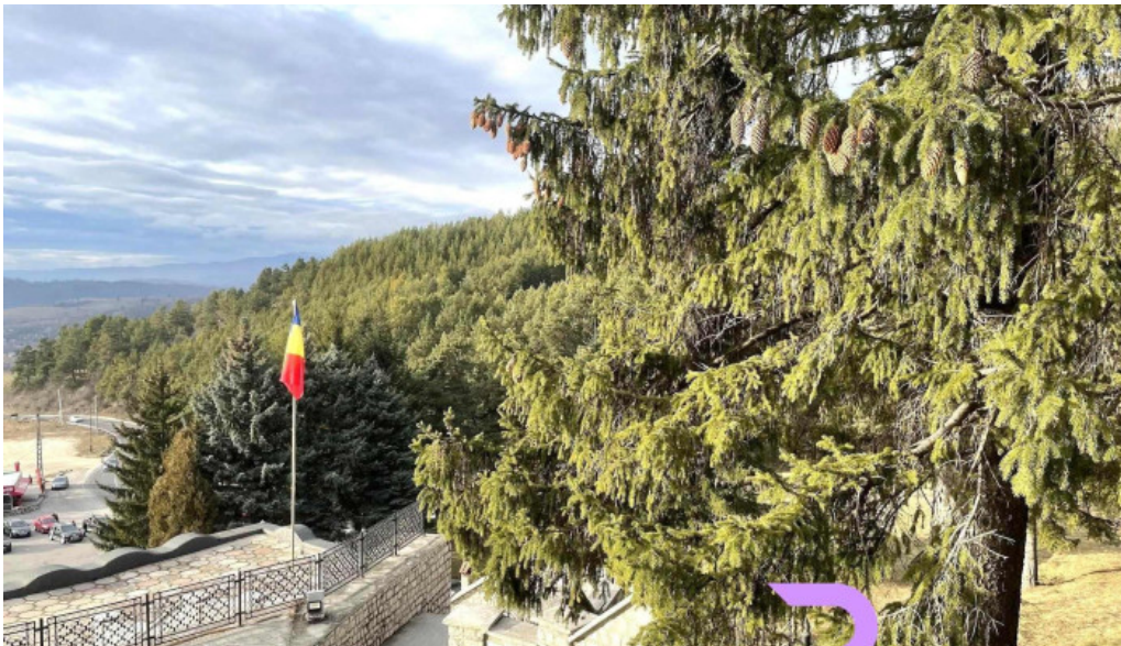
Valea mare pravat promo?ie