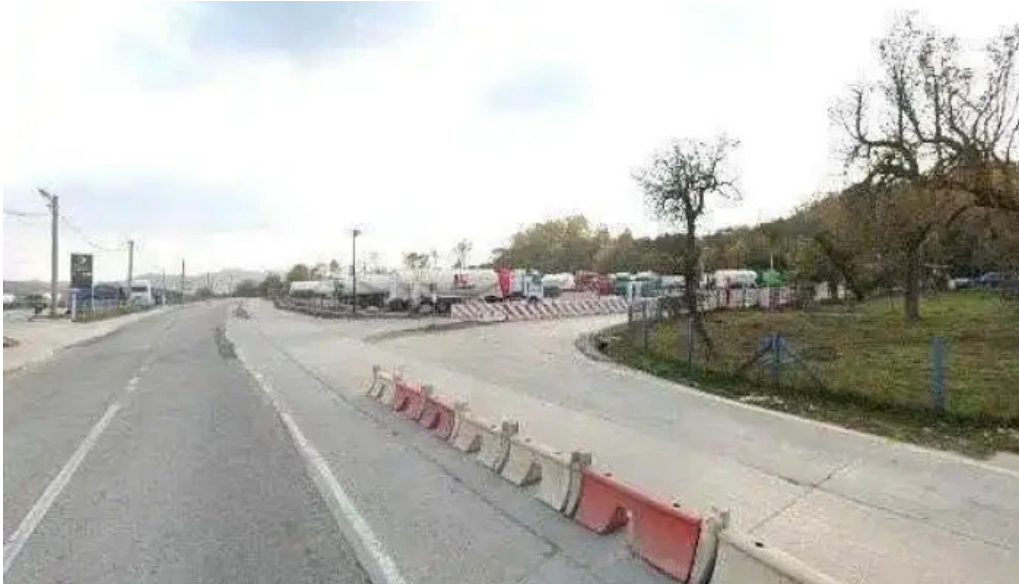
Valea mare pravat street view si 360deg