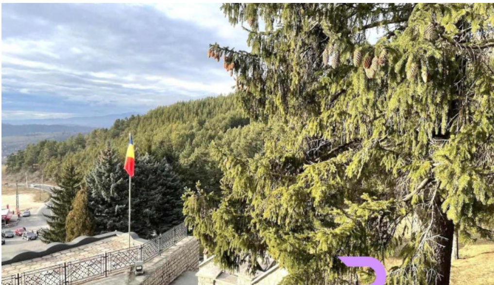
Valea mare pravăț dn72a