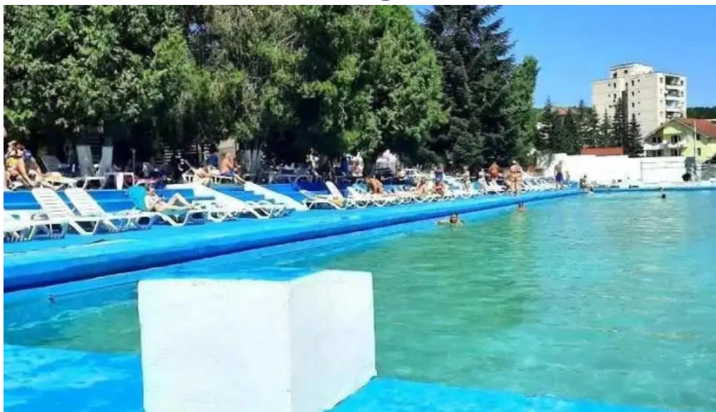
?trand baile daco romane official geoagiu b?i