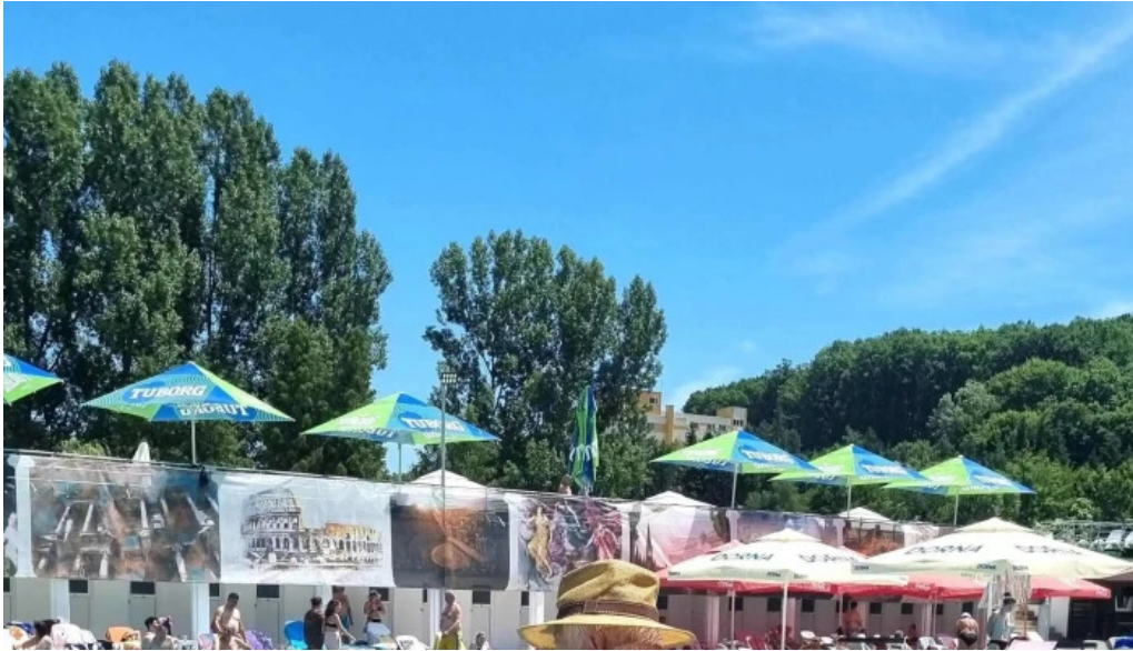
Strand baile daco romane official reduceri