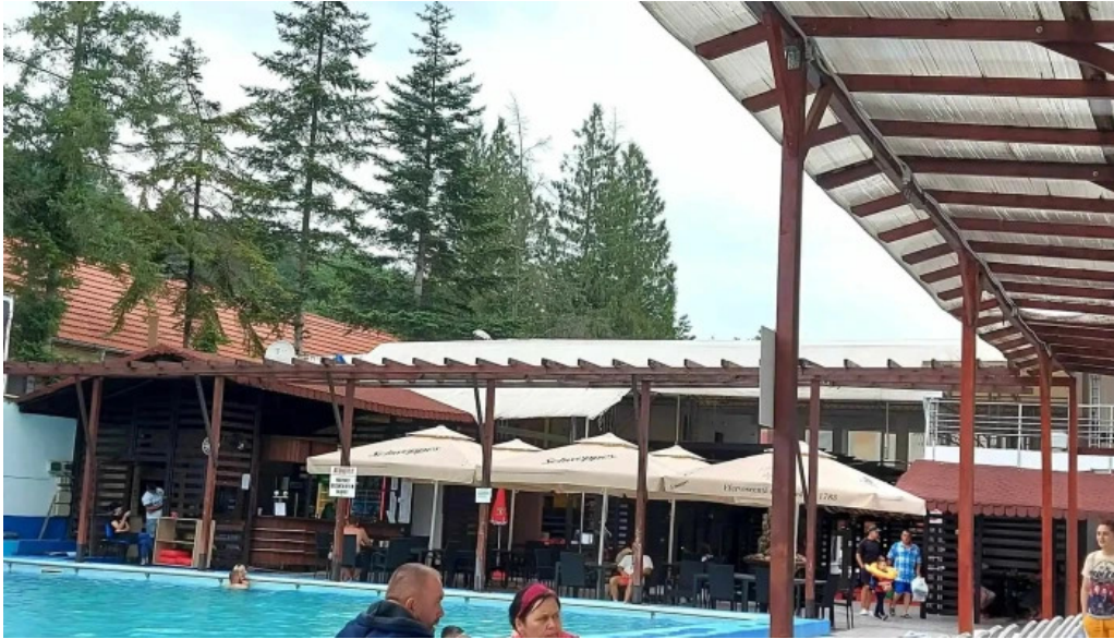
Strand baile daco romane oficial unde