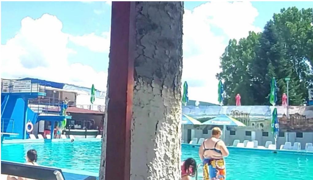
Strand baile daco romane official promo?ie