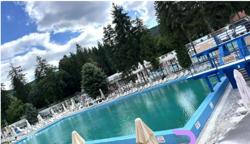
Strand baile daco romane oficial de la proprietar