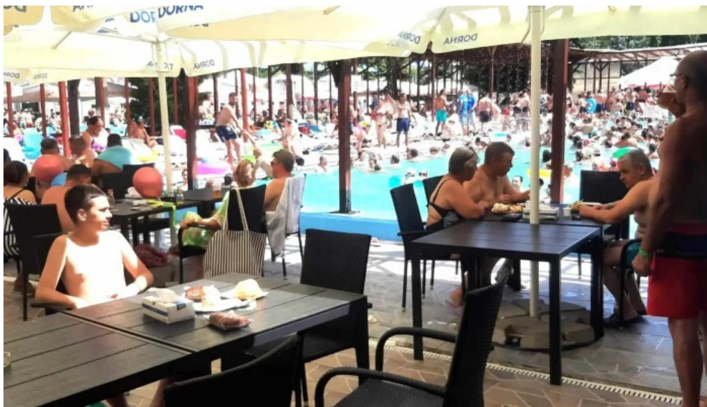
Strand baile daco romane official cum s? ajungi acolo