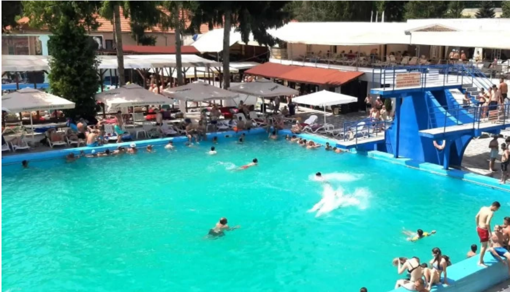
Strand baile daco romane oficial deschis acum