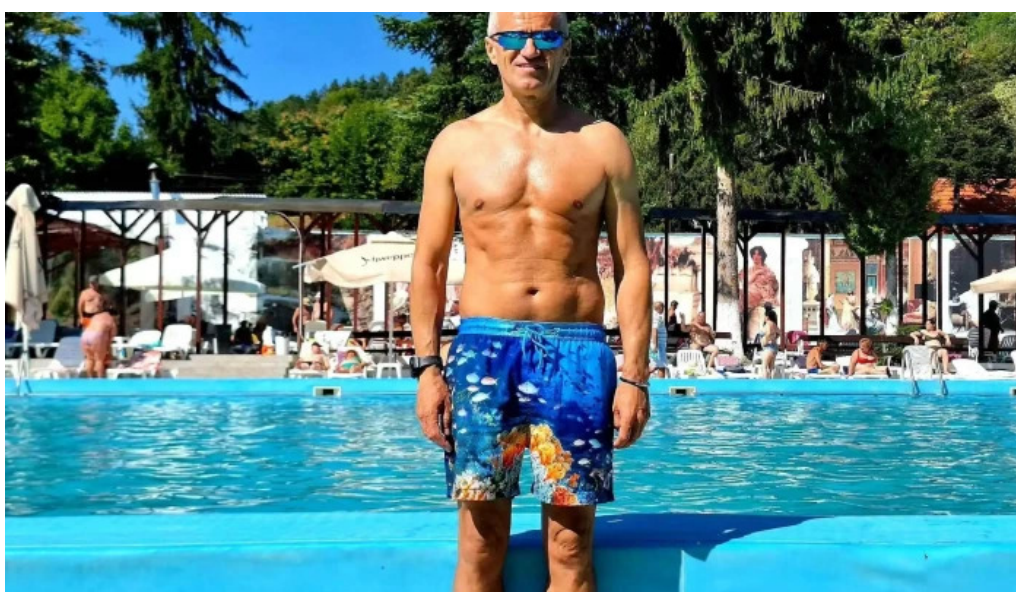
Strand baile daco romane official videoclipuri