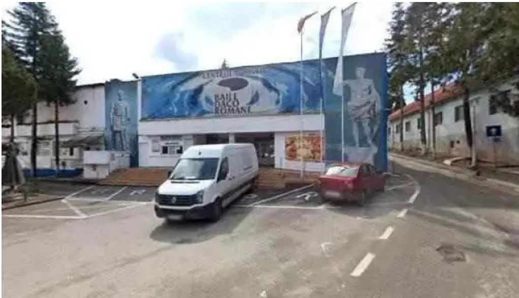
Strand baile daco romane oficial street view si 360deg