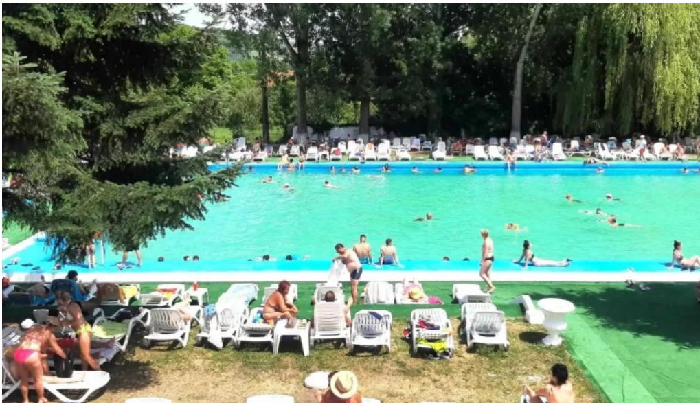
Strand baile daco romane official geoagiu b?i