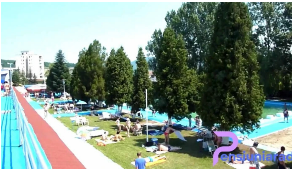
Strand baile daco romane official piscina