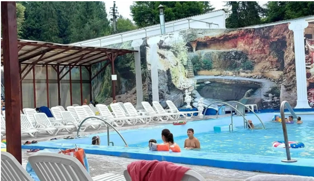
Strand baile daco romane official recenzii