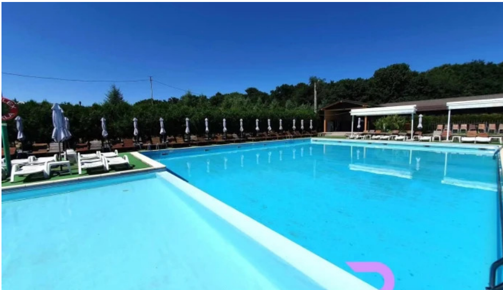
Perla de la proprietar