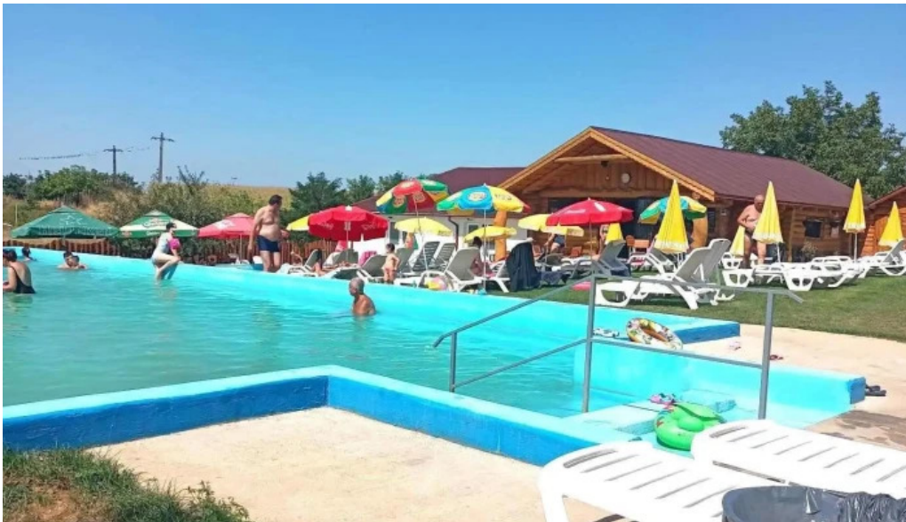
Strand livada de bihor piscina