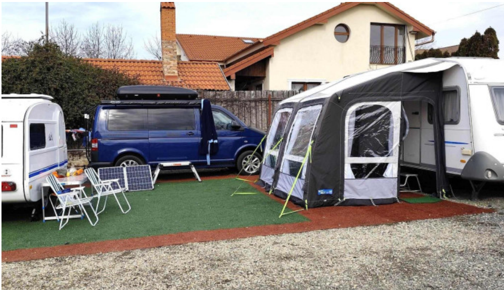
Strand livada de bihor recenzii