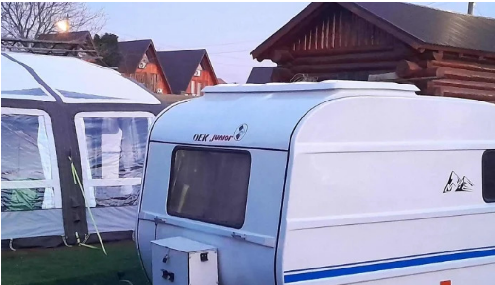
Strand livada de bihor catalog