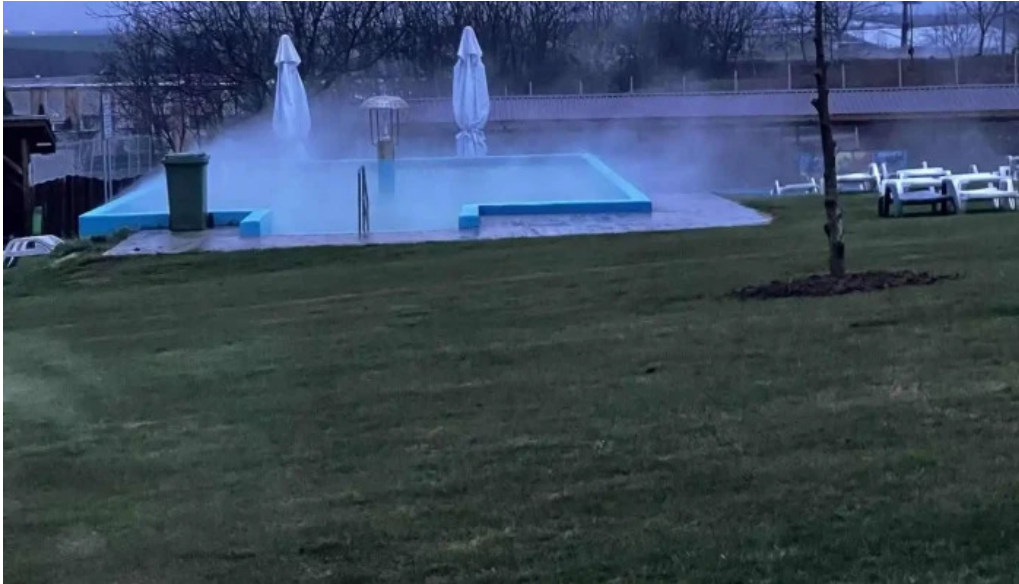
Strand livada de bihor cele mai recente