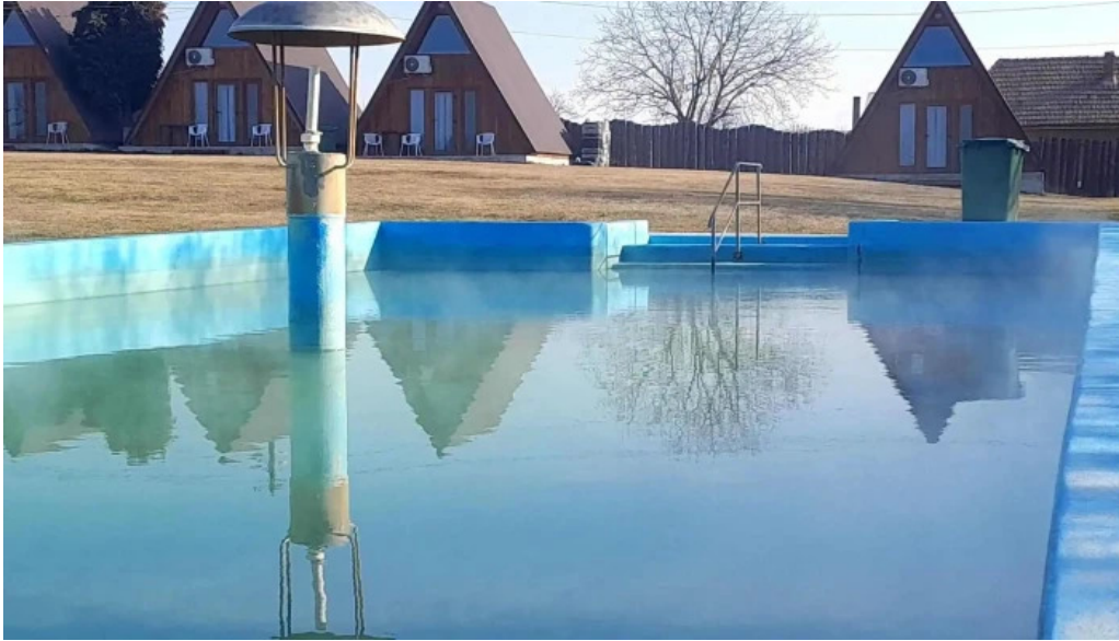
Strand livada de bihor videoclipuri