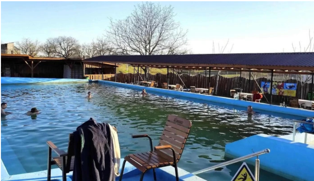
Strand livada de bihor livada de bihor