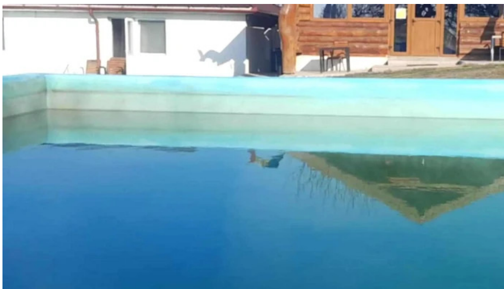
Strand livada de bihor aproape de mine