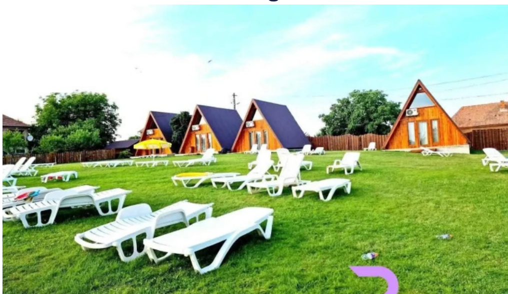
trand livada de bihor livada de bihor