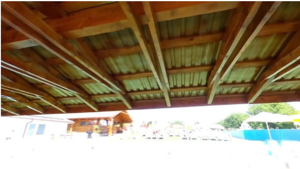
Strand livada de bihor street view si 360deg