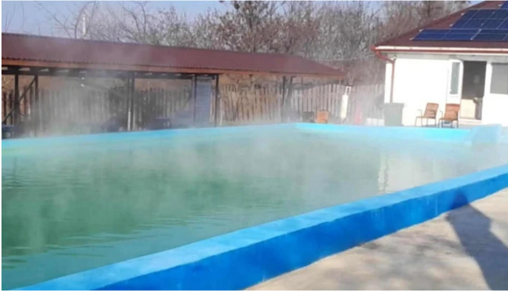
Strand livada de bihor num?r