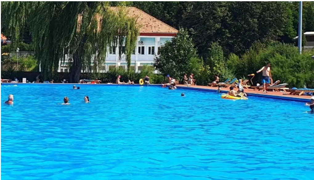
Baza de agrement blaj pre?uri