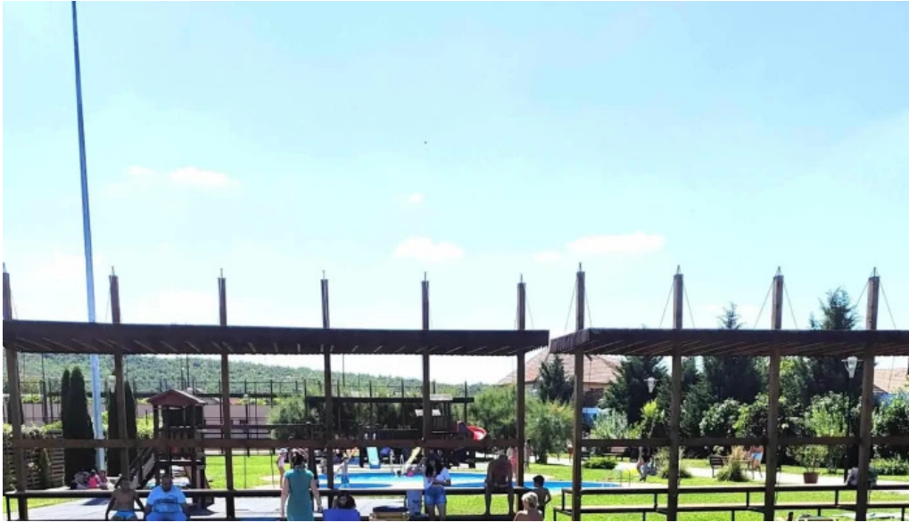
Baza de agrement blaj program