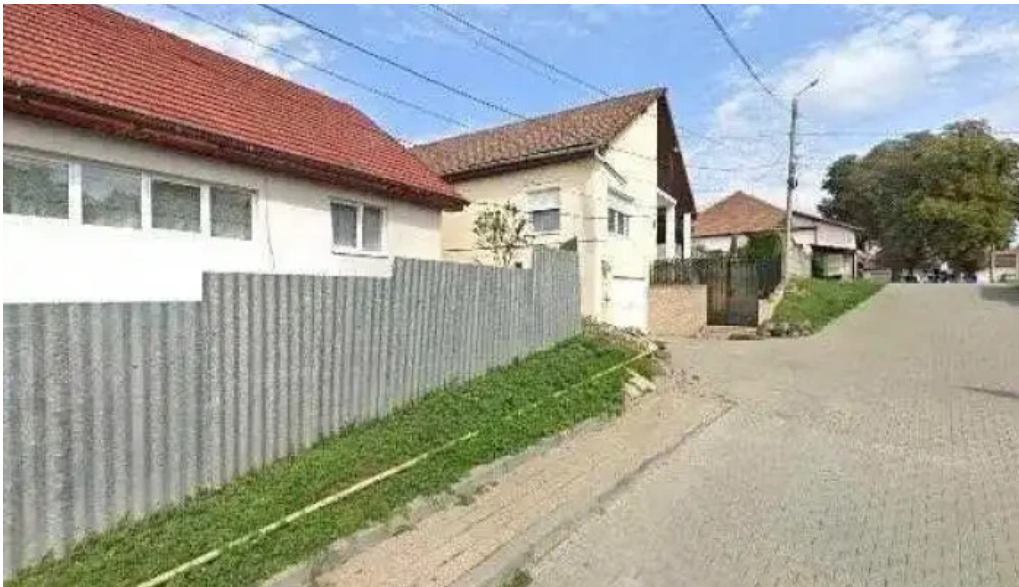
Baza de agrement blaj street view si 360deg