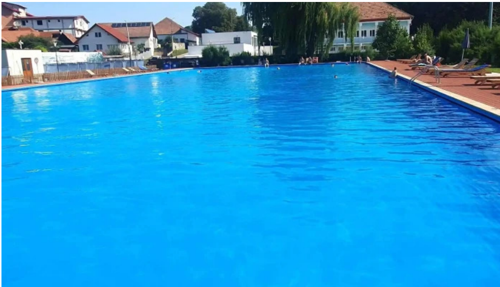
Baza de agrement blaj catalog