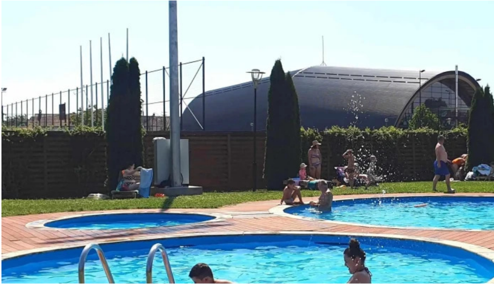
Baza de agrement blaj unde