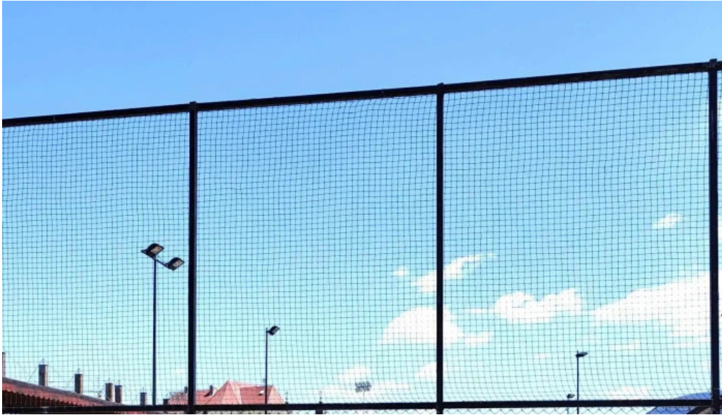
Baza de agrement blaj site web