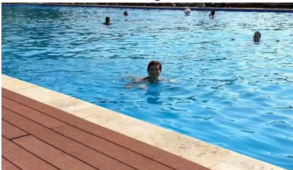
Baza de agrement blaj videoclipuri