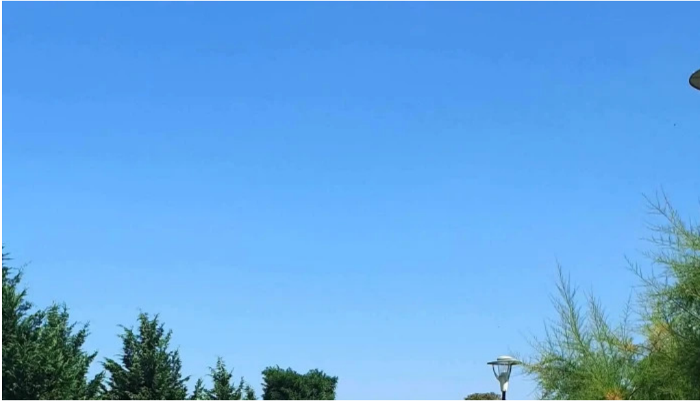
Baza de agrement blaj fotografii