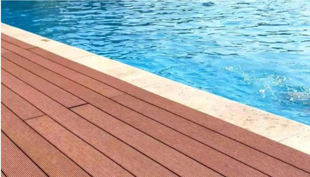
Baza de agrement blaj piscina