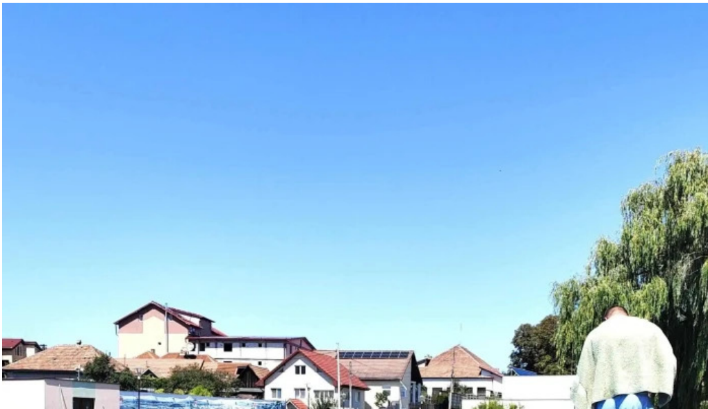
Baza de agrement blaj reduceri