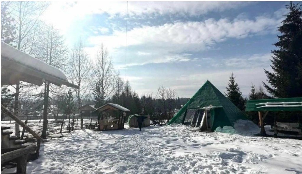
Pensiunea eco hunea program