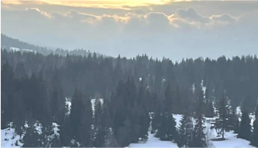
Pensiunea eco hunea cum s? ajungi acolo