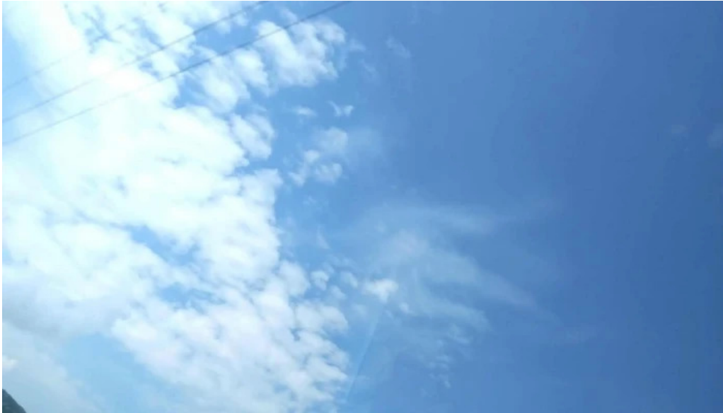
Pensiunea eco hunea loca?ie