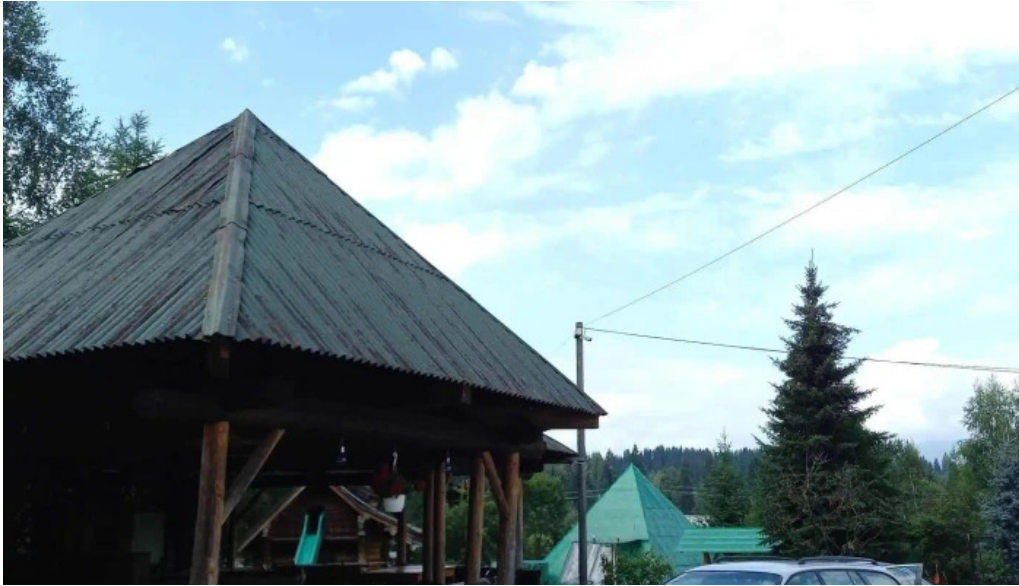
Pensiunea eco hunea num?r