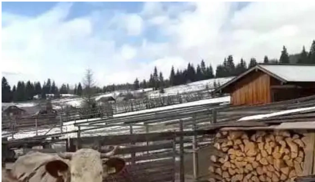
Pensiunea eco hunea videoclipuri