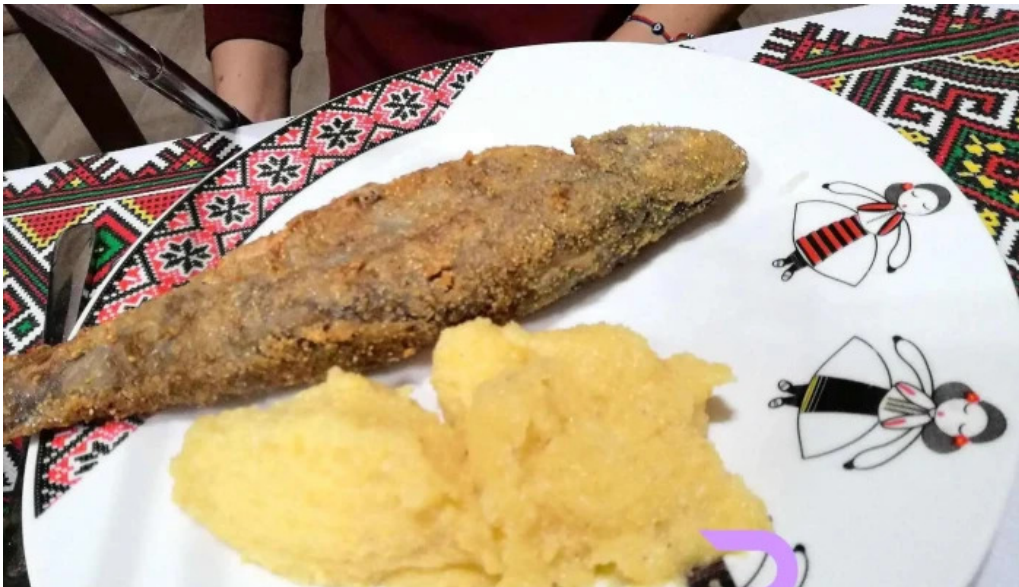
Pensiunea eco hunea mancaruribauturi