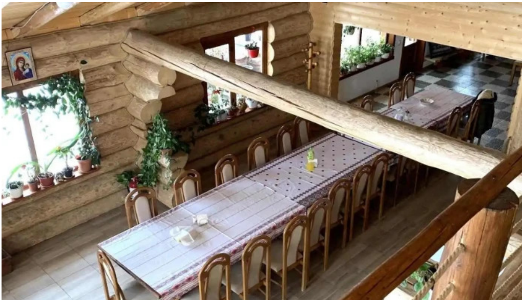
Pensiunea eco hunea de la vizitatori