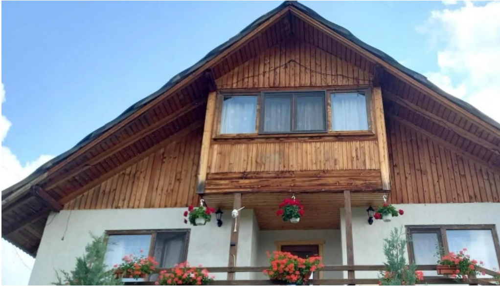
Pensiunea eco hunea promo?ie