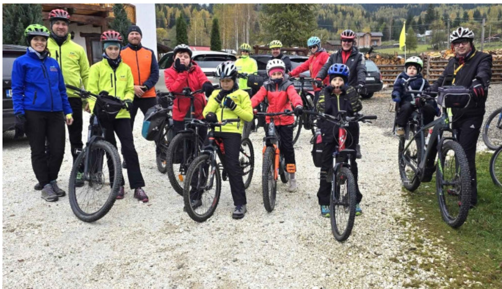
Pensiunea eco hunea vatra dornei