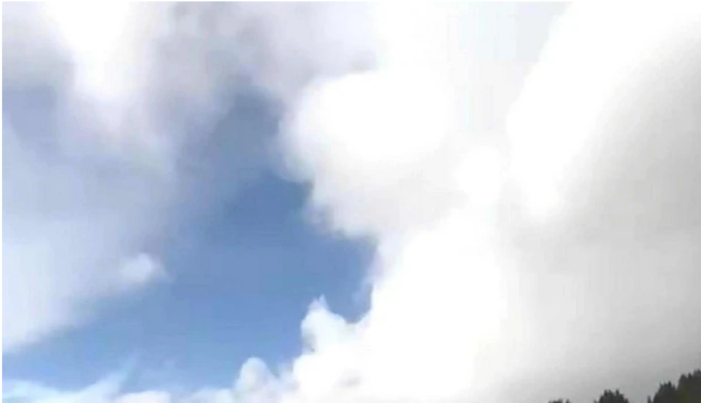
Pensiunea eco hunea scor