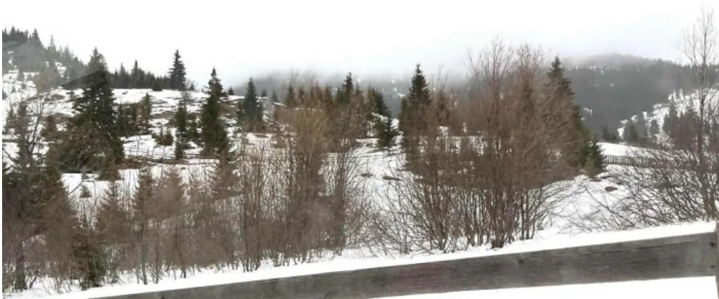
Pensiunea eco hunea catalog