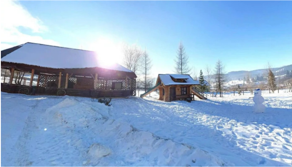
Pensiunea eco hunea street view si 360deg