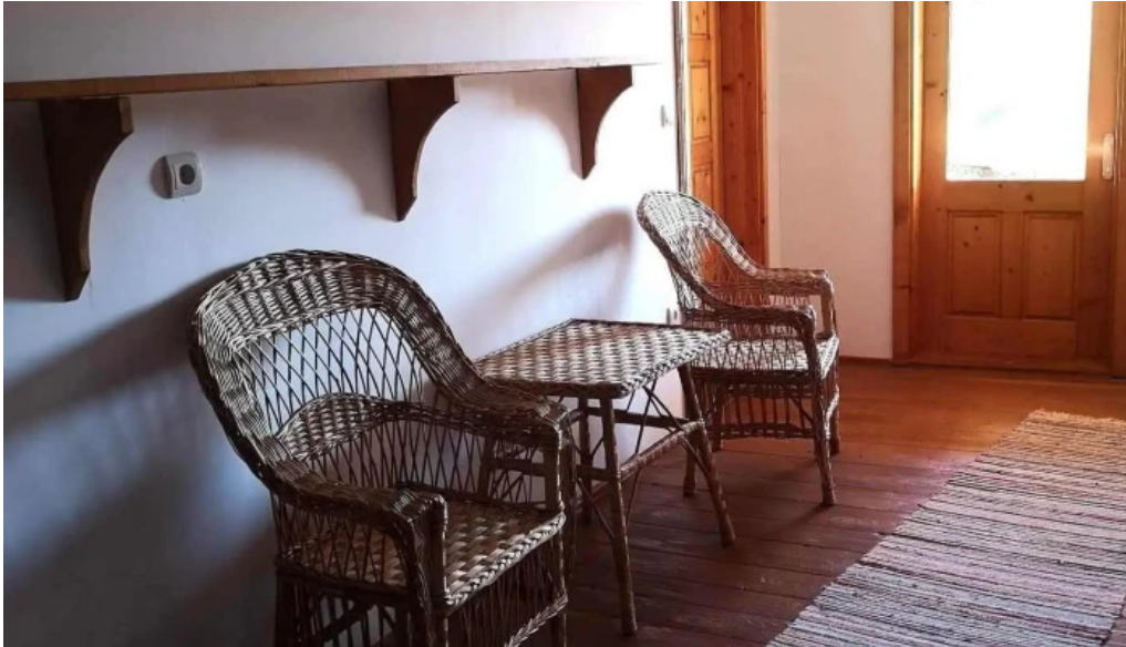
Pensiunea eco hunea camere