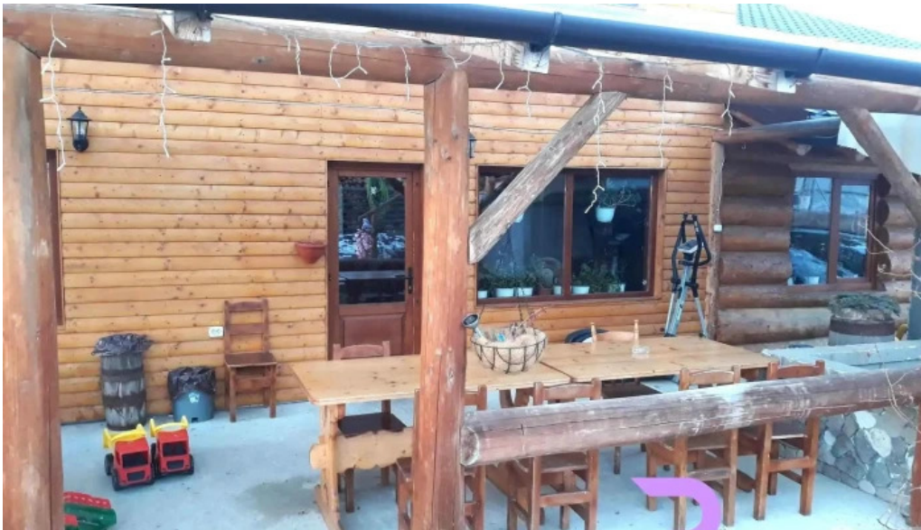
Pensiunea eco hunea exterior